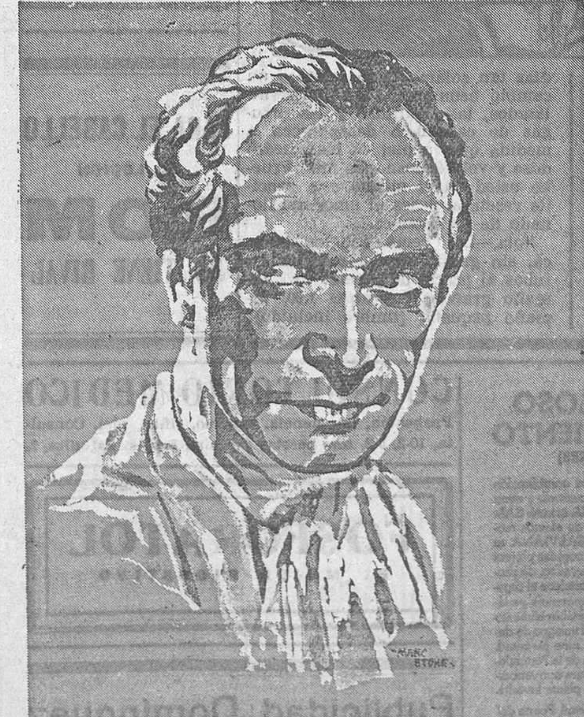
El famoso actor Conrad Veid, protagonista de «Ambición», el grandioso film de la Gaumont British que el lunes se estrenará en el Palacio de la Música

por WALLACE BEERY y JACKIE COOPER Film M.-G.-M.