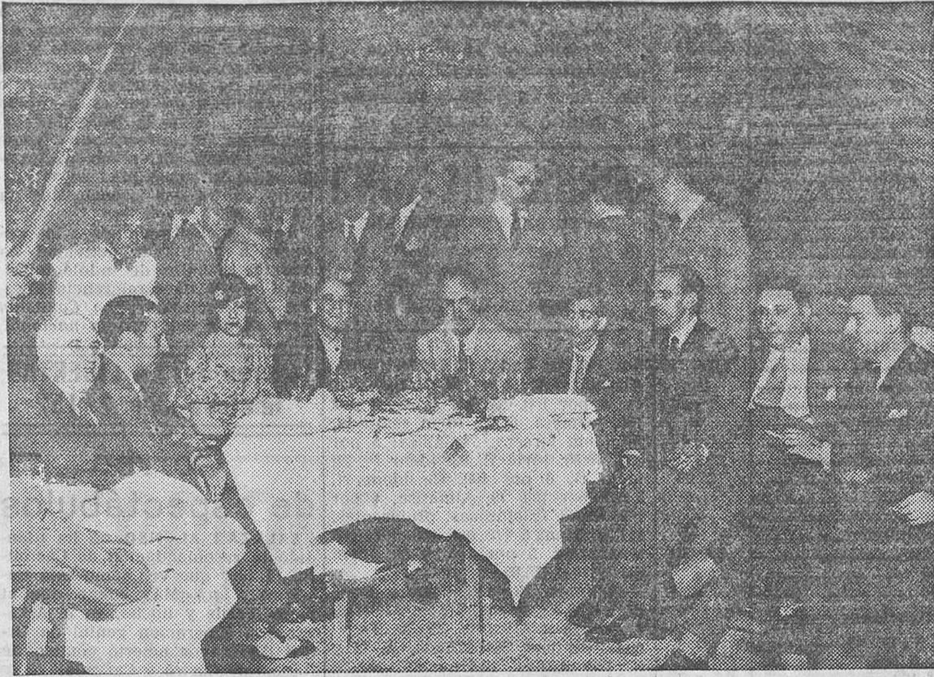
Grupo de profesionales, artistas y periodistas de cinematografía asistentes al acto de la inauguración de los Estudios Roptence

Reconstitución histórica asombrosa y modelo de películas biográficas, «Ambición» es la mejor obra salida de los estudios ingleses en el renacimiento que iniciaron películas como «La vida privada de Enrique IV» y «Catalina de Rusia». «Ambición» es la trágica vida de un hombre de oscuro origen, que sacrificó en aras de la codicia el amor, el nombre y, al fin, hasta la vida. Tan complicado personaje no podía ser encarnado más que por un actor del talento de Conrad Veid, y este genial trágico logra crear un portentoso tipo de compleja psicología. El público madrileño sabrá ajuiciar lo que supone el presentar un film como «Ambición» en pleno verano. Pero como en el Palacio de la Música, merced a su refrigeración, hay un ambiente sano, fresco y grato, es explicable el deseo de la Empresa Sagarra de presentar en este magnífico salón programas de la mayor altura artística en toda época.