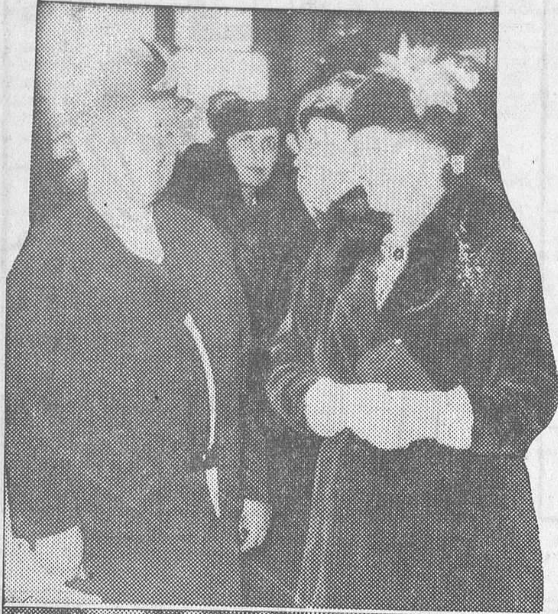
Intimidad solución de la disputa del Chaco.

b) Que las partes declarasen terminadas sus hostilidades. c) Que ambas partes conviniere en retirar sus tropas respectivas, concentrándolas, Bolivia, en dos núcleos situados en Ballivián y Robosé, y Paraguay, sobre el río de este nombre; y d) Como consecuencia, las partes convendrían en reducir sus efectivos militares a los de tiempo de paz, acordando, por tanto, la desmovilización.