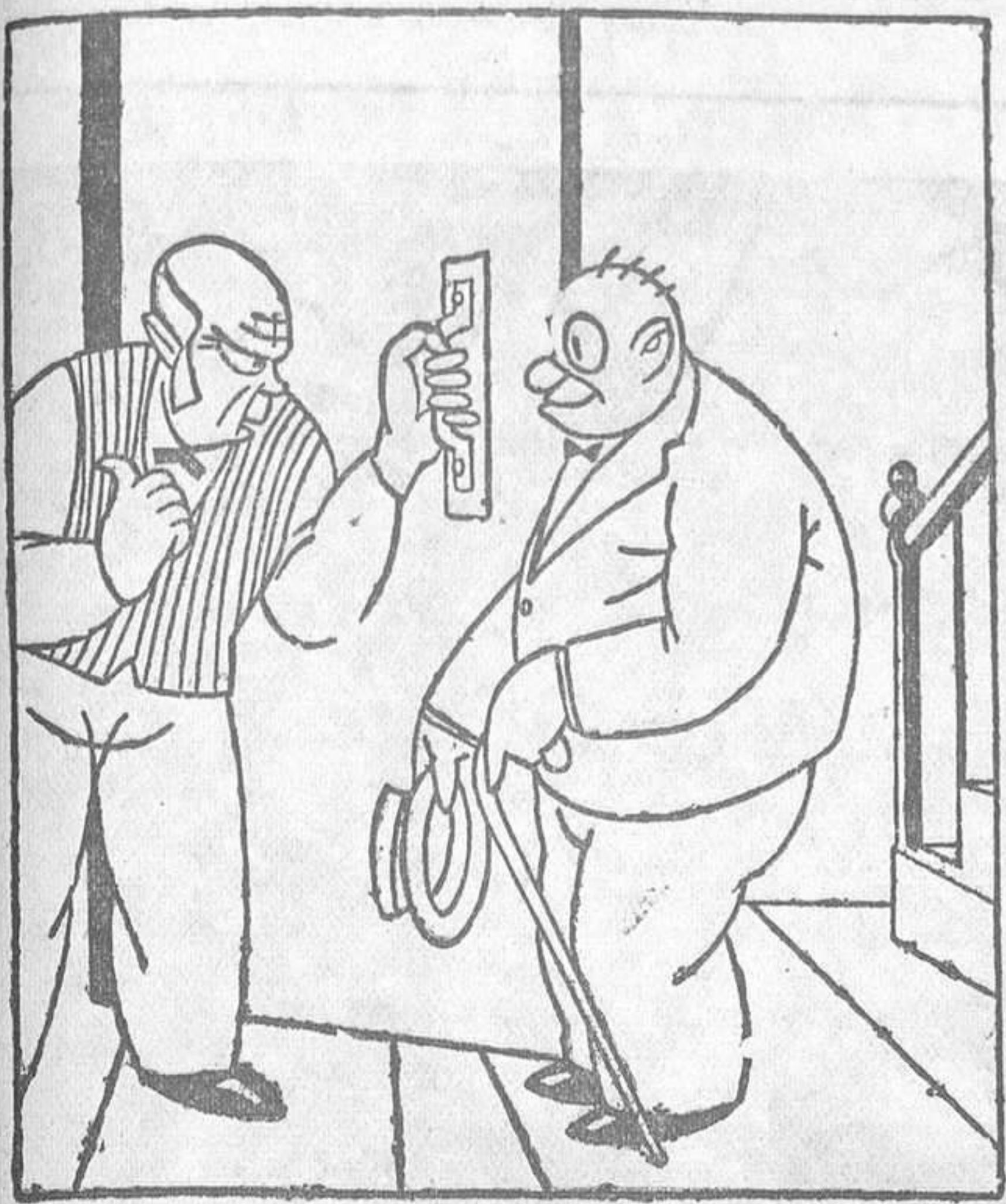
—Si, señor, aquí es; pero no está. Ha ido al cementerio. ¿Quiere pasar el señor?