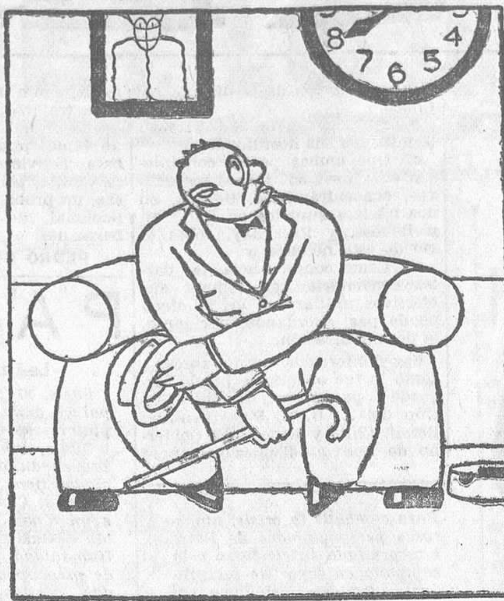
—¿Qué barbaridad lo que tardar!