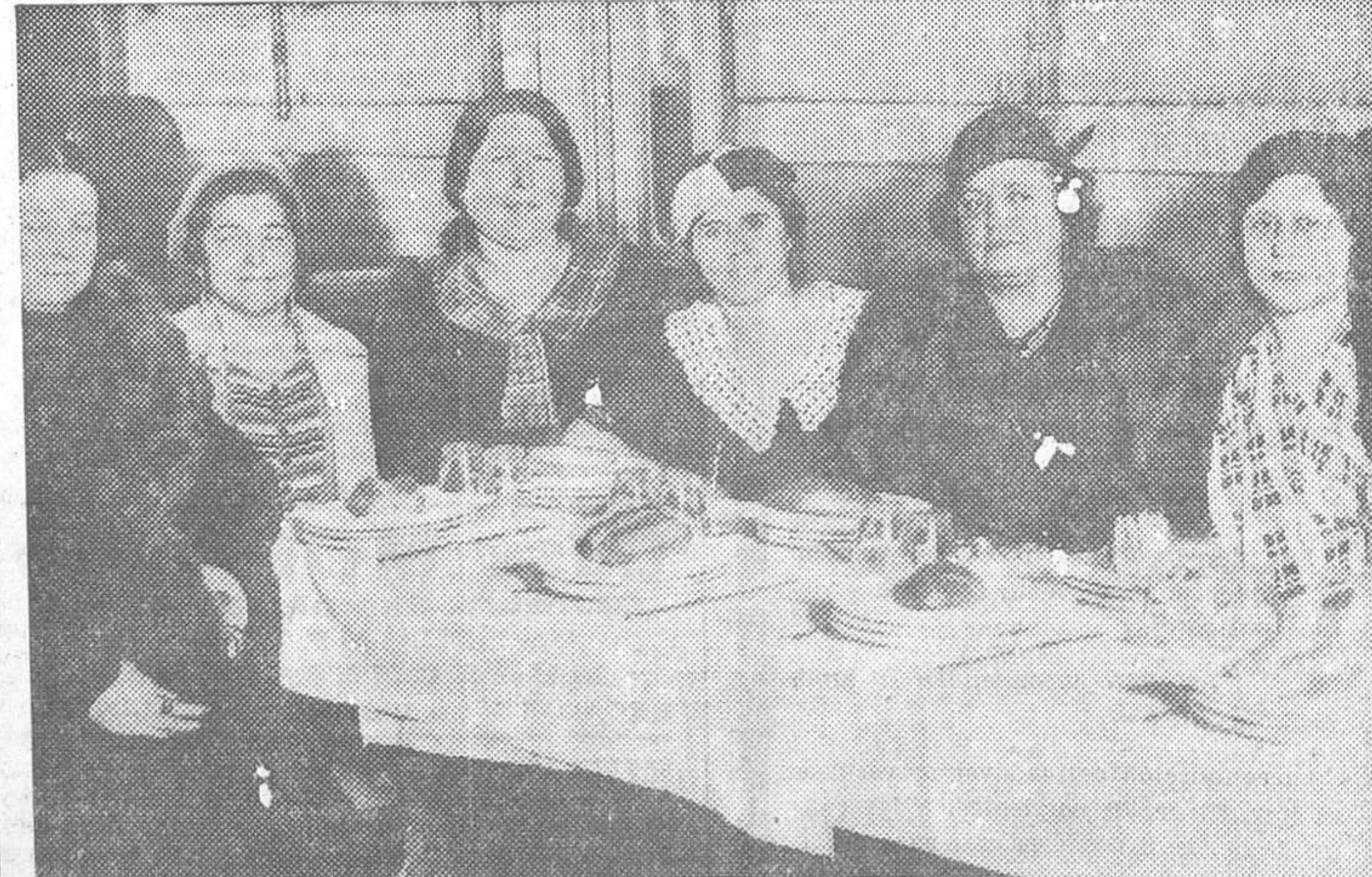
Grupo de algunas de las matronas reunidas ayer en una comida para celebrar el que haya sido aprobado su contrato de trabajo