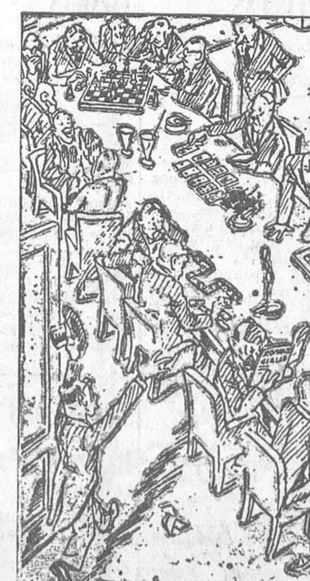
Cómo habrá que transformar la Sociedad de Naciones para que todo el mundo vuelva, incluso el Japón