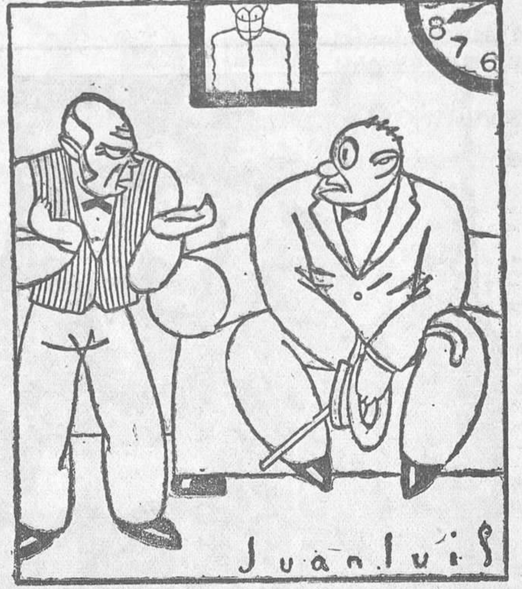
—¿Y decía usted que había ido al cementerio?... —Sí, señor. ¡Es que fué «de muerto»! ¿Sabe usted?