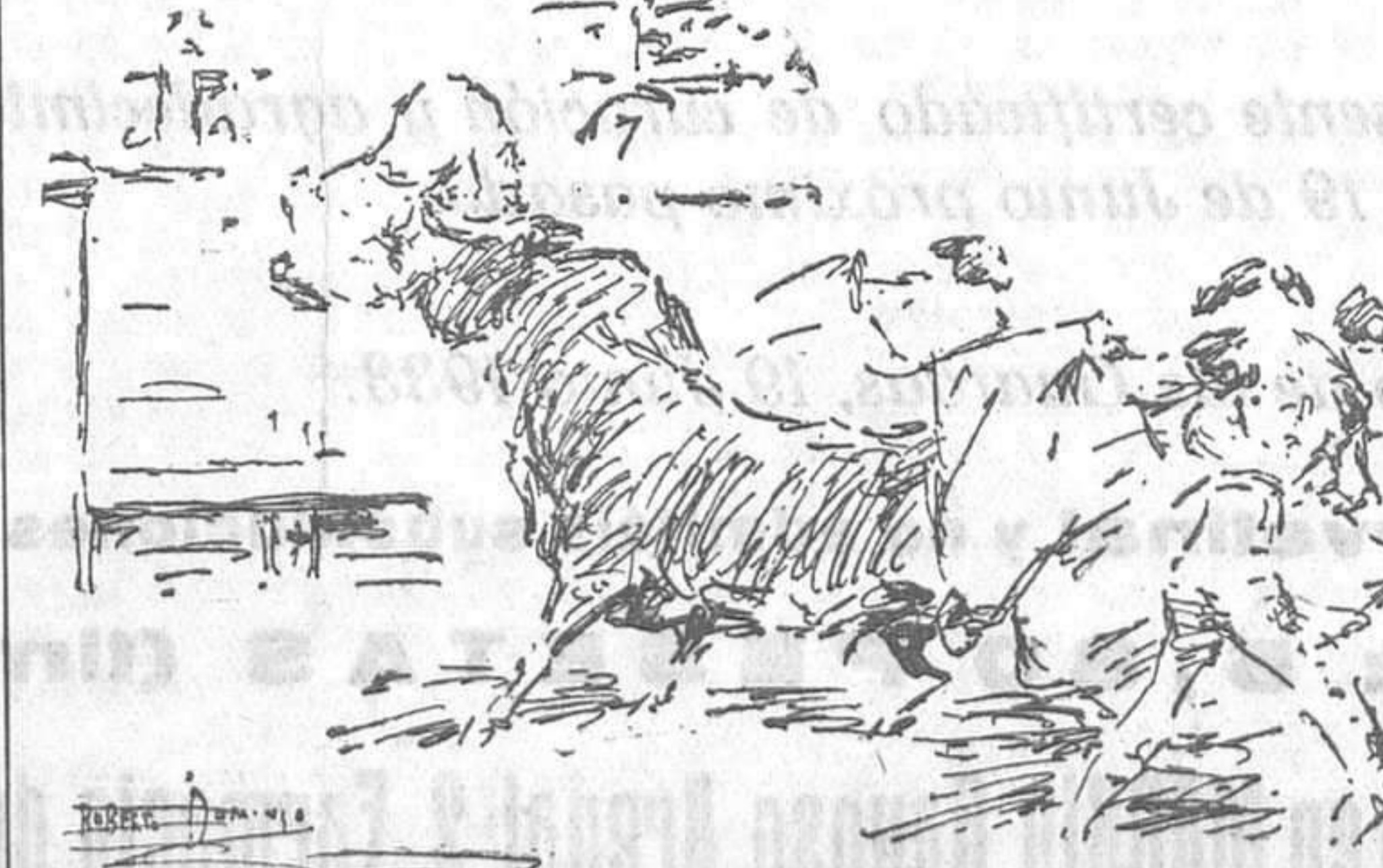
LA NOVILLADA DEL DOMINGO EN MADRID.—Emocionante cogida de Manolete en el sexto toro (Apuntes del natural por Roberto Domínguez)

Belmonte, 2.—Con buena entrada y extraordinaria animación se ha celebrado la anunciada corrida de feria, lidiándose ganado de López Cobos, que resultó manso. Barrera dió una gran tarde de toros. Con el capote lanceó admirablemente a sus dos enemigos,