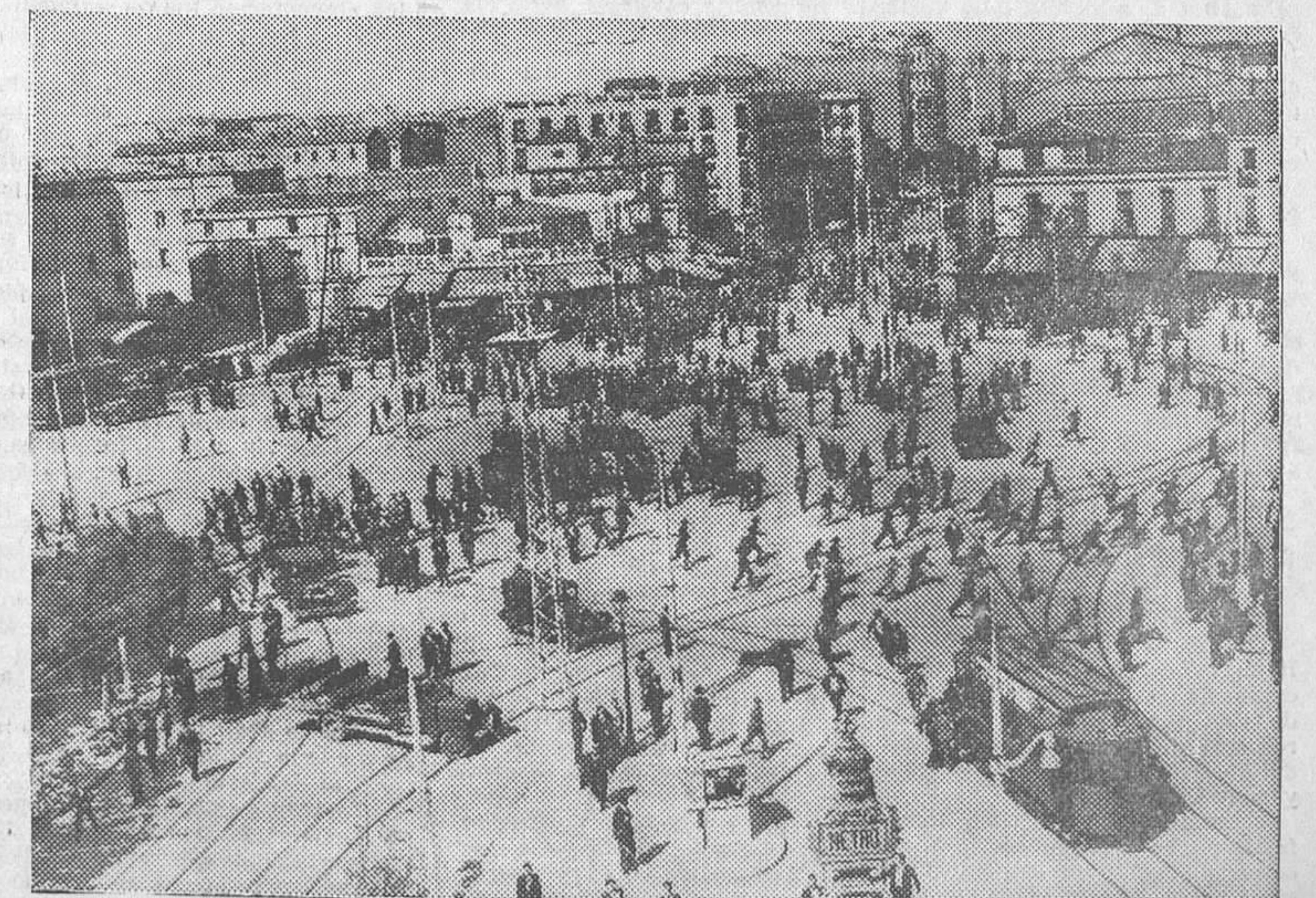
Aspecto que ofrece el domingo la glorieta de Cuatro Caminos al salir el público del mitin socialista celebrado en el Cinema Europa y producirse algunas alteraciones entre el público