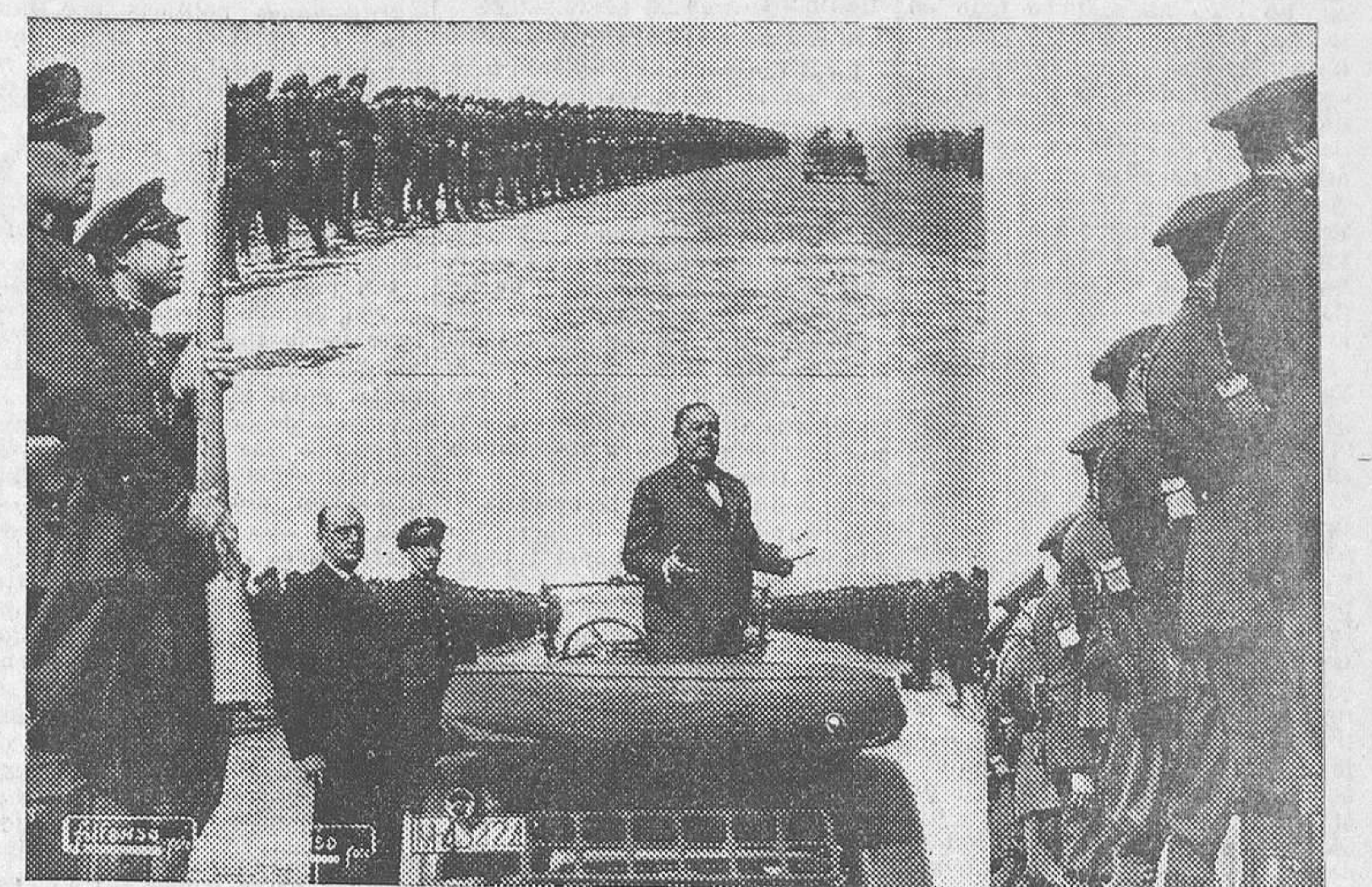
El ministro de la Gobernación, D. Diego Martínez Barrios, pasando revista el domingo a las fuerza de Seguridad y asalto en su campamento de Carabanchel