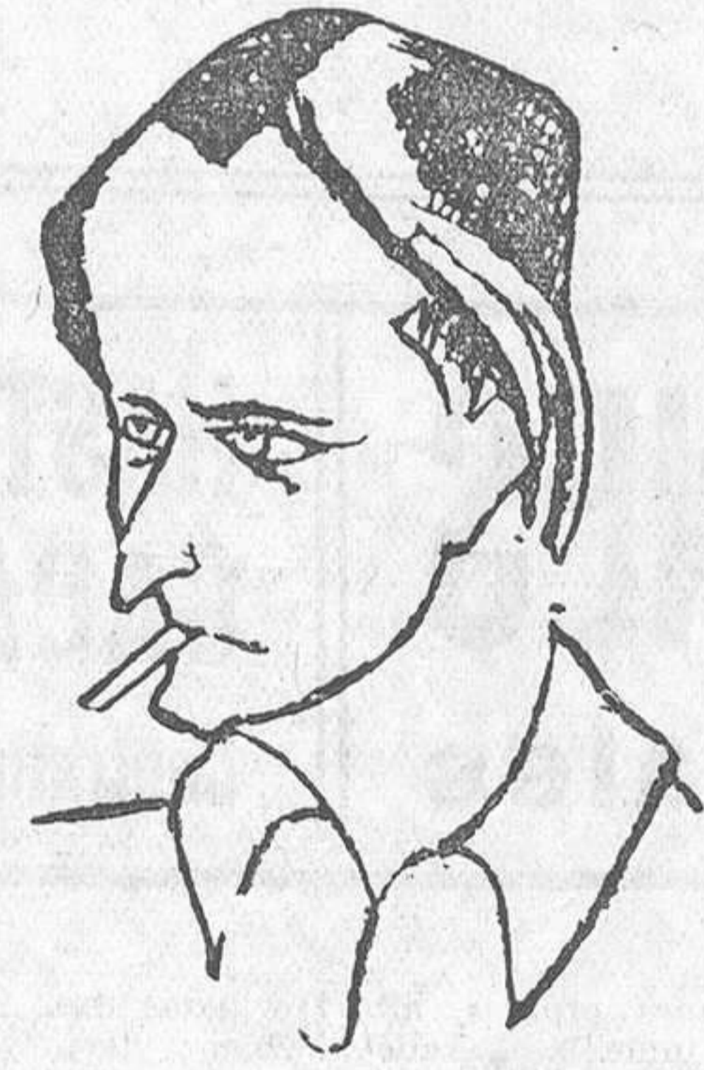
Monseñor André Malraux

Paris, 18 de Marzo.—André Malraux acaso significa la expresión más concreta y más terminantemente lograda del escritor actual. Su dinamismo personal alcanza naturalmente a las fórmulas de su literatura. Es un verdadero ciudadano del Mundo. Es decir, que con la misma desenvoltura se produce en todas las latitudes de la Tierra. Y con igual sencillez se somete a todas las emociones. En cuanto a la concreción de ellas, tampoco es cosa que le signifique la precisión de te-