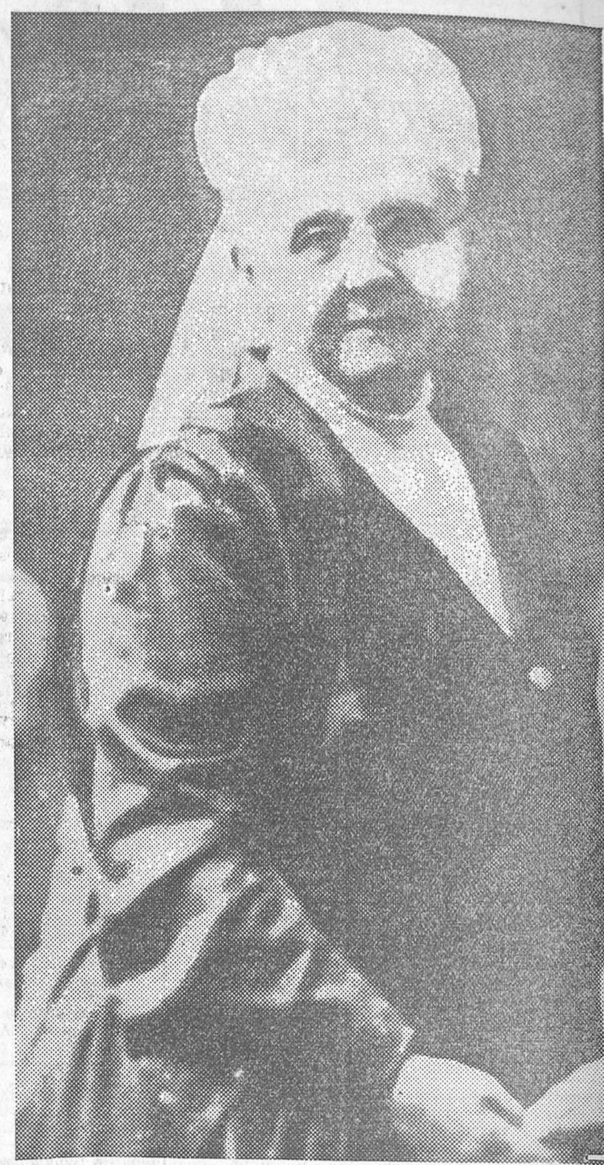
La reina Emma de Holanda, que falleció ayer en La Haya

—Padre, ¿es verdad que hay algunos animales que cambian de piel todos los años? —Sí; pero no hables de eso delante de tu mamá. (Gringoire)