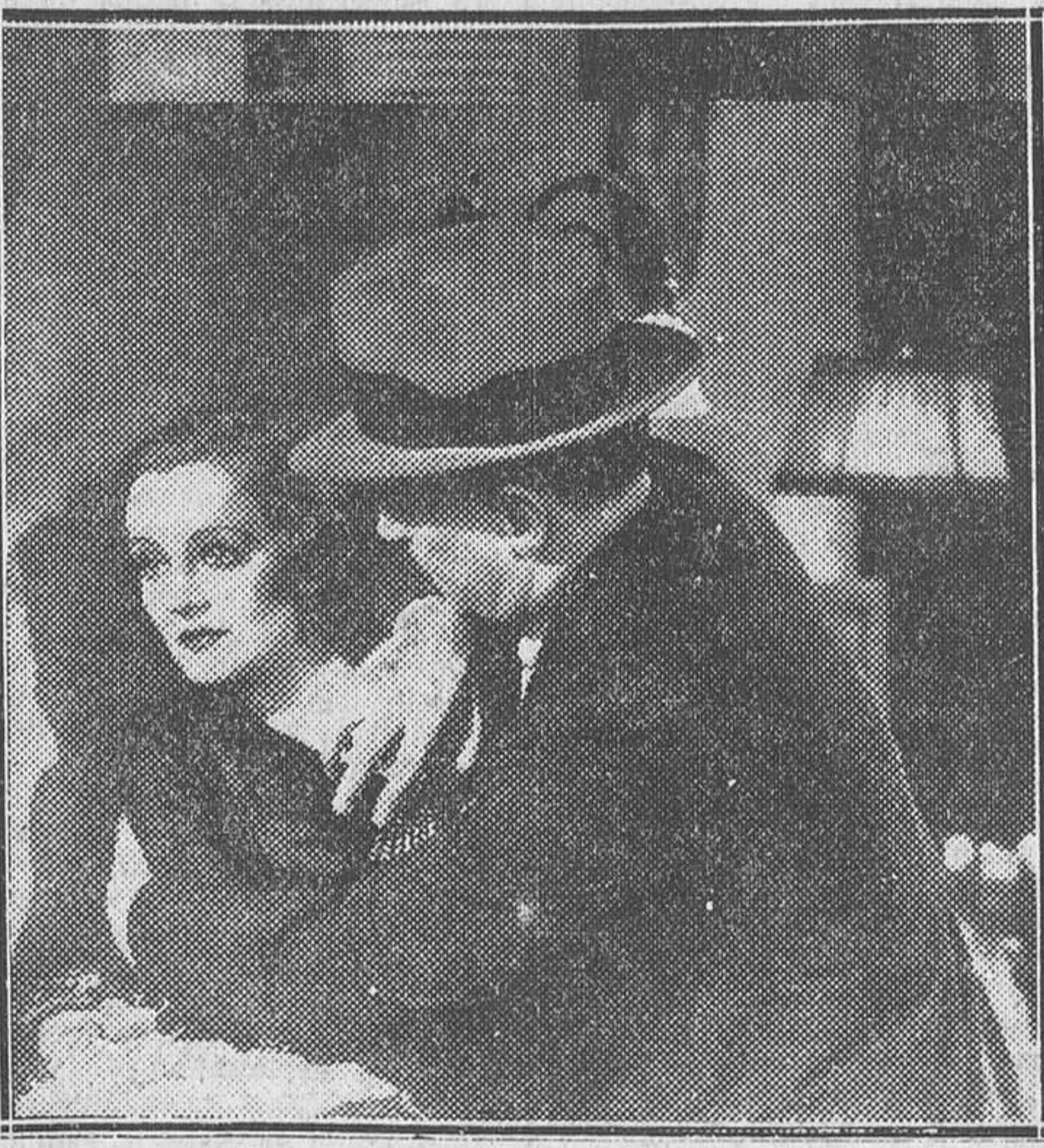
TALLULAH BANKHEAD EN UNA ESCENA DE «REDIMIDA», FILM PARAMOUNT QUE EL LUNES SE ESTRENA EN EL ASTORIA