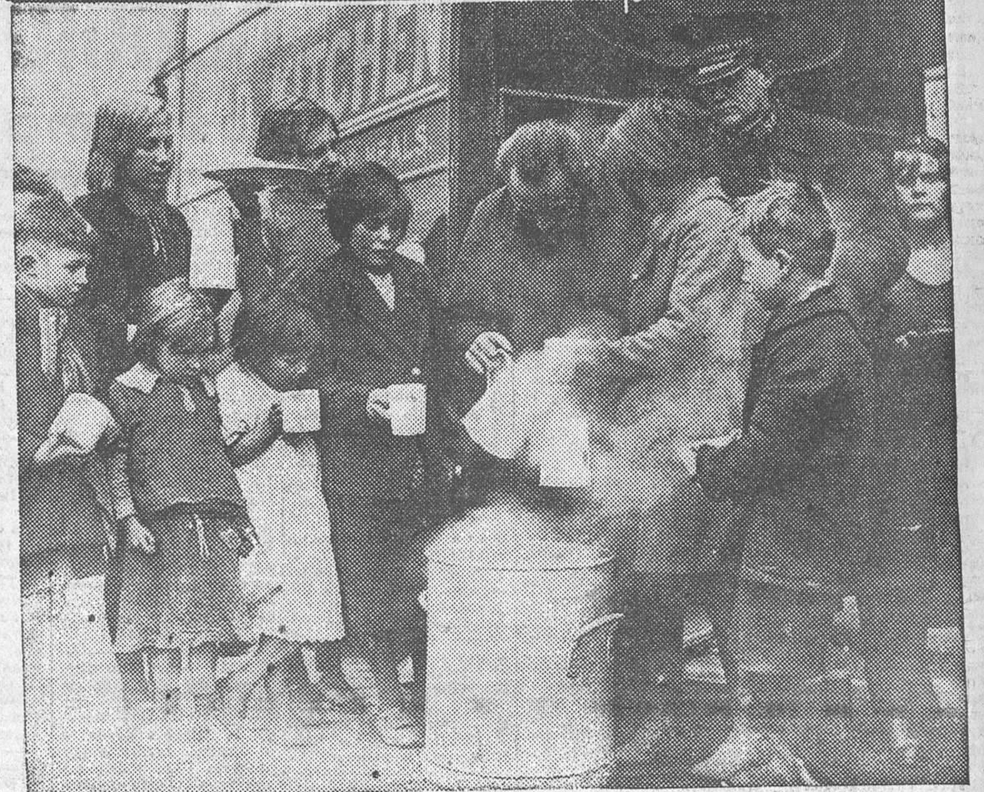
El día de Año Nuevo los pobres del distrito de Sheffels, uno de los más miserables de Londres, recibieron la agradable visita del Ejército de Salvación, que los obsequió con una magnífica comida