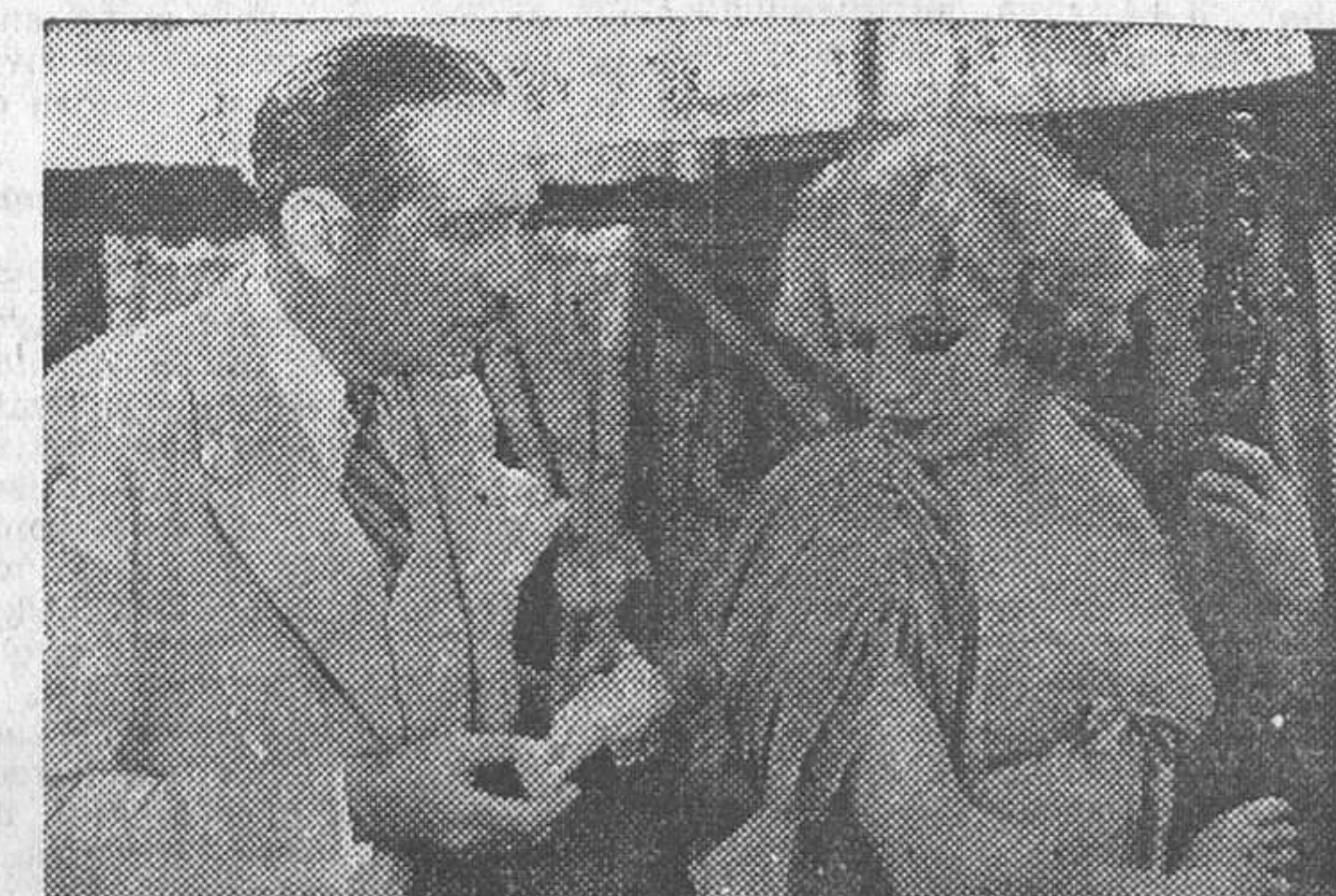
GRETA NISSEN Y ADOLFO MENJOU EN «LA FARANDULA TRAGICA», FILM COLUMBIA-CIFESA QUE EL LUNES SE ESTRENARA EN EL COLISEVM

Mujer: Un film que debes conocer Las ocho golondrinas EL LUNES PROXIMO EN Barceló