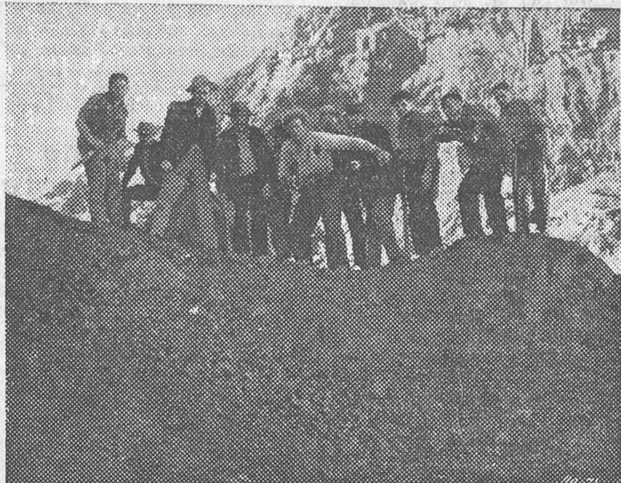
UNA ESCENA DE LA SUPERPRODUCCION S. I. C. E. «EL DILUVIO», QUE SE PROYEOTA EN EL CINE AVENIDA

UN JIRON DE ESPAÑA UN TROZO DE LEYENDA UN GRITO DE LA RAZA