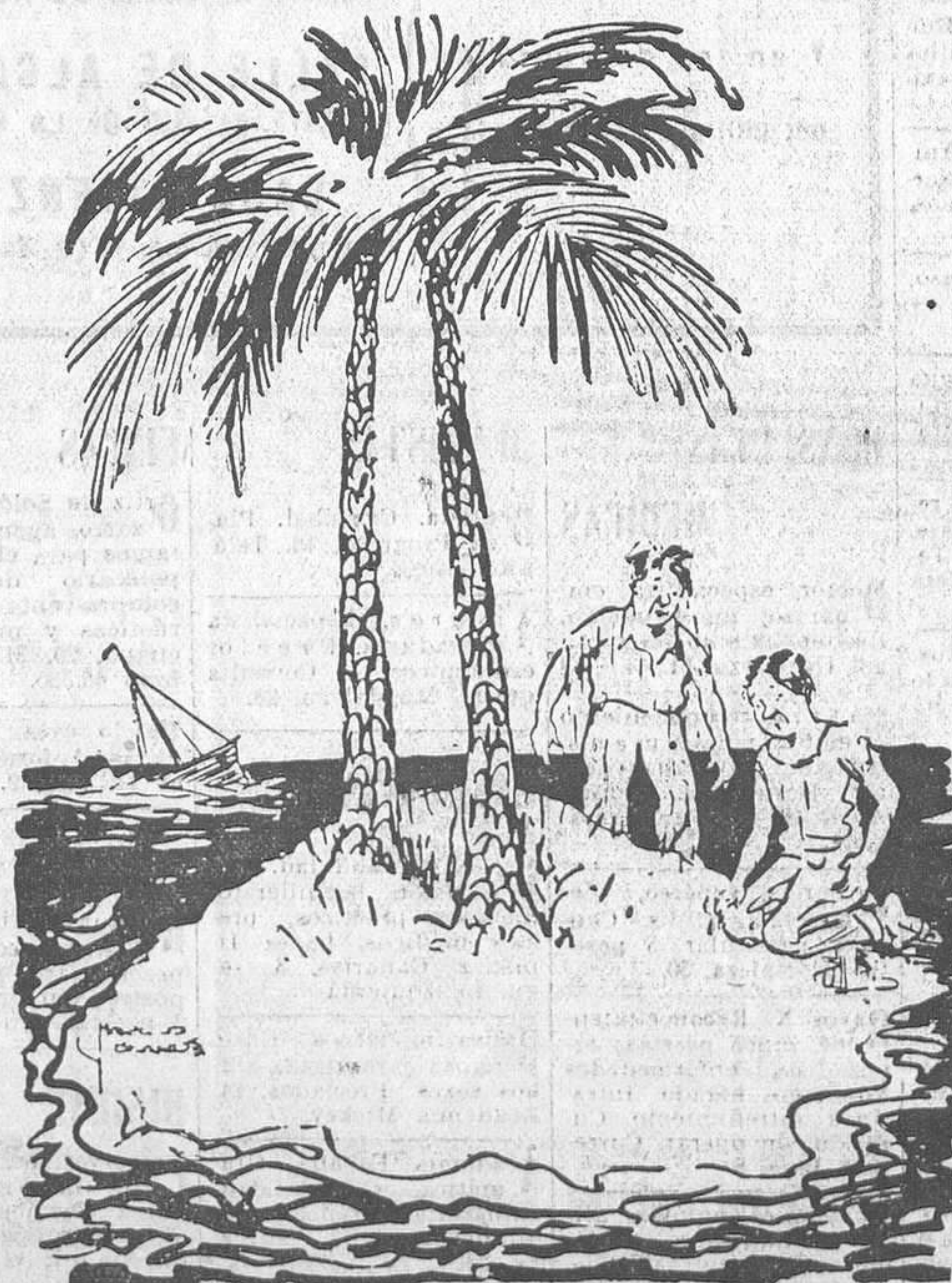
El naufrago optimista.—Lo primero que tenemos que hacer es explorar la isla cuidadosamente. («Ric et Rac».)