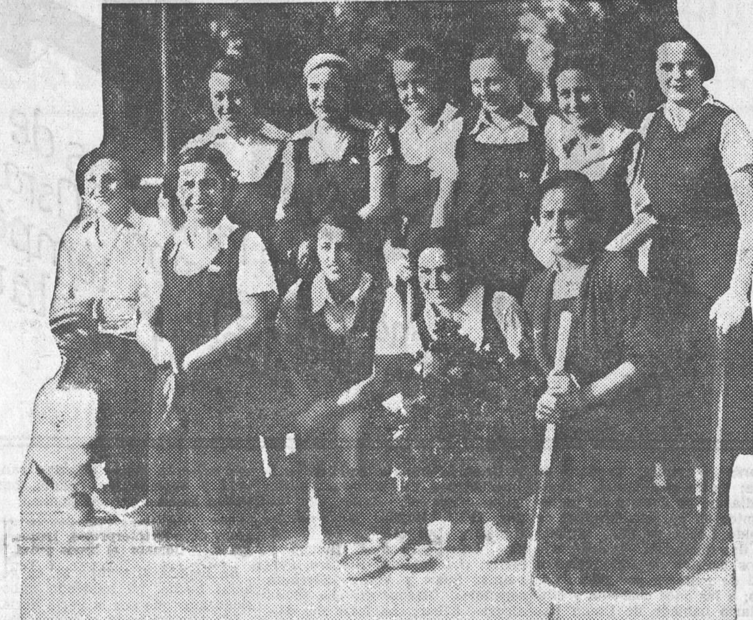
Las chicas del equipo de hockey del Club de Campo que han marchado a Vigo con el fin de jugar en aquella ciudad contra el Atlántida, a beneficio de las familias de las víctimas de la reciente catástrofe tranviaria