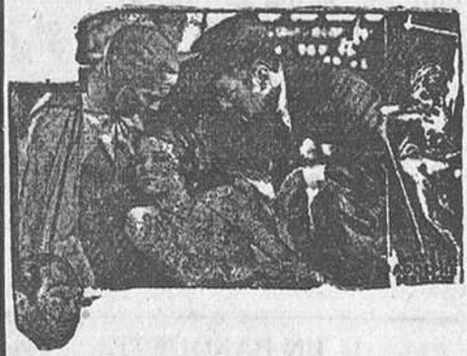
La farándula trágica