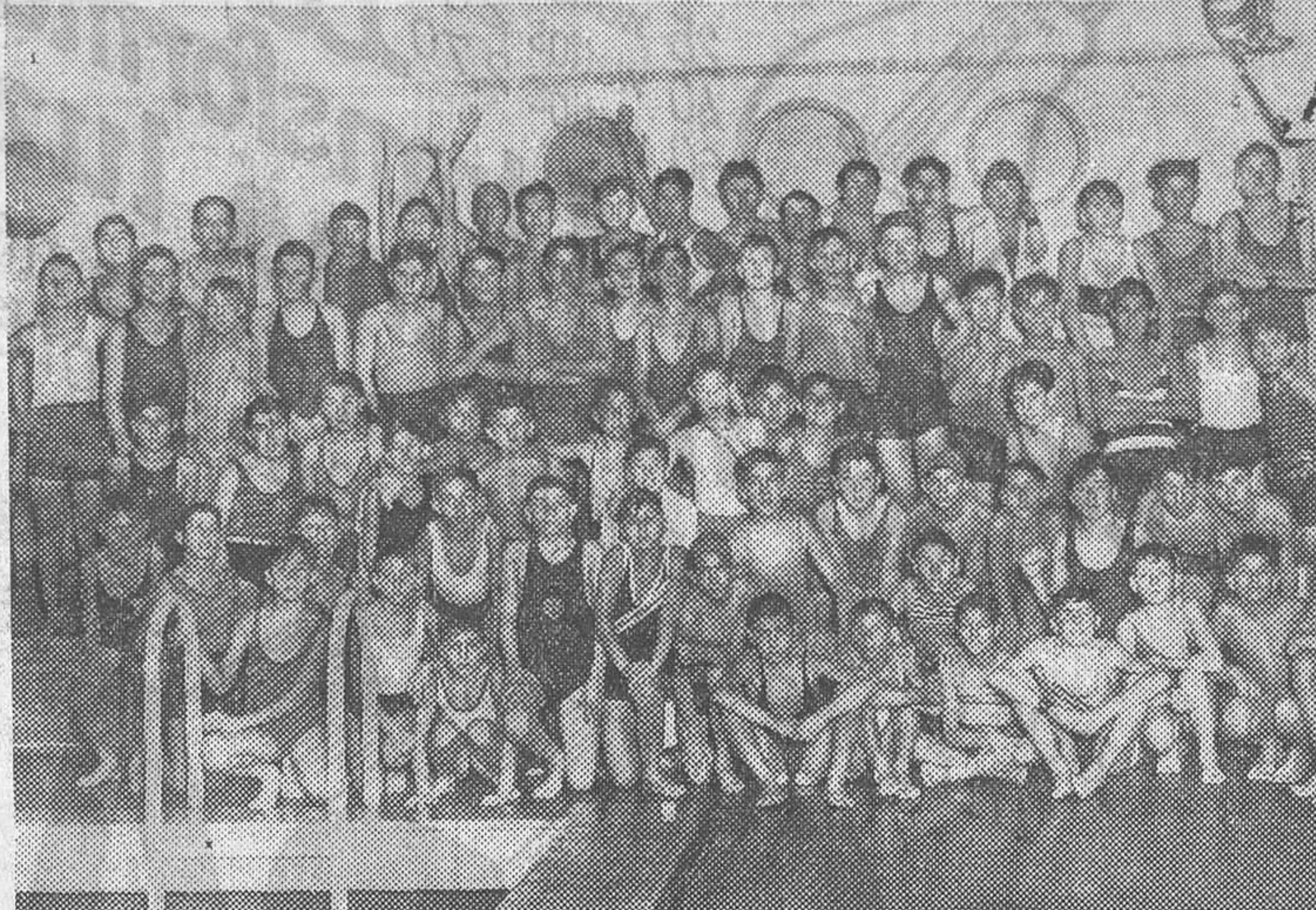
Niños que ayer tomaron parte en el concurso de natación para obtener la copa de Reyes, celebrado en el Canal Club