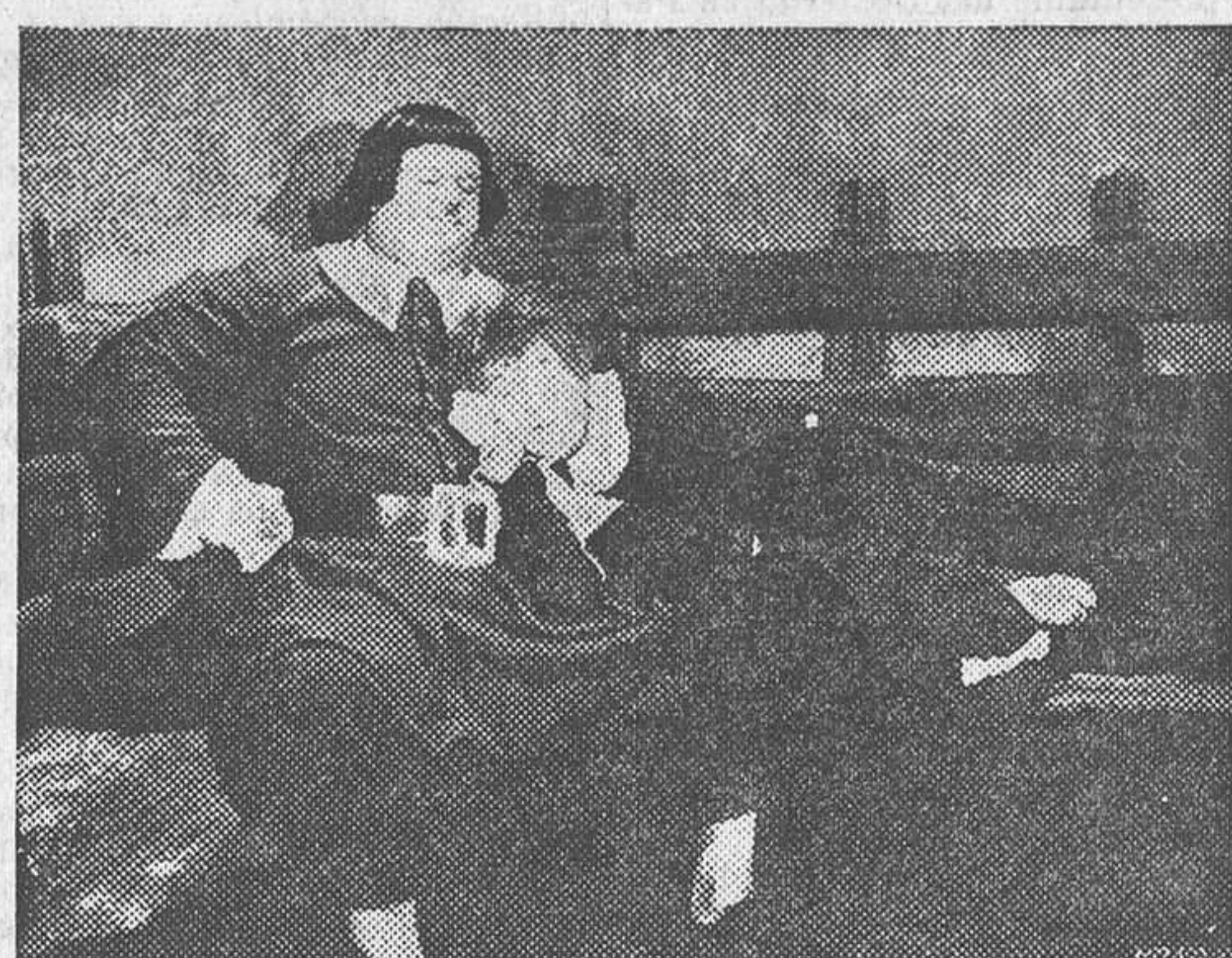
STAN LAUREL Y OLIVER HARDY EN «FRA DIAVOLO», FILM METRO QUE SE PROYEOTA EN EL PALACIO DE LA MUSICA

«Chofer con faldas» es una comedia sentimental que consigue hacer reír y emociona dulcemente. Es, además, una obra bastante espiritual, muy elegante y en la que Jeanne Boitel y Armand Bernard son los principales intérpretes. Este es el mejor elogio que puede hacerse del film...»—(«La Cinematographie Française», París.)