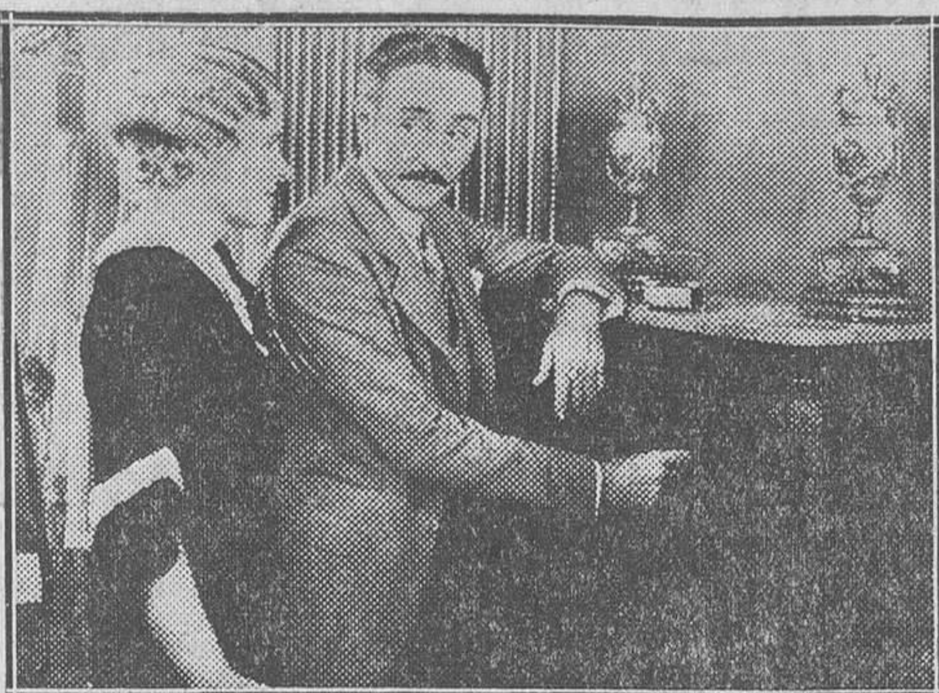
BARBARA STANWYK Y ADOLFO MENJOU EN «AMOR PROHIBIDO», FILM DE COLUMBIA PICTURES QUE EL LUNES SE ESTRENA EN EL CALLAO

Richard Dix, el simpático protagonista de «La escuadrilla deshecha», film R. K. O. Radio, presentado por la S. I. C. E. en España, contesta: —Yo hubiera sido, en vez de artista de cine... médico. ¡Cómo me gusta esta profesión! Sería un gran placer para mí curar con mis manos sabias todos los dolores... Médico, sí, señor; pero médico de niños o de señoritas solamente. Mary Astor.—Nunca pensé dedicarme a otra cosa. Desde pequeña me interesó el cine, que era entonces mi única obsesión... Y ya ve... La suerte supo llevarme por su camino... Dorothy Jordan.—Yo hubiera si-