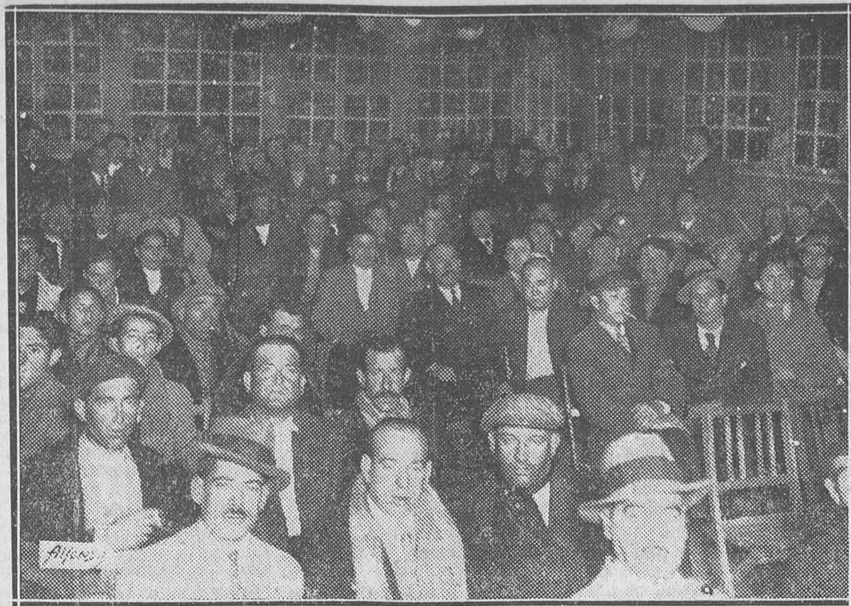
Asamblea de comerciantes, industriales, propietarios y vecinos de la barriada del Puente de las Ventas, en la que se acordó solicitar con verdadero empeño que se realicen las obras necesarias para que puedan celebrarse espectáculos en la nueva plaza de Vías, con lo que se incrementaría poderosamente la vida de ese extremo de Madrid.

Los comisionados manifestaron que el pueblo está disgustadísimo con este estado de cosas.