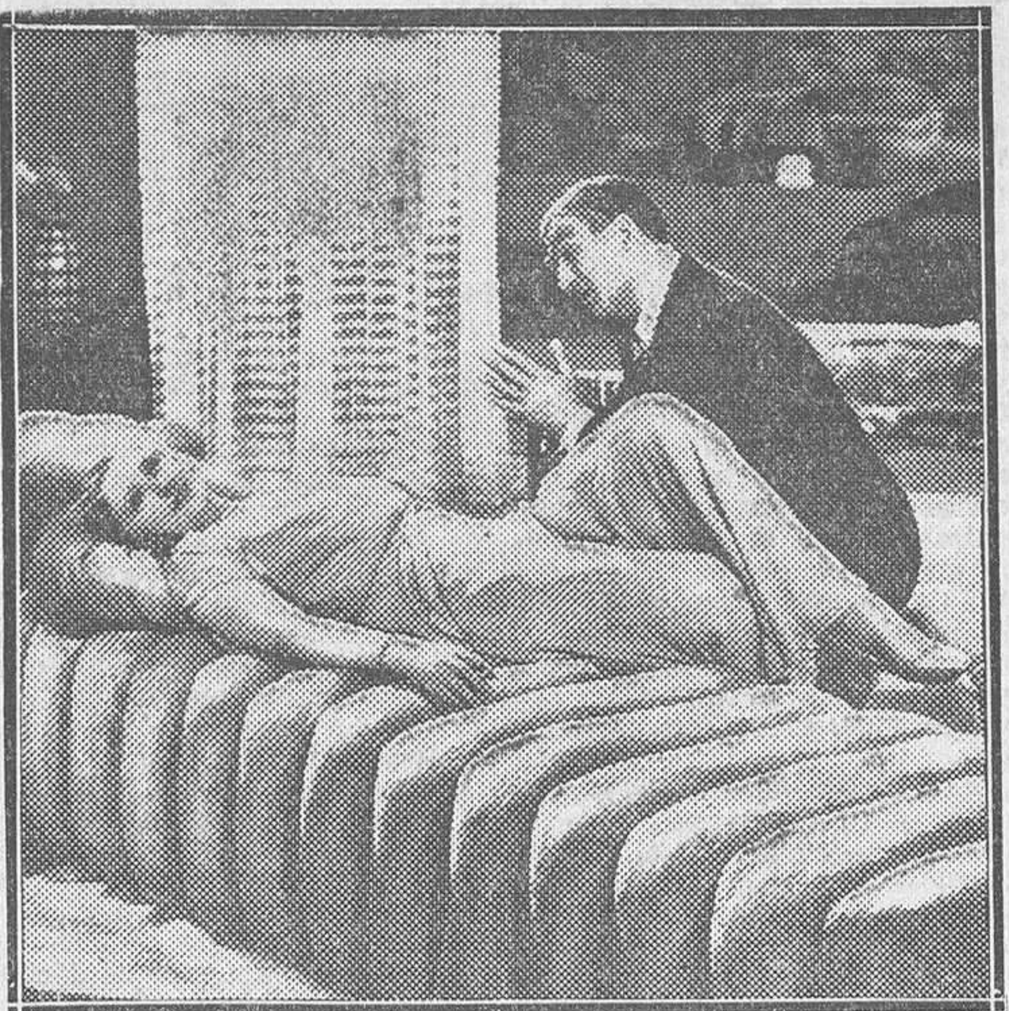
UNA ESCENA DE LA GRACIOSA Y DIVERTIDA COMEDIA «PATATRAC», QUE EL LUNES SE ESTRENARA EN EL CALLAO

La revolución rusa ha inspirado ya notables y numerosos films, y a lo visto comienzan a utilizarse ahora episodios de ella derivados para basar nuevas obras cinematográficas. La que se proyecta en la Prensa tiene una simpática novedad: la de estar desarrollada al margen de las connotaciones sociales y de las fratricidas luchas, para ofrecernos conflictos dramáticos personales enmarcados en la tragedia nacional. «Sus últimas horas» es una película de elevado tema, rica en matices psicológicos y de bellezas técnicas. El público la ve con emoción y agrado y la elogia sin reservas. «El más audaz» y «Pistoleros de agua dulce», en el Astoria Dos excelentes cintas figuran en el programa del Astoria. «El más audaz» es un film policíaco, basado en una suplantación de personalidad, que tiene un interés creciente y una interpretación irrepachable. «Pistoleros de agua dulce» es una nueva producción de los hermanos Marx, clowns que se hicieron famosos en el cine con su intervención en un solo film. Su extraordinaria comicidad, sus originales trucos, hilvanados