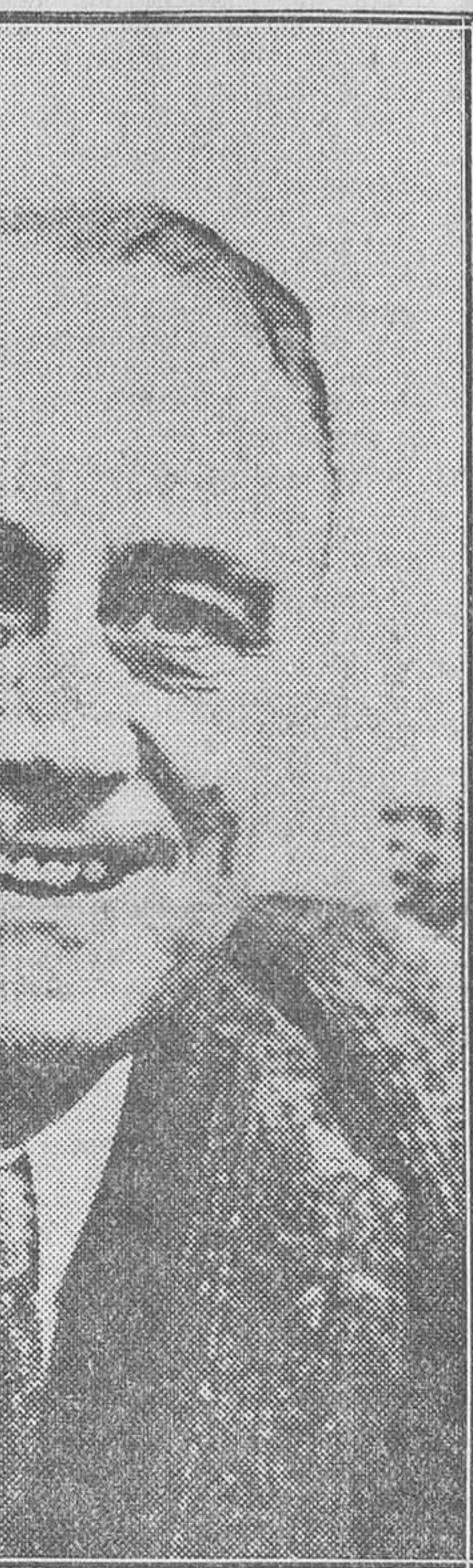
Franklin Roosevelt, nuevo presidente de los Estados Unidos de Norteamérica

Al lugar del suceso acudió gente de todos los poblados cercanos, que colaboran con la Policía en las pesquisas para encontrar a los autores,