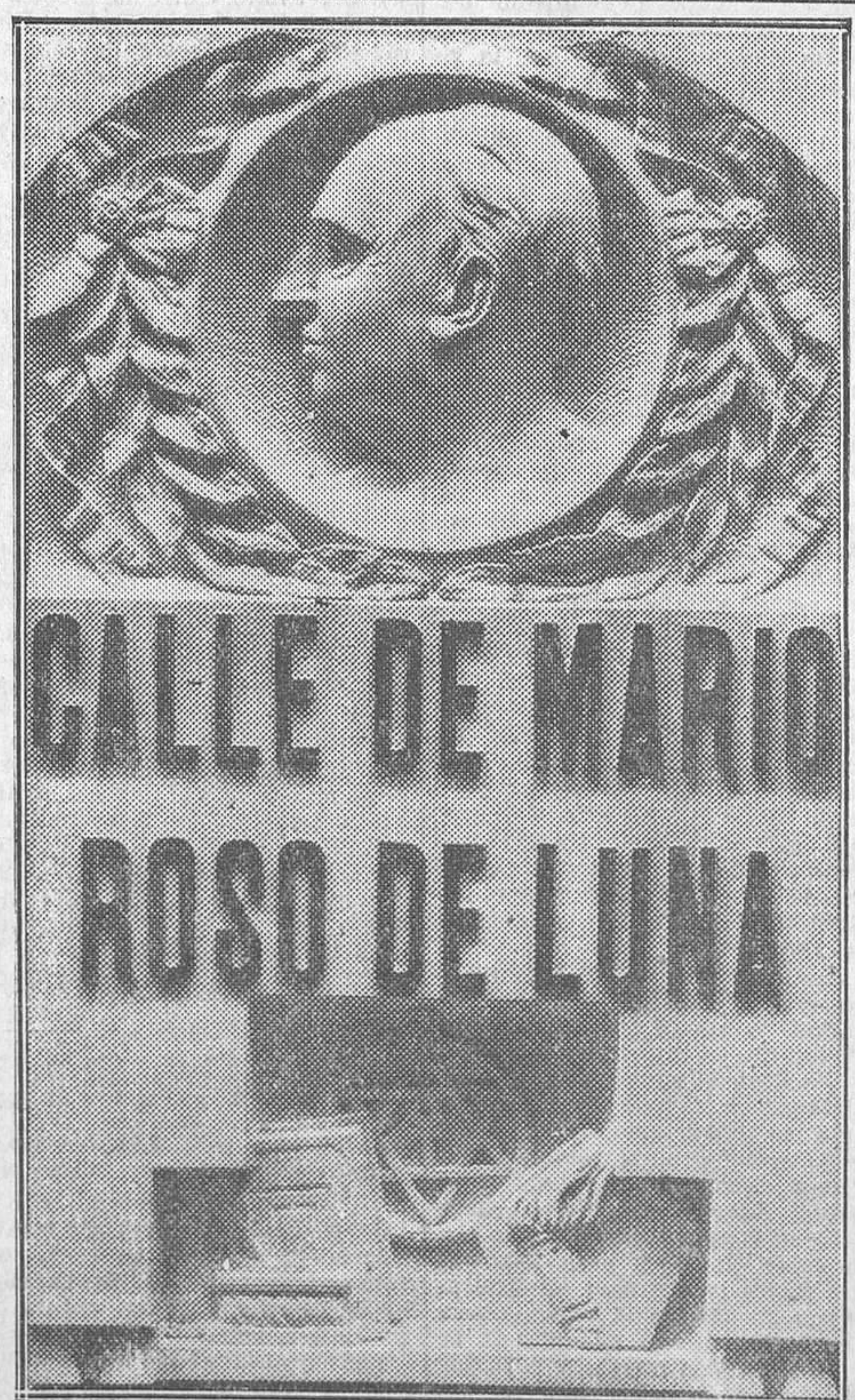
Placa en piedra que será descubierta hoy y que da el nombre del ilustre Roso de Luna a la antigua calle del Buen Suceso, obra del notable escultor Florentino del Pilar

Las Secciones agronómicas provinciales, a instancia de parte, podrán girar visitas de inspección a las fincas de propiedad particular, y si de ellas resultase que alguna es susceptible de incrementar su producción anual en más de un 50 por 100 se concederá al dueño un plazo de un año para que indique los trabajos con-