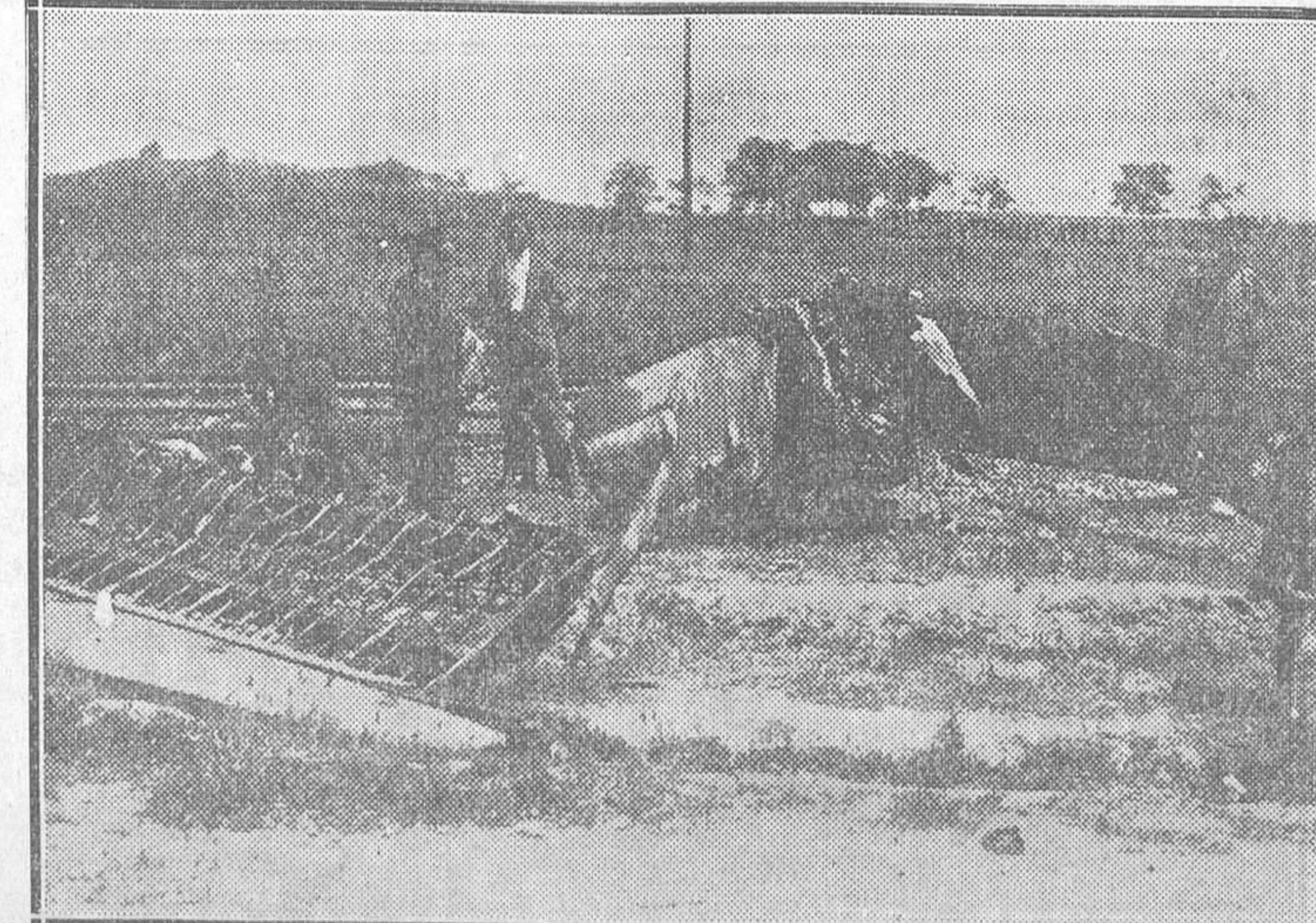
EN GETAFE.—Restos del avión le zaza de los que fué extraído el cadáver carbonizado del piloto Paulino Vecilla. El aparato fué a estrellarse junto a la vía del tren.