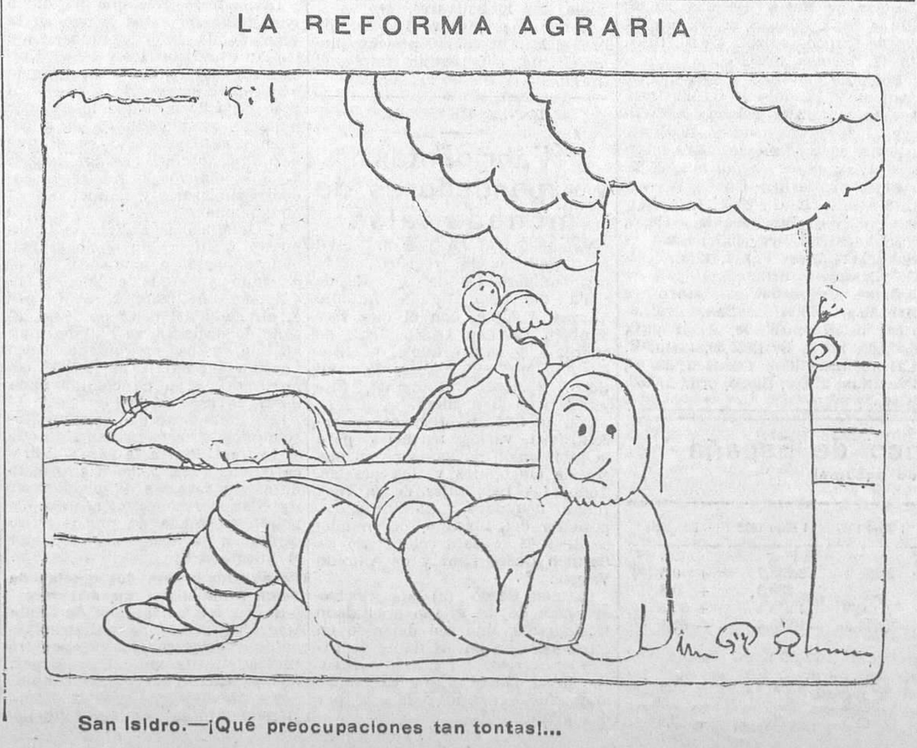
San Isidro.—¡Qué preocupaciones tan tontas!...

Suecia constituye el «patrimonio familiar» por su ley de 28 de Junio 1907, siendo admirablemente secundado el Gobierno por los obreros y clase media, al punto de que las Asociaciones para «el patrimonio familiar» sumaban en