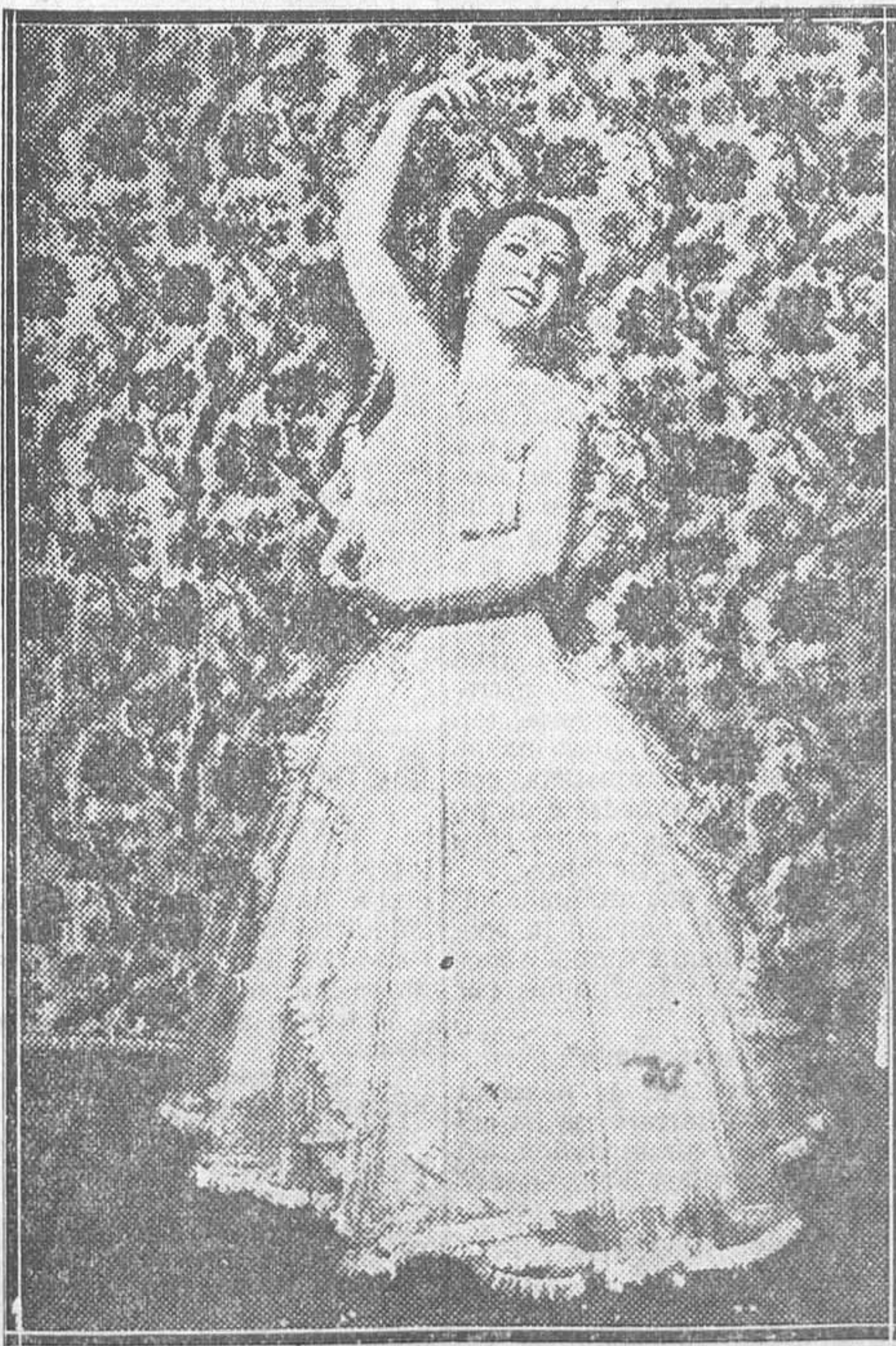
La Argentina, que ayer se despidió en el Español del público madrileño, La Argentina realizará una larga excursión artística por el extranjero

nita, quiso despedirse ayer del público madrileño antes de lanzarse a una excursión por el resto de Europa. Como el éxito de su nuevo repertorio había sido grande en pruebas anteriores, imaginó ella seguramente que podía llevarse el recuerdo de una calurosa despedida. Y así fue.