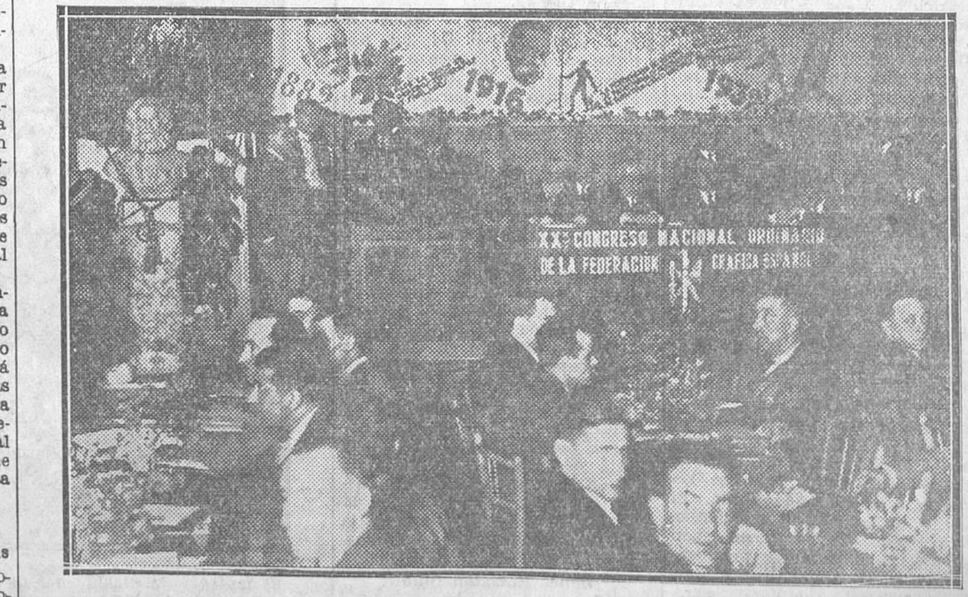
Apertura del XX Congreso Nacional de la Federación Gráfica Española, celebrada anoche en la Casa del Pueblo