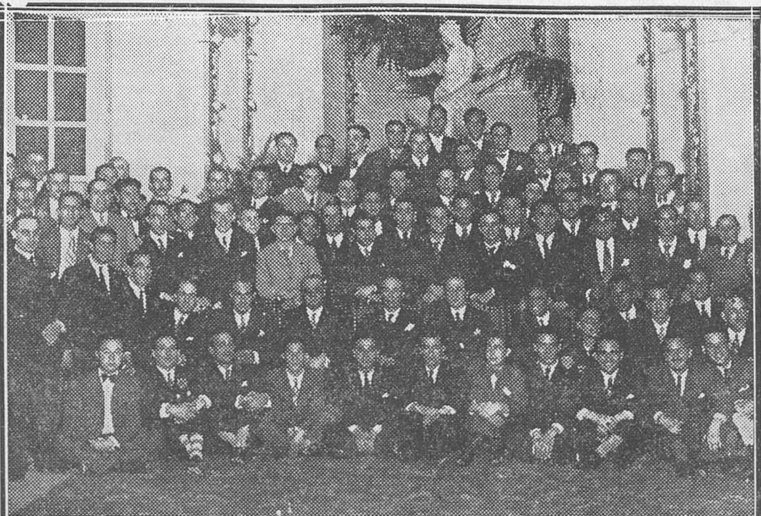
Profesores y alumnos de la Escuela de Odontología de la Facultad, reunidos para festejar el final de curso

Todos éstos, y sus respectivas mujeres, han sido detenidos por la Guardia civil.