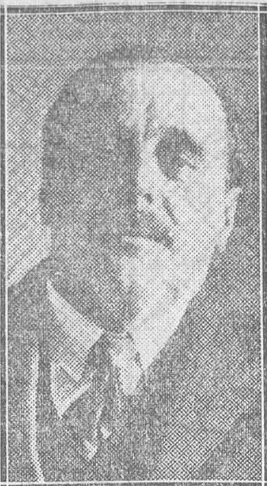
El ilustre novelista inglés Herbert George Wells, universalmente admirado, que es nuestro huésped y que mañana dará una conferencia en el teatro Español

Consulta económica de venéreo, sífilis, tuberculosis, corazón, análisis, rayos X, corrientes. Horas: de 12 a 2, de 3 a 5 y de 7 a 9. Los viernes, gratis. CORREDERA BAJA, 27 (frente a Pueblo)