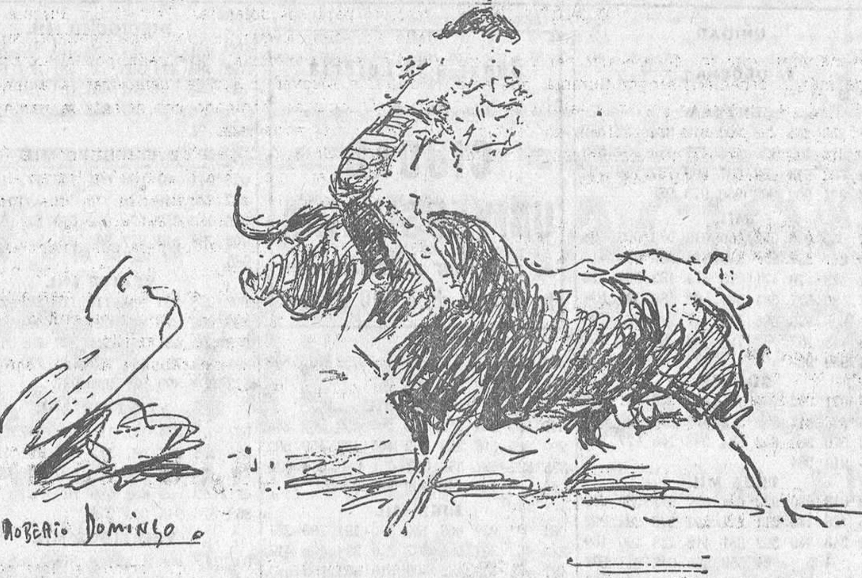
EL DOMINGO, EN MADRID.—Rayito toreando magníficamente al segundo toro.—Cogida de Rayito al dar uno de los admirables lances de capa

otra envainada en los músculos abductores del muslo. Pronóstico grave.