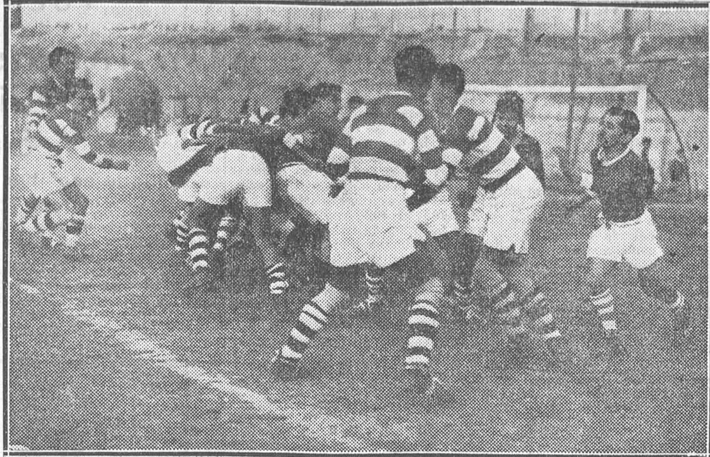
RUGBY UNIVERSITARIO. —Una interesante jugada entre los equipos de Arquitectura y Medicina, partido en que venció el primero por 29 a 5

Los concursantes deberán presentarse a las doce de la mañana del citado domingo al Jurado,