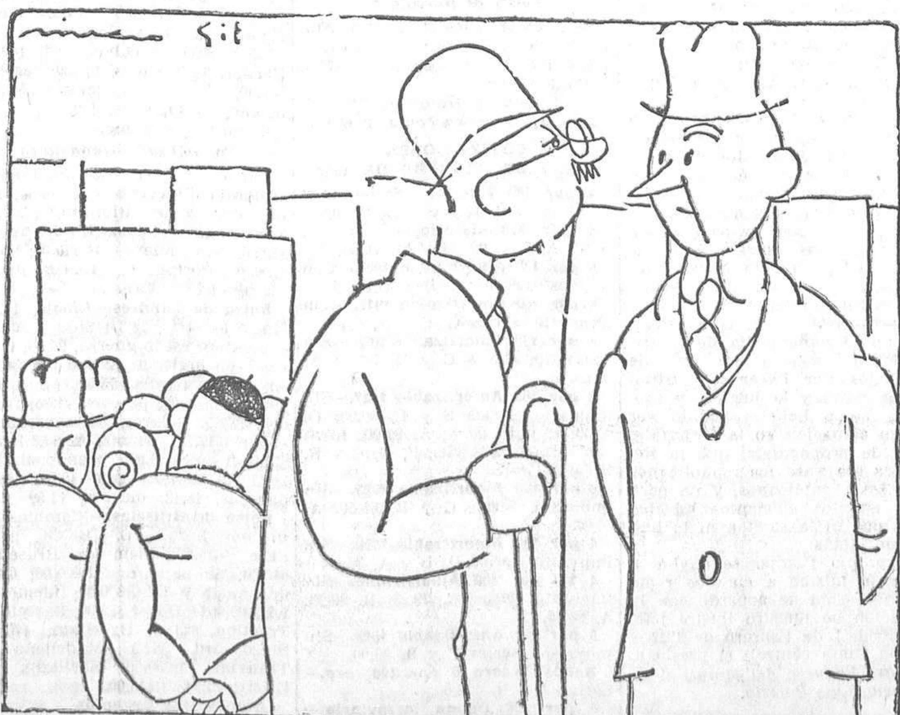
—Es un bando sobre el Carnaval. —¡Ah! Creí que se refería a la mendicidad...

Londres, 3.—El Sr. Mac Donald ha sufrido, con éxito, la operación de glaucoma.