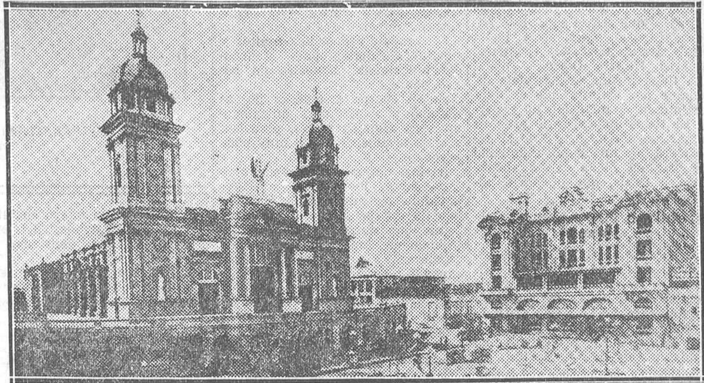
EL TERREMOTO DE SANTIAGO DE CUBA.—Vista de la Catedral, que ha sufrido grandes destrozos, y del hotel Venus

instalado hospitales provisionales para asistir a los heridos. La catedral ha sufrido daños de importancia. Grandes bloques de piedra de la fachada cayeron a la calle, donde causaron muchas víctimas entre los huéspedes de los hoteles de los alrededores que, lle-