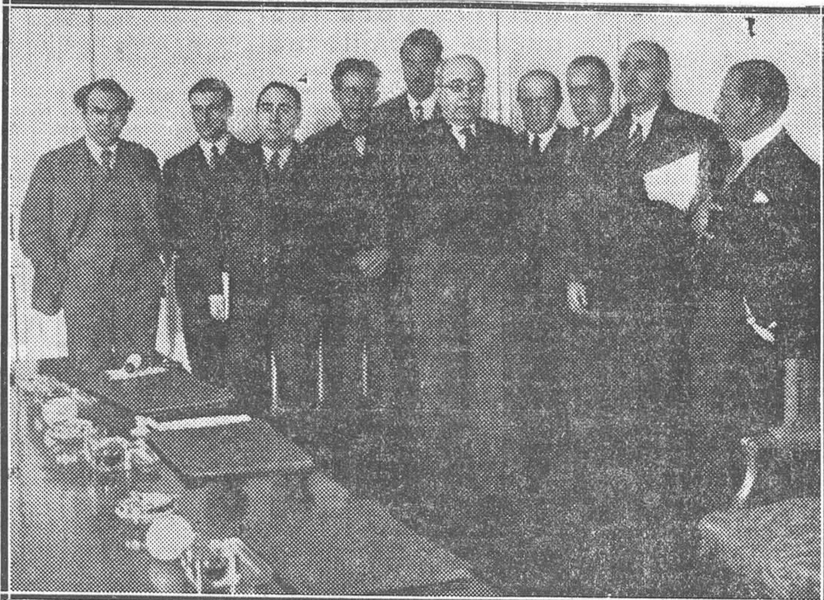
El jefe del Gobierno con el Patronato de incautación de los bienes a los jesuitas, reunidos ayer en la Presidencia

Un manifiesto del nuevo grupo de Alianza de Izquierda Republicana