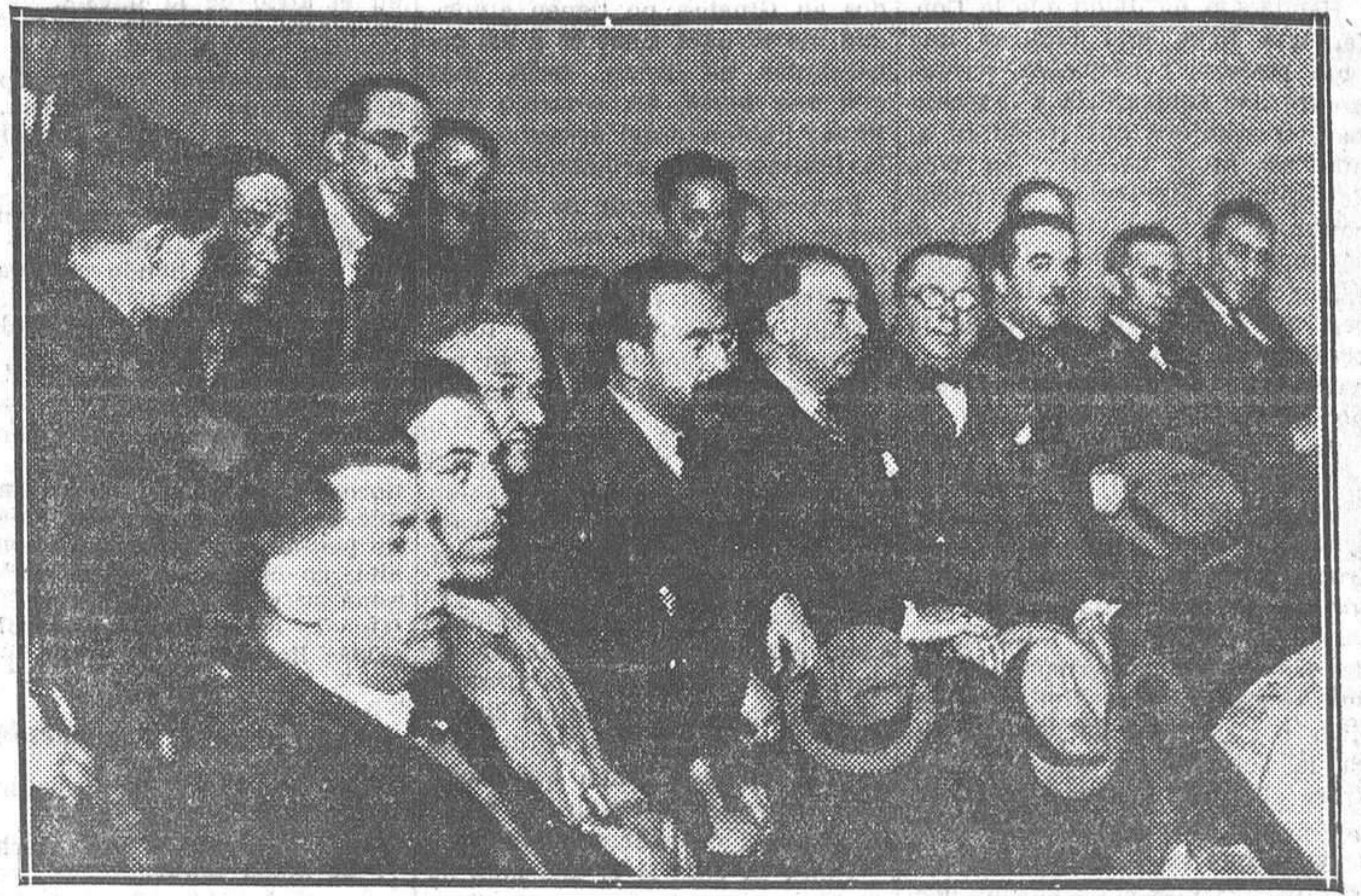
El ministro de Instrucción pública, D. Fernando de los Ríos, acompañado del cónsul de la Argentina, de los diputados por la provincia de Madrid y de las autoridades locales de Chamartín de la Rosa, en el brillante acto hispanoargentino organizado por el partido radical socialista del vecino pueblo y celebrado ayer con extraordinario entusiasmo.

El acto fue un éxito de organización para el partido radical socialista de la localidad, que, siguiendo su norma de conducta, pone especial interés en hacer una intensa y fructífera labor cultural que repercuta en el espíritu del pueblo.