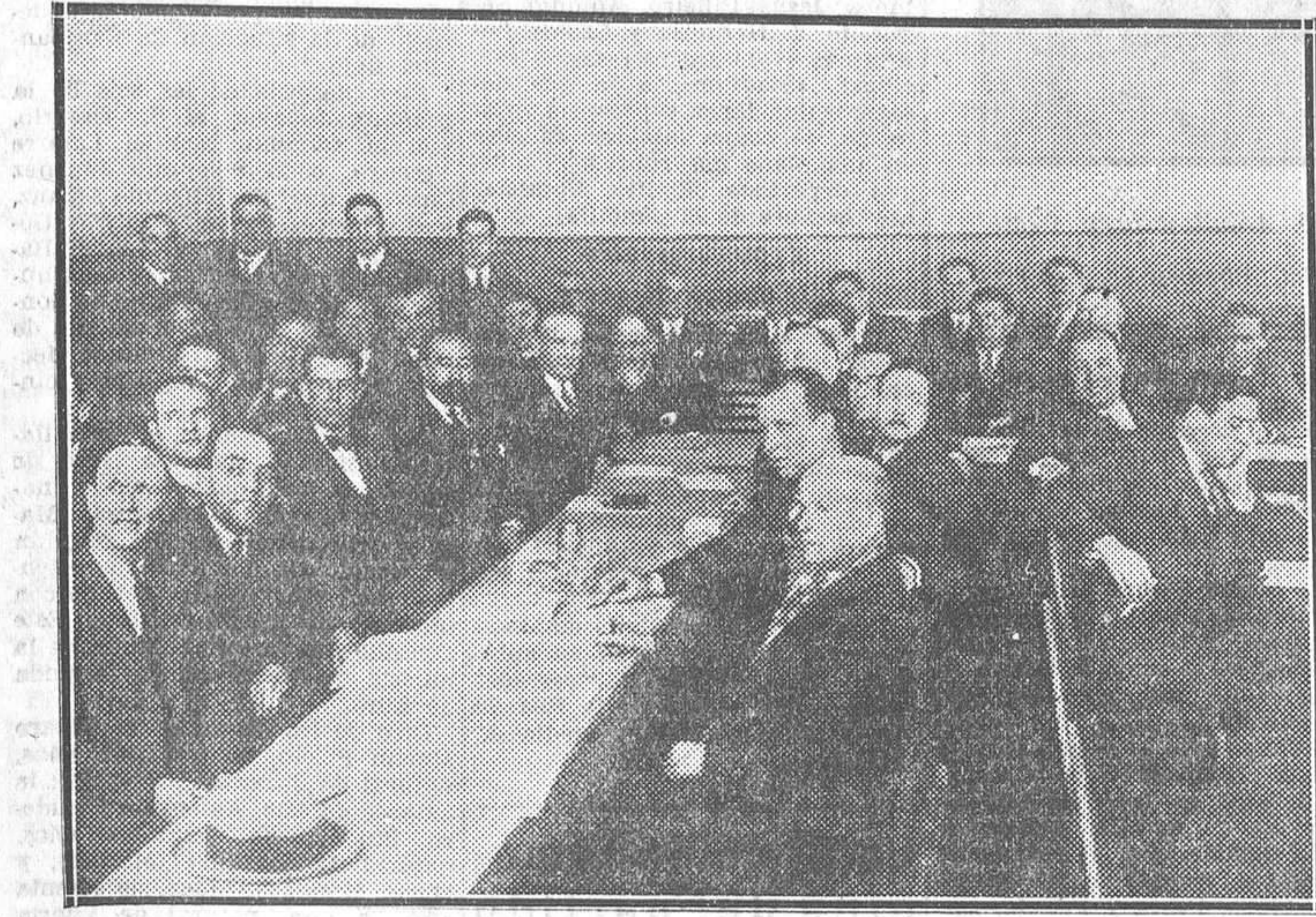
El Comité nacional de la U. G. T. y la Comisión ejecutiva del Sindicato ferroviario, reunidos ayer en la Casa del Pueblo, con asistencia de los tres ministros socialistas

Los representantes en las Cortes Constituyentes de las cuatro provincias de Galicia se complacen en rendir a tan meritoria empresa educadora un colectivo aplauso, cordial y caluroso, y suman sus gestiones a las que sin cesar vienen haciendo las autoridades provinciales de Galicia para suplicar rendidamente a todas las Corporaciones públicas gallegas, Sociedades de todo orden, a los conterráneos que habitan en Galicia, lo mismo que a los que residen en el resto de España o allende los mares, que muestren una vez más su entusiasmo por el progreso y mejora de nuestra tierra, prestando decidido y constante apoyo a esta admirable iniciativa de la Universidad santiaguesa, augusto faro venerable que irradian luces de civilización sobre los dilatados horizontes de nuestra comarca, con tanto ardor amado por sus hijos.»