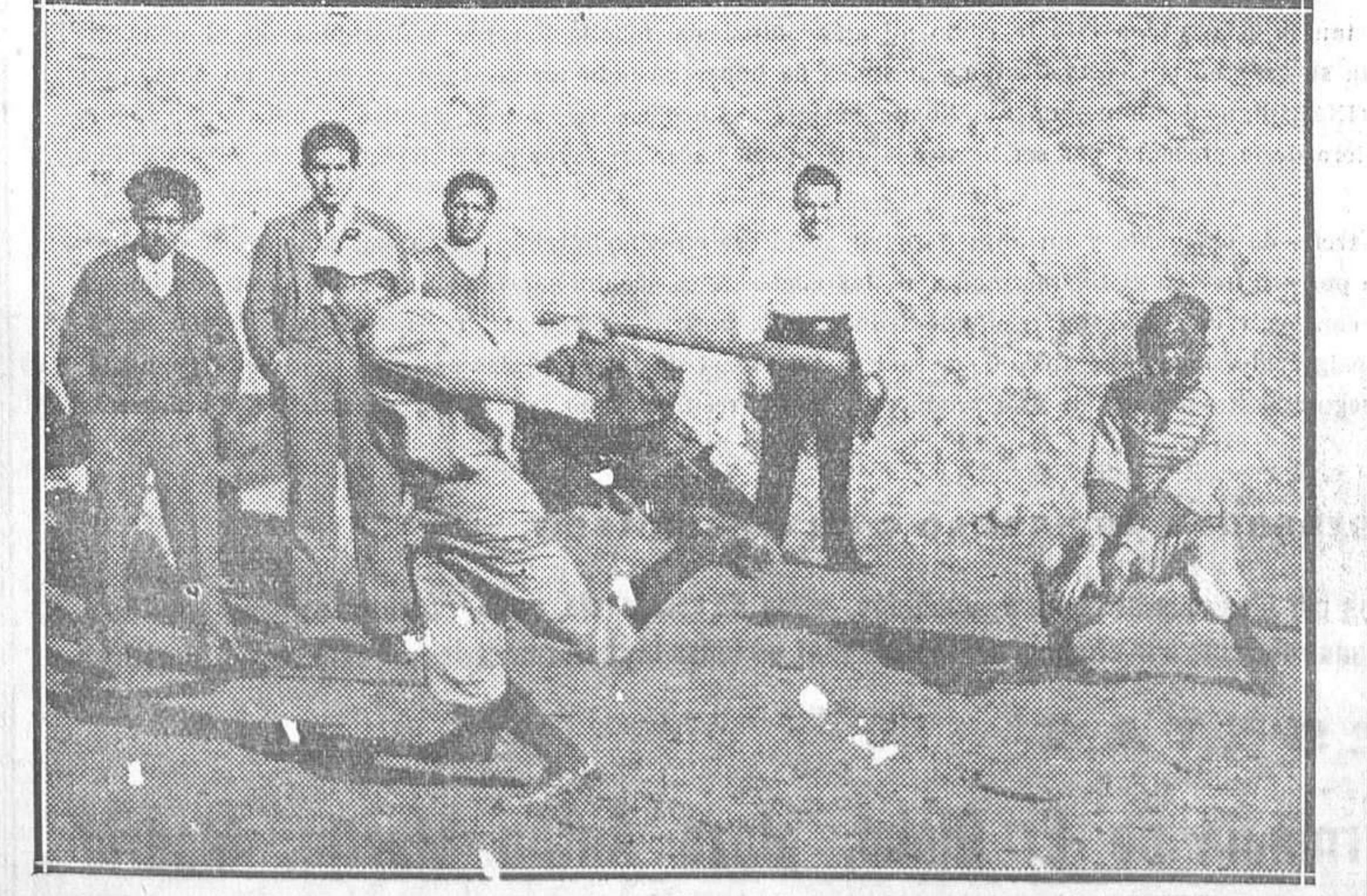
BASSE-BALL.—Un detalle del partido jugado el domingo en Madrid entre los equipos Pirata e Hispanoamericano