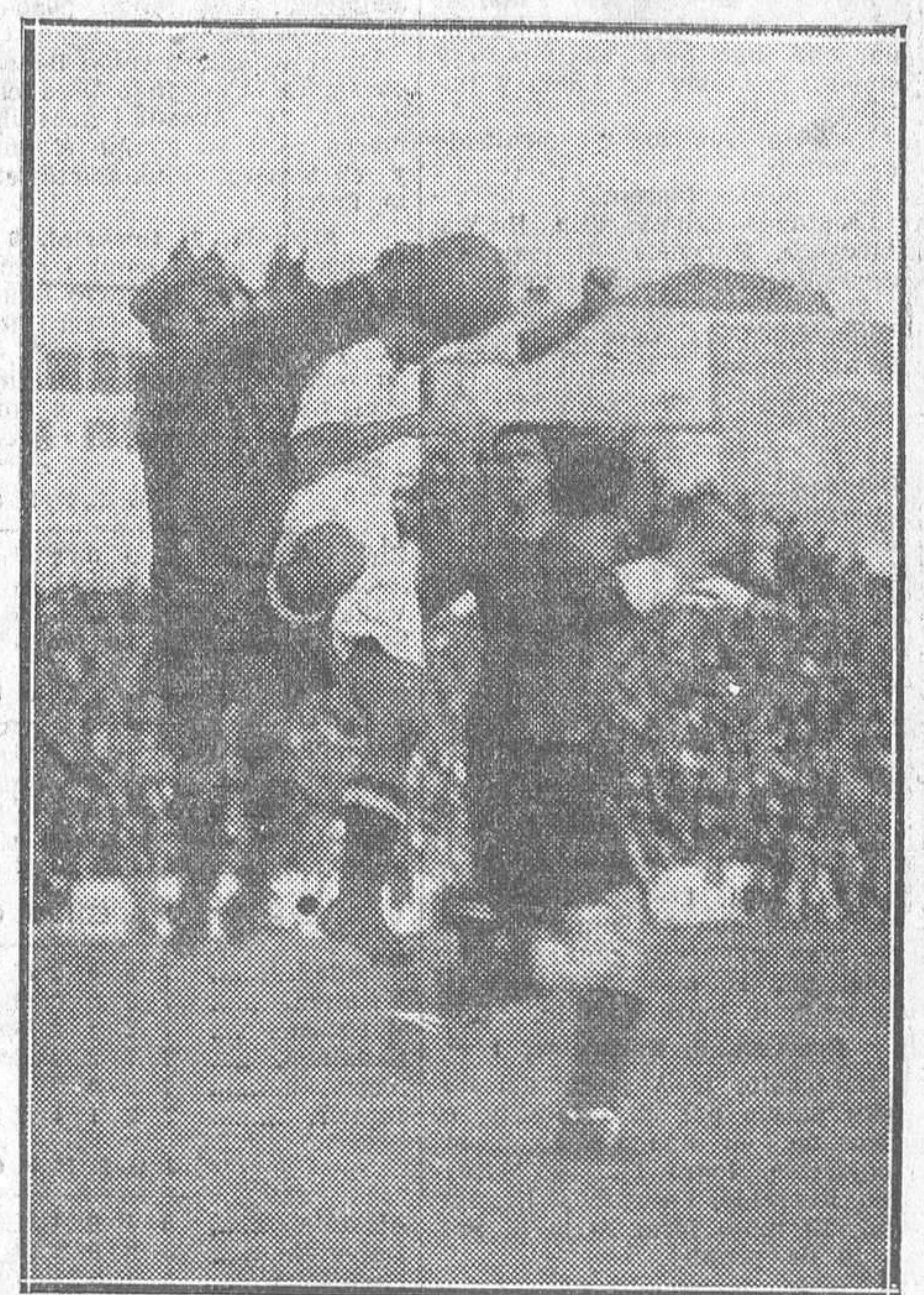
EN EL CAMPO DE CHAMARTIN.—El portero del Barcelona rechazando un balón ante la briosa acometida de los delanteros del Madrid