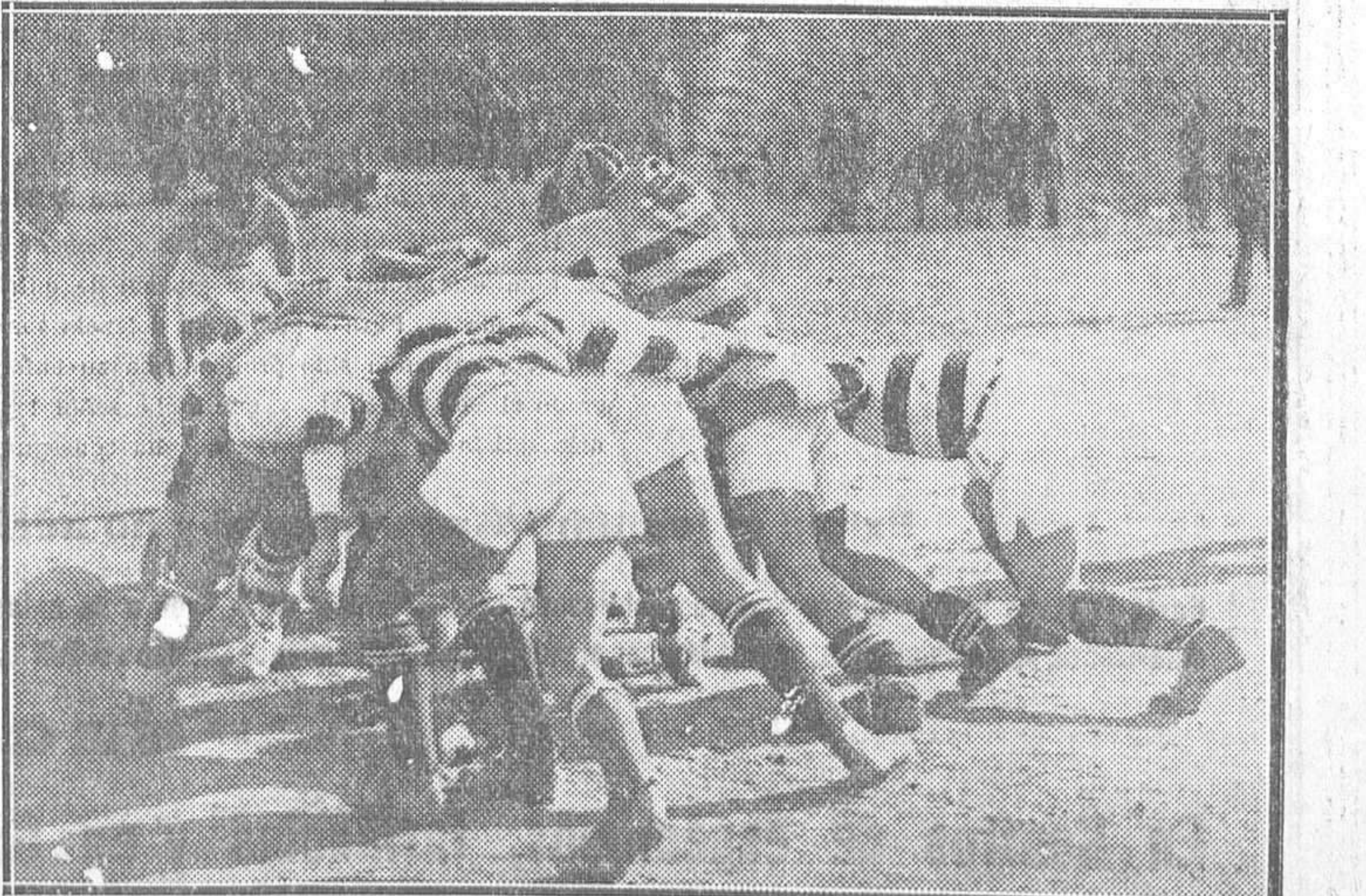
RUGBY.—Los equipos de Ingenieros Industriales y la Gimnástica, que jugaron el domingo un partido