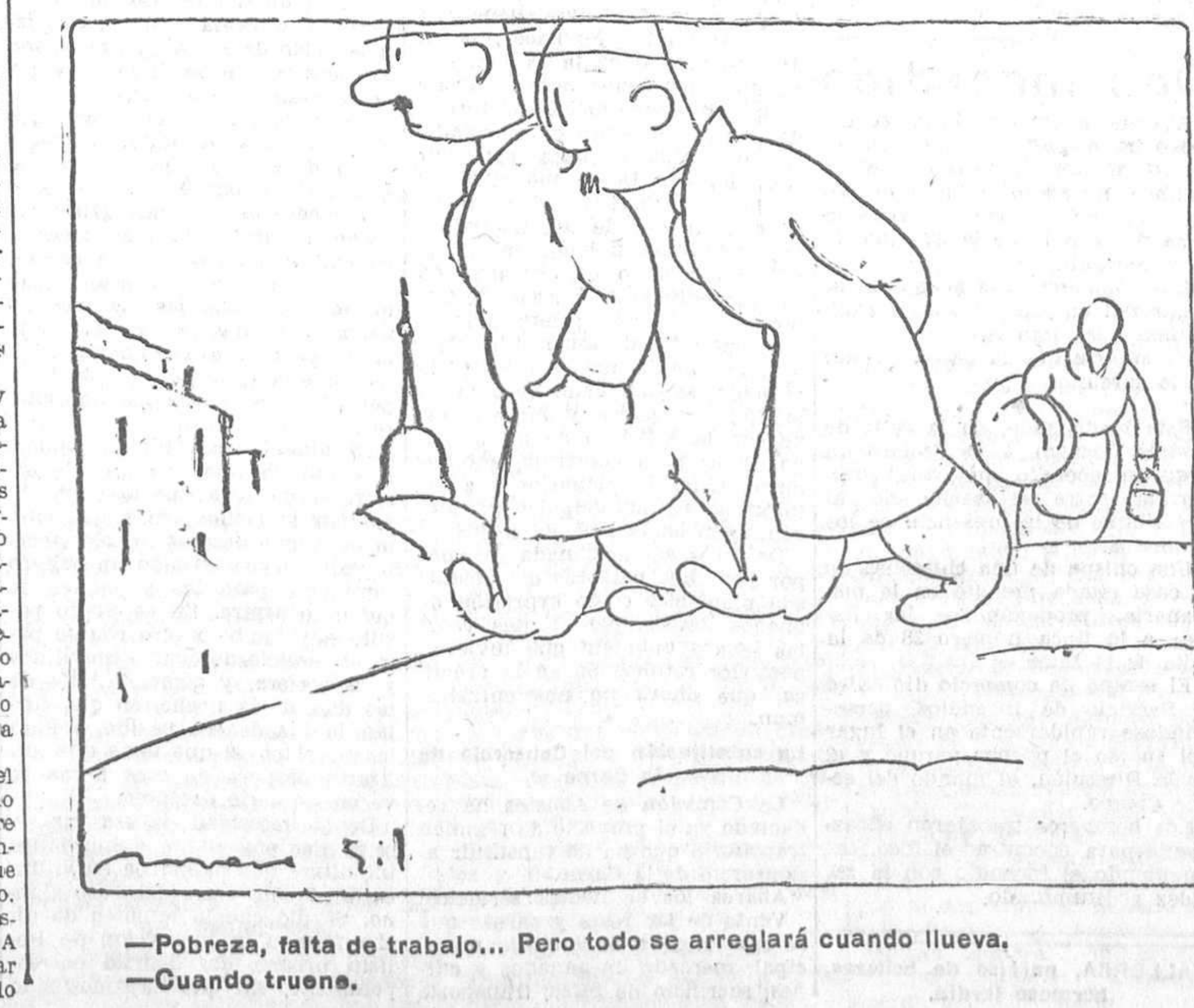
—Pobreza, falta de trabajo... Pero todo se arreglará cuando llueva. —Cuando truene.

El presupuesto egipcio Reducción del diez por ciento Londres, 25.—Telegráficamente desde El Cairo al periódico «Daily Telegraph» diciendo que Sidky bajó ha declarado a los periodistas que el Gobierno egipcio está dispuesto a introducir en los presupuestos una reducción del 10 por 100. Para ello se ha invitado a todos los ministros a restringir los gastos de sus departamentos respectivos, dentro de los límites fijados por el Gobierno. Todos los programas de grandes obras públicas han quedado aplazados, y las ya comenzadas seguirán a marcha reducida.