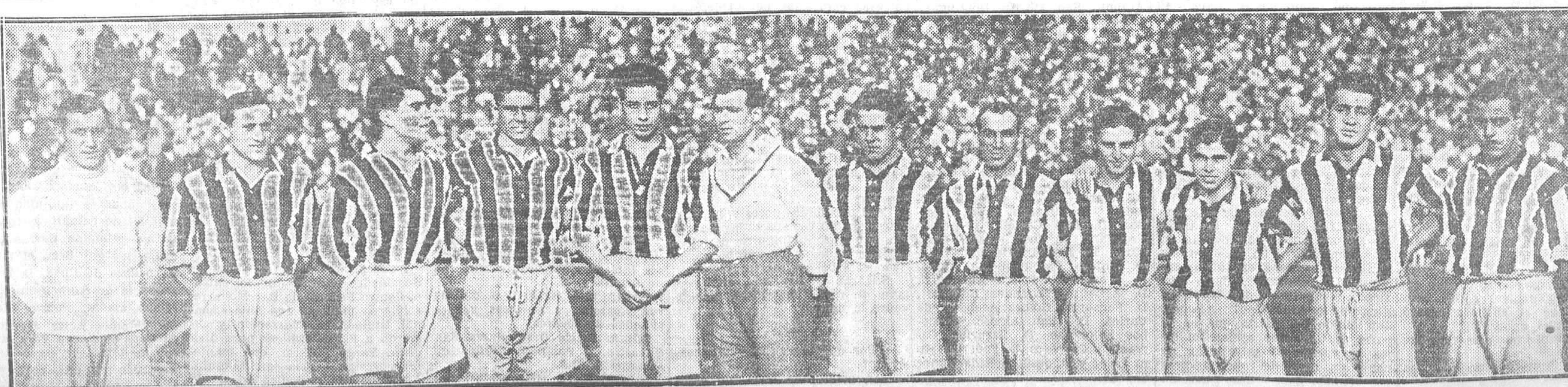
Equipo del Athletic Club, que por haber sido vencido por el Madrid F. C. se clasificó en el segundo puesto del campeonato regional