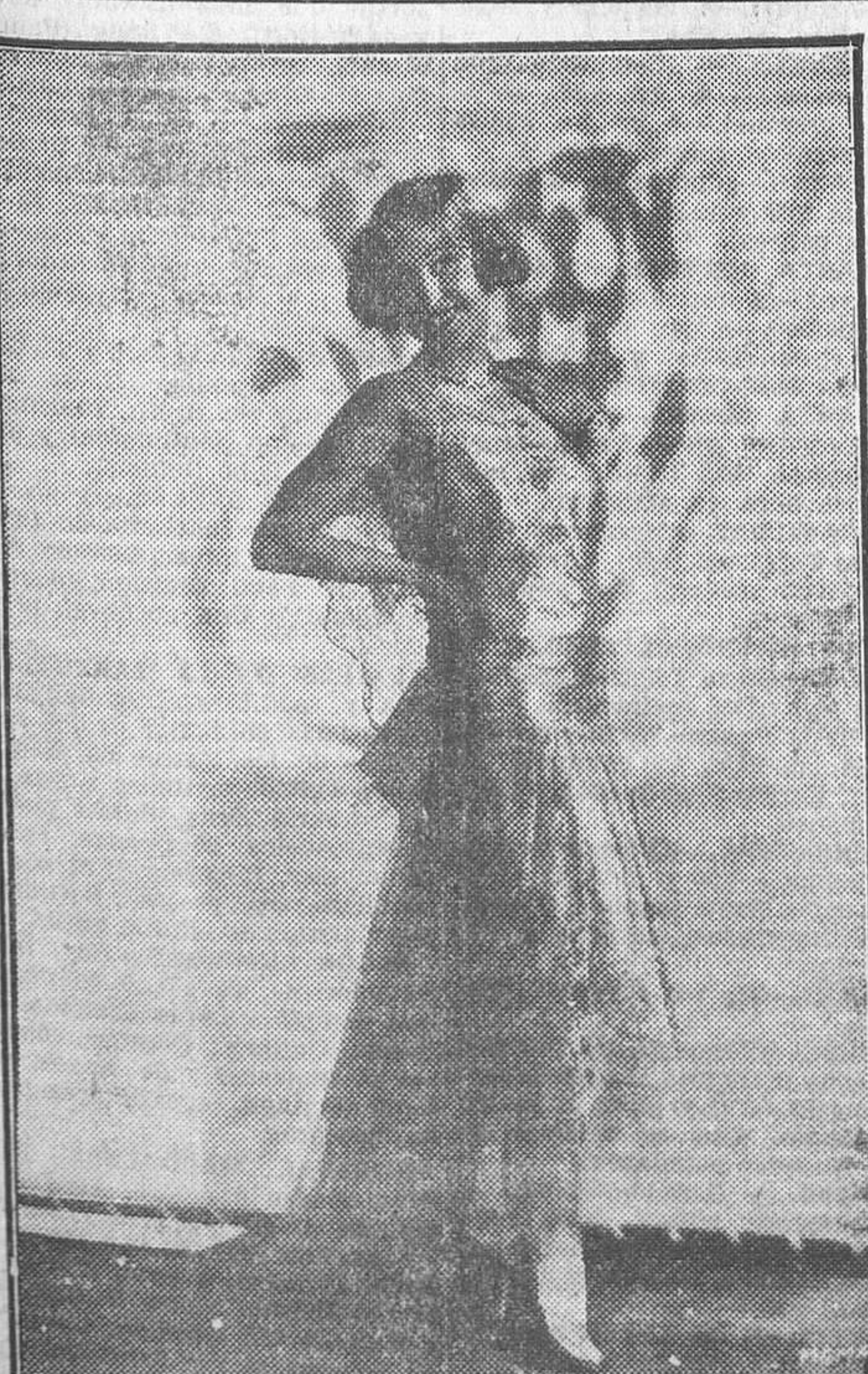
BESSIE LOVE, PROTAGONISTA DE «BROADWAY MELODY», PELICULA DE CRECIENTE EXITO

Se estrenará el lunes próximo en Cine Madrid y Cine San Carlos