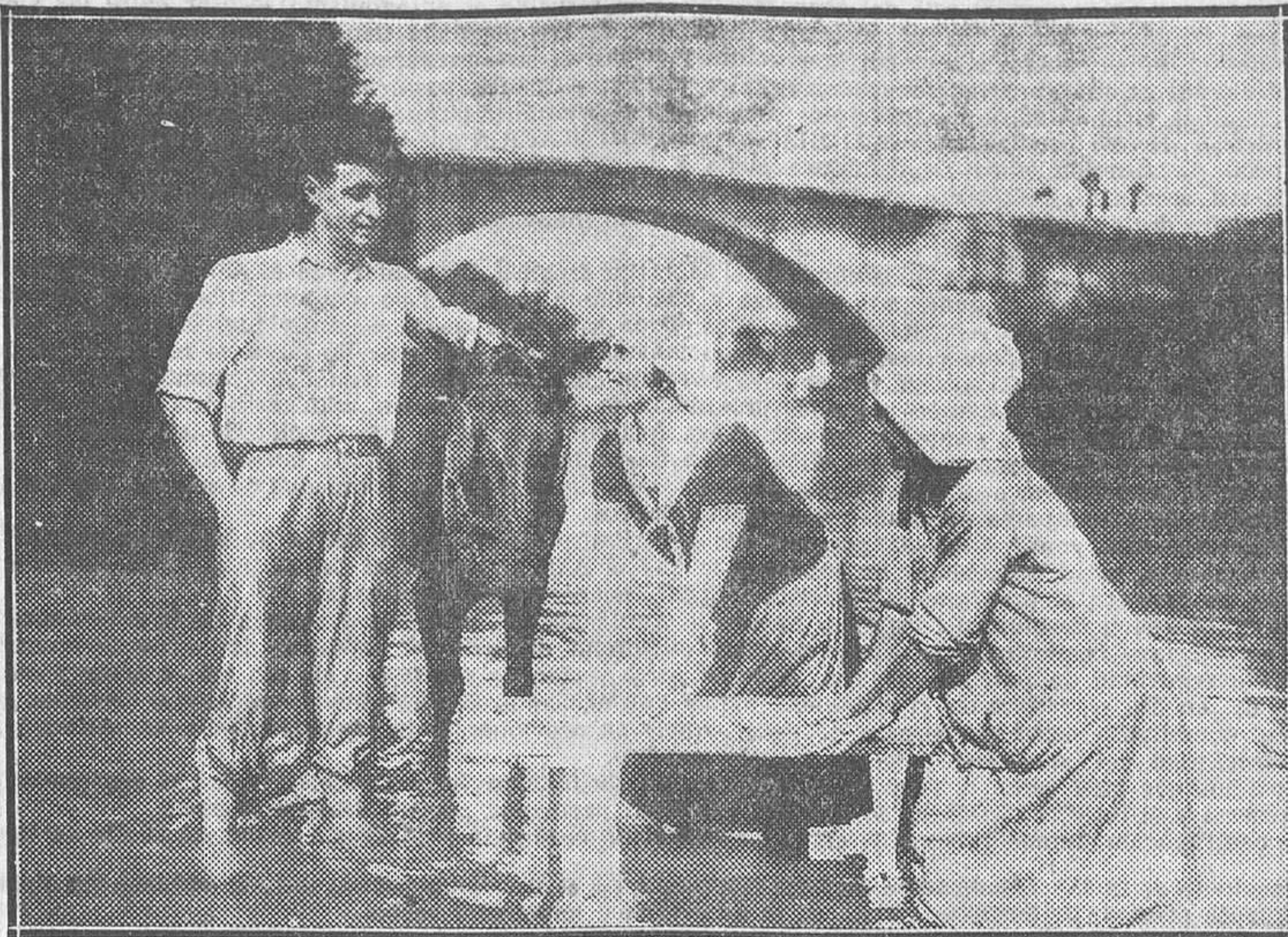
UNA ESCENA DE LA PELICULA ESPAÑOLA «FATAL DOMINIO», QUE EL LUNES SE ESTRENA EN LOS CINES MADRID Y SAN CARLOS

tán sincronizando «El puente de San Luis Rey» y «La isla misteriosa», y en ambas versiones sólo se sincronizará una escena.