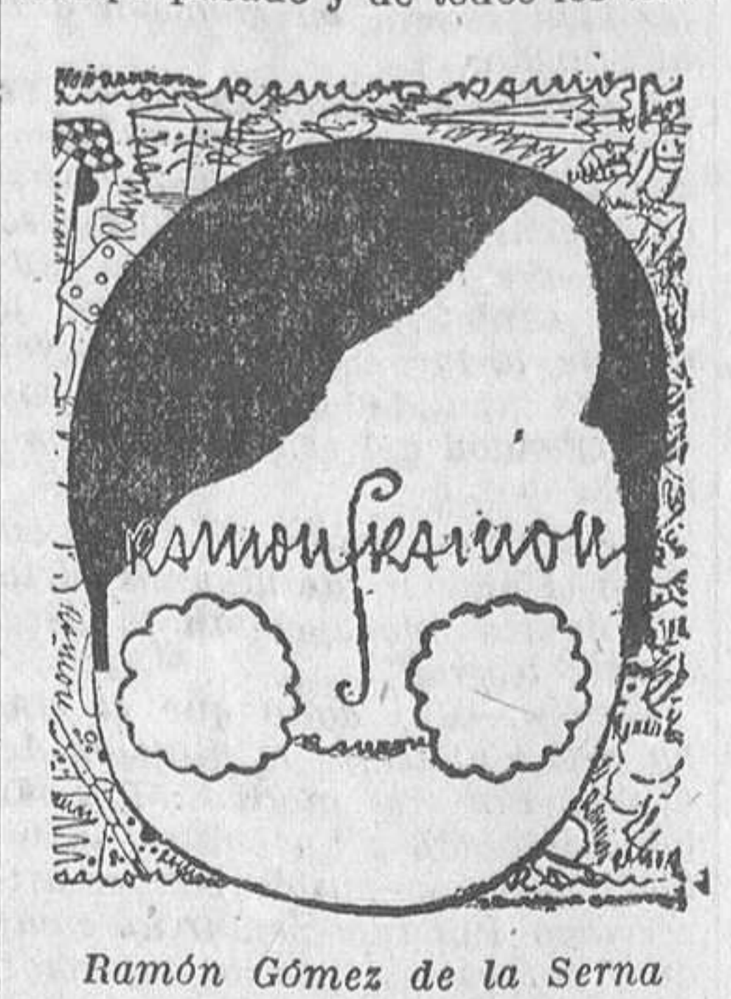
Ramón Gómez de la Serna

entronzarlas en sus libros. Sin embargo, al hombre que muestre —único título— una agilidad más o menos de los días actuales, puede ser que le vuelva la espalda y el espíritu. El torcón en que escribe y su obra toda rebosa de cosas—¡que llenas éstas de sentido cósmico!—acumuladas con enorme fervor. Es una religión, un culto. Con un sacerdote exclusivo. No significa lo que va expuesto que el inventor de la greguería nunca se haya enfrentado con figuras de humana caracterización, que por virtud de su pluma han adquirido singular relieve. Al contrario, el procedimiento seguido por él con el mundo de los personajes de sus relatos y novelas, lo que hace que descubra en la opuesta dirección modalidades insospechadas. E incluso, fiel a su sensibilidad, se ocupa primero de aquello que les rodea. Y de lo que dimana de cada objeto extrae la esencia del individuo que quiere tratar. Al llegarle el instante de tener que evocar vidas que en la realidad han sido, no ha dudado en un punto ni ha tenido vacilaciones respecto al camino que debía seguir. En la literatura, el hombre y el fantasma presentan fisonomías muy comunes. Y si son—o eran—poetas, entonces las distancias se acortan y se ha de aplicar la identidad. La fórmula de Gómez de la Serna es, pues, universal, de él solo para todo lo demás, igual, aunque de índole tan distinta, que la del inmenso poeta andaluz, maestro de hoy y de mañana.