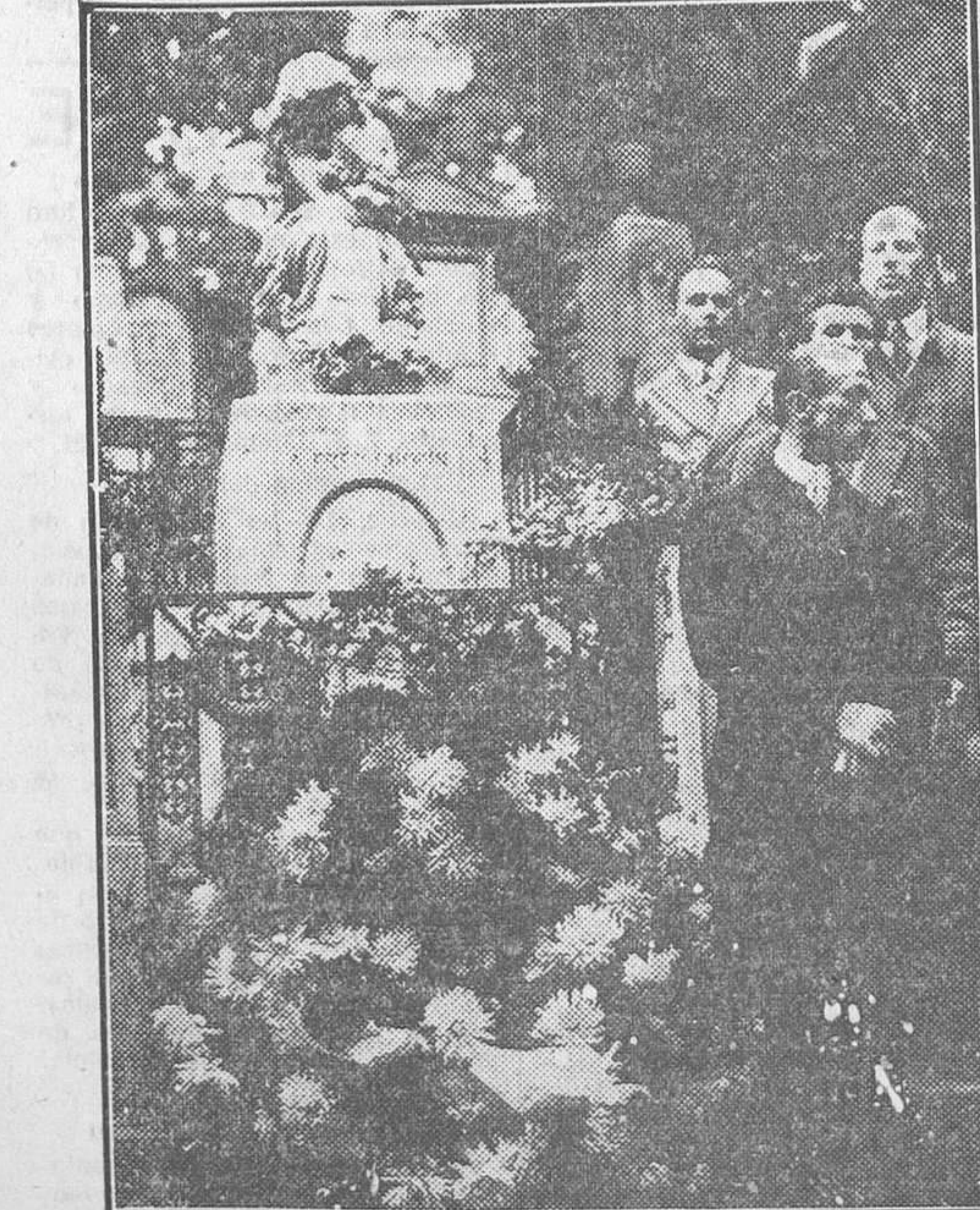
Una Delegación de Polonia depositando una corona de flores en el sepulcro de Chopin