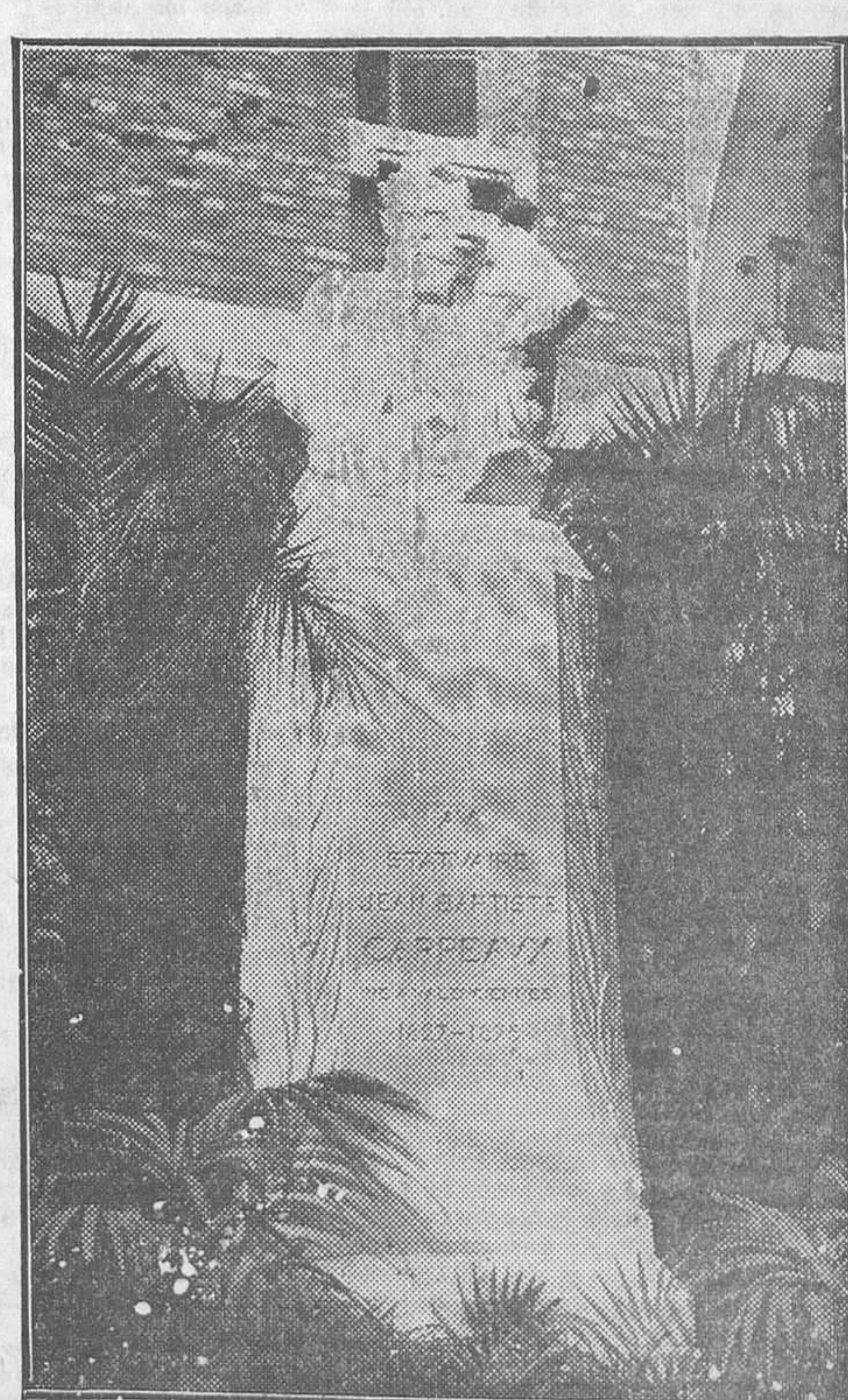
Monumento al glorioso escultor C. J. Ponce, recientemente inaugurado