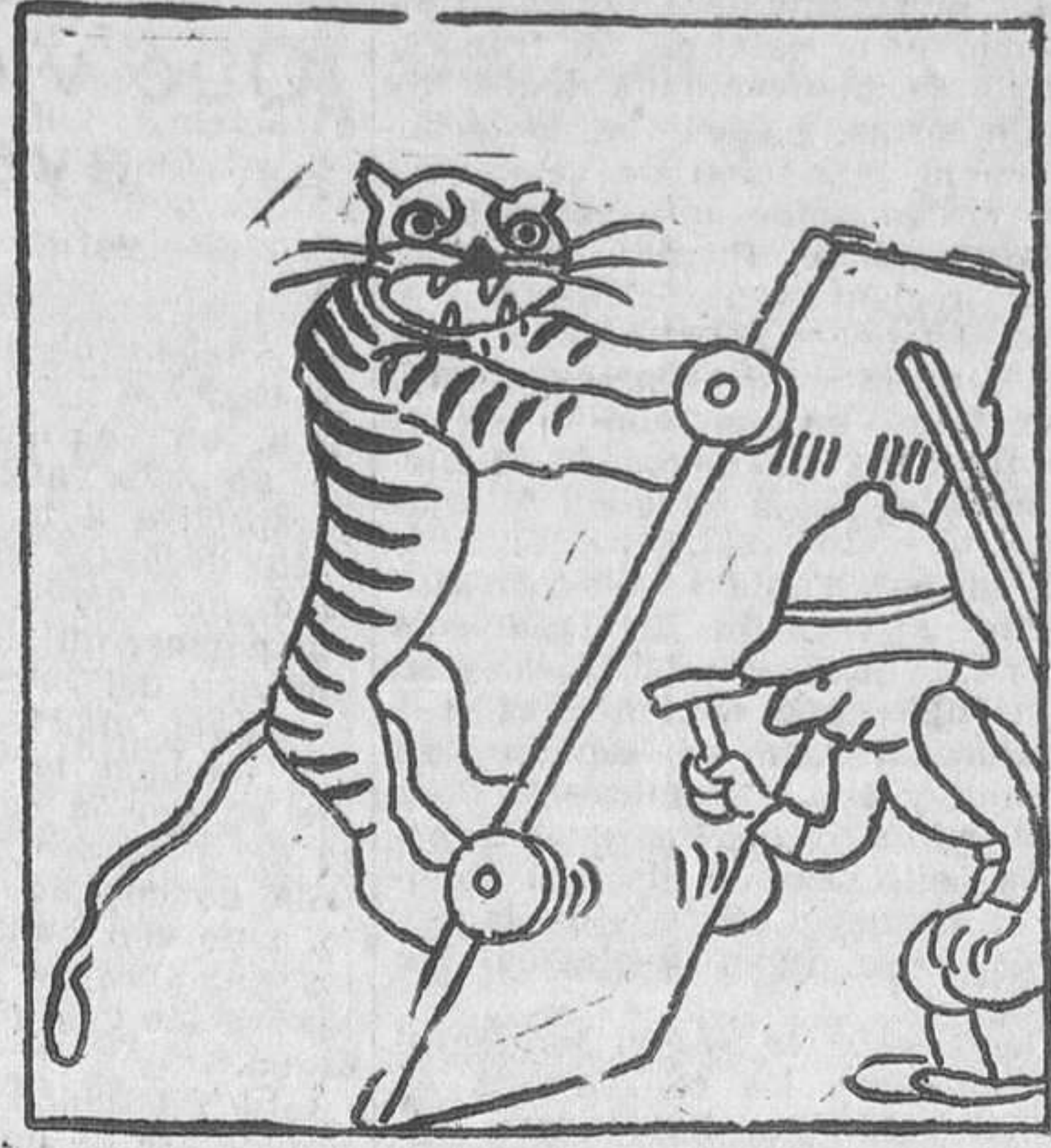
Tan pronto como el tigre clave sus garras en la tabla, remáchense las uñas...