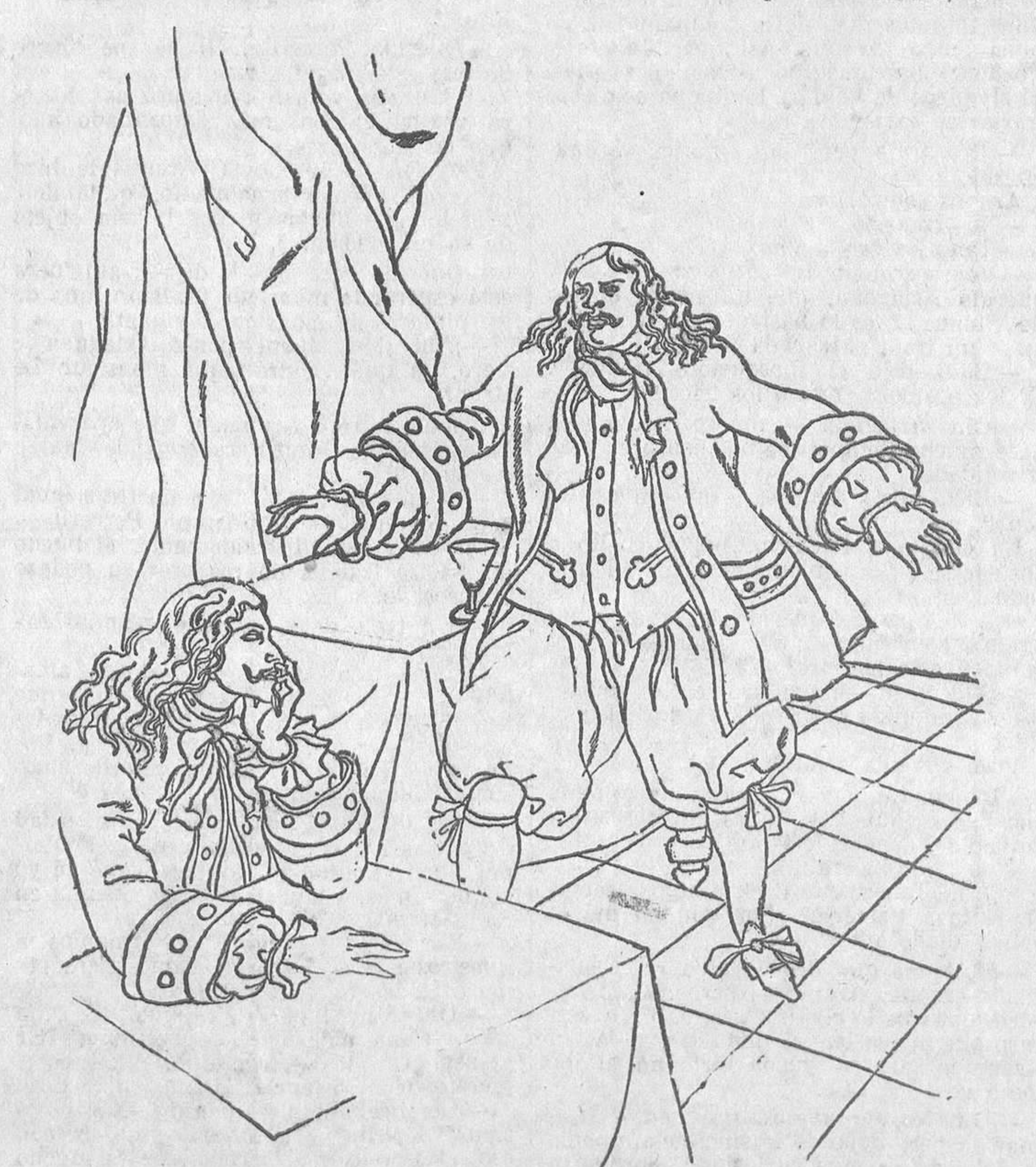
— Me parece que empezáis a comprender, monsieur de Baiseameaux

—Pues entonces, señor barón, estrenaréis nuestro nuevo método. —Pero ¿cómo diablos se arreglan?—preguntó Porthos entusiasmado. —¡Caballero!—respondió Molière, incli-