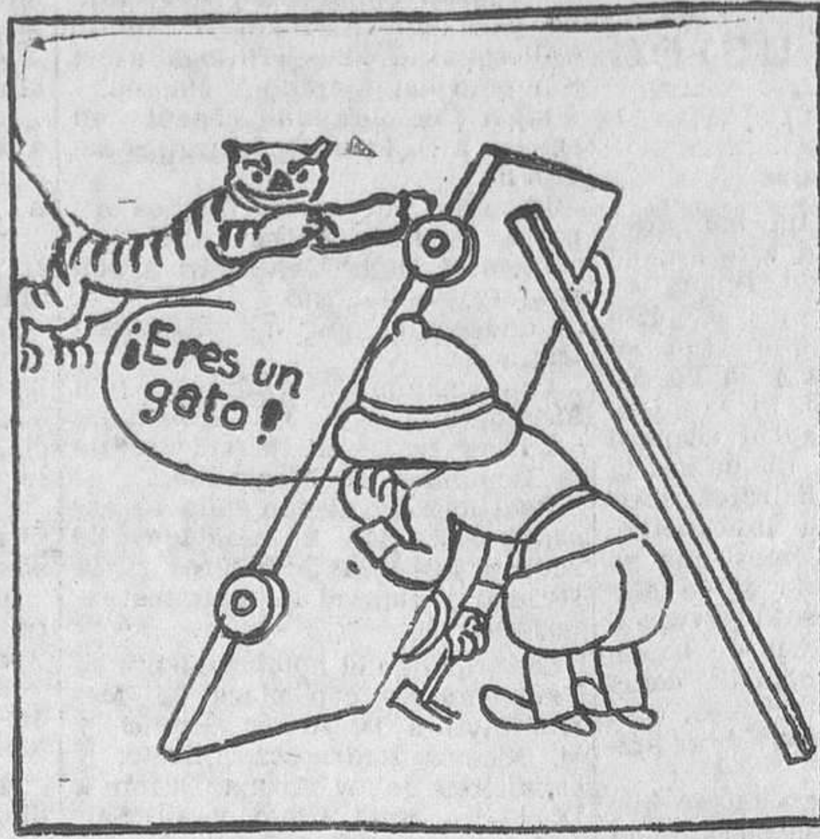
... dígaselo algo que le mortifique, para hacerle saltar sobre la tabla, tras la que se guarecerá el cazador.