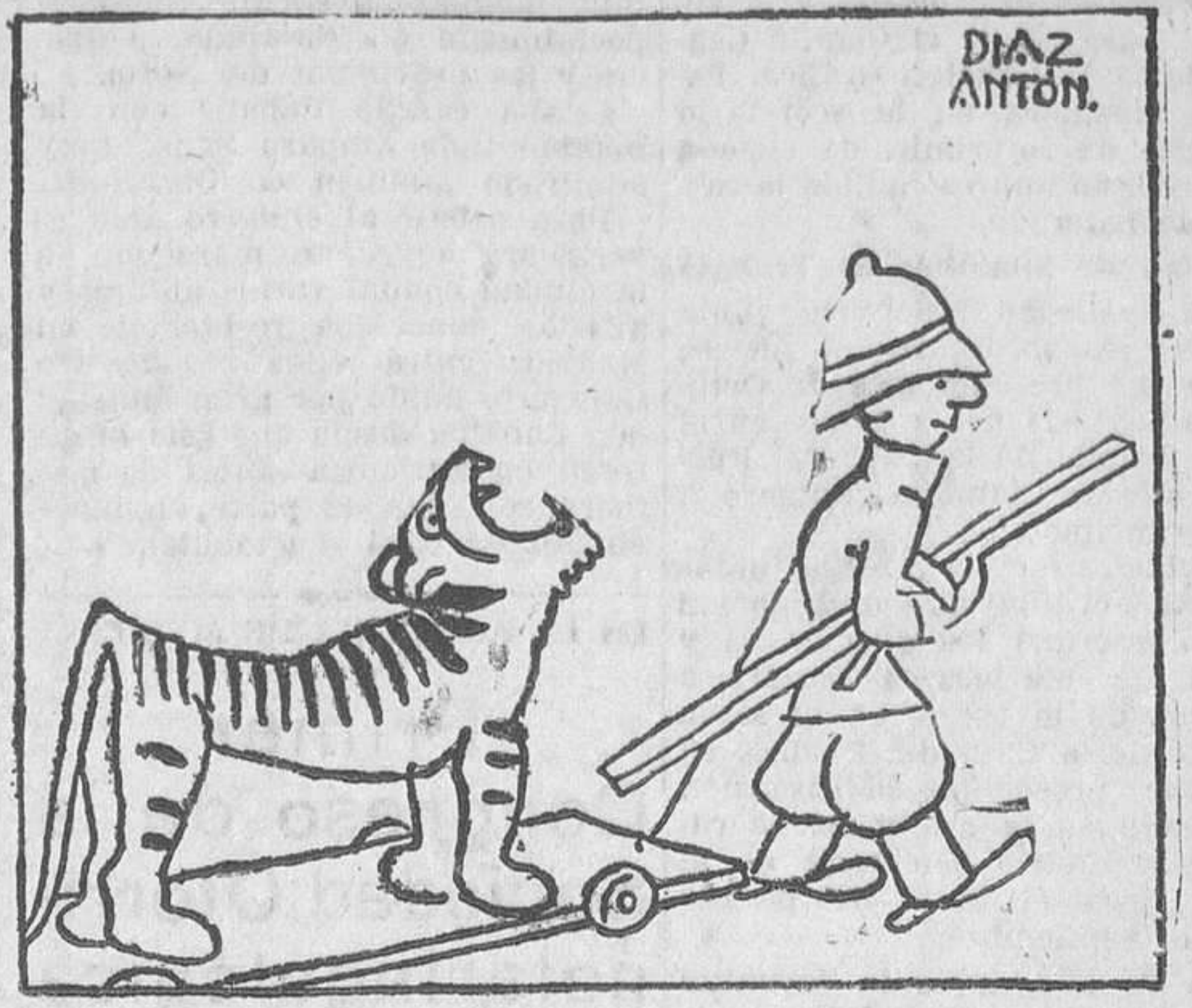
... ¡y a casita!