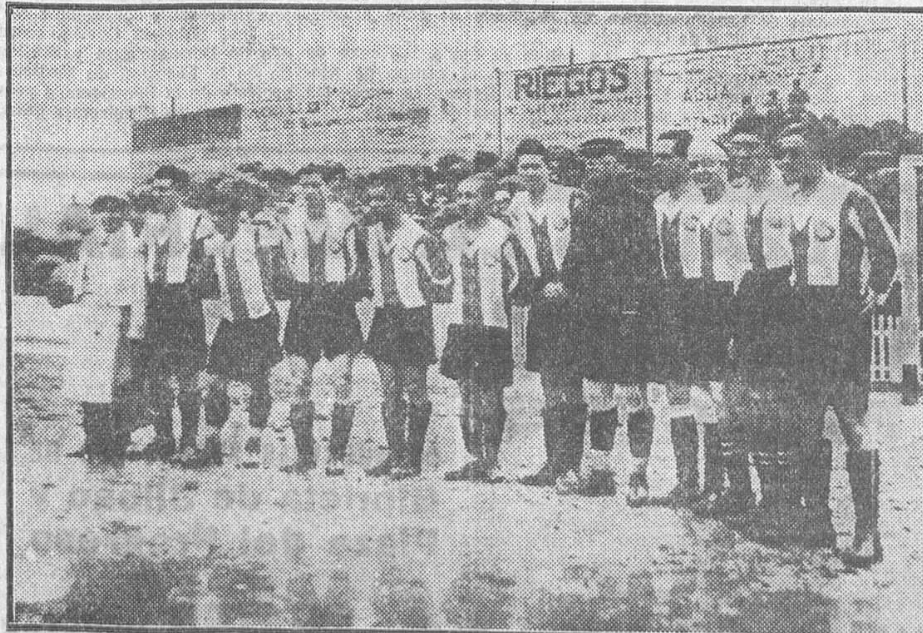
El equipo del Club Deportivo Español de Barcelona, que ha obtenido el campeonato de España

Por escoger campo el Madrid, inicia el juego el Español. Unos momentos de incertidumbre en los dos bandos, y seguidamente el ataque madrileño hace un avance primoroso por bajo, que origina el primer saque de esqui-