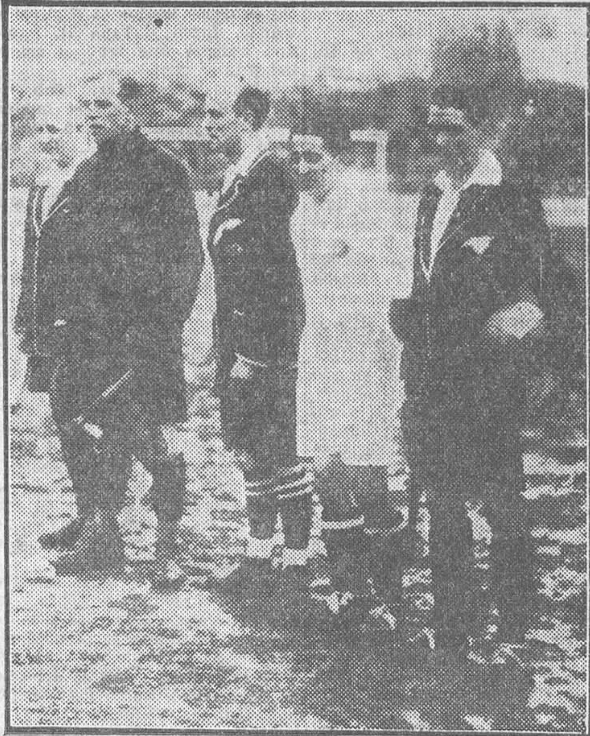
El árbitro, los capitanes y los jueces de línea, reunidos antes de dar comienzo el encuentro

Hace una semana presenciáramos en San Mamés la derrota del