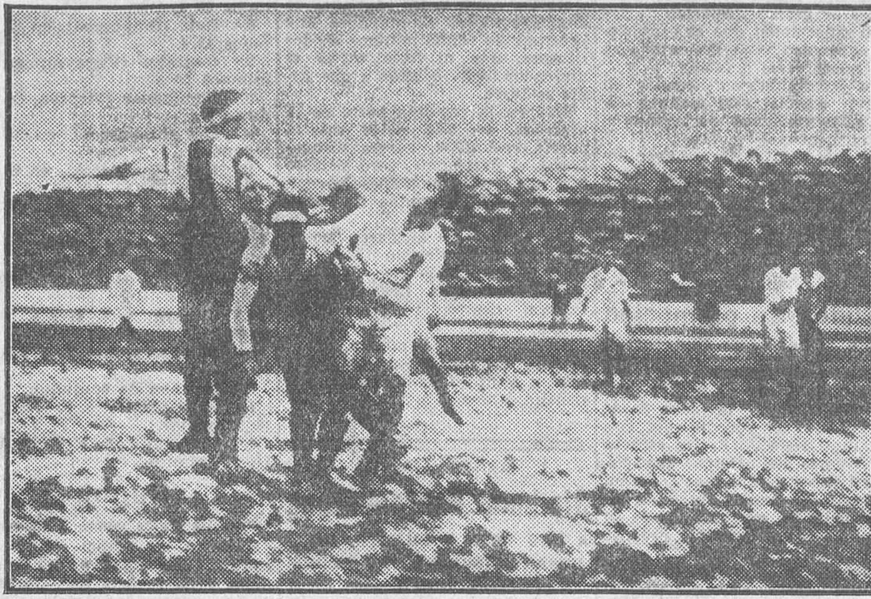
Un saque de esquina contra el Madrid, disputado arduamente por unos y otros

Son las tres menos veinte cuando irrumpen en el terreno de juego los jugadores del bando catalán. La lluvia parece arreciar en aquellos momentos con mayor fu-