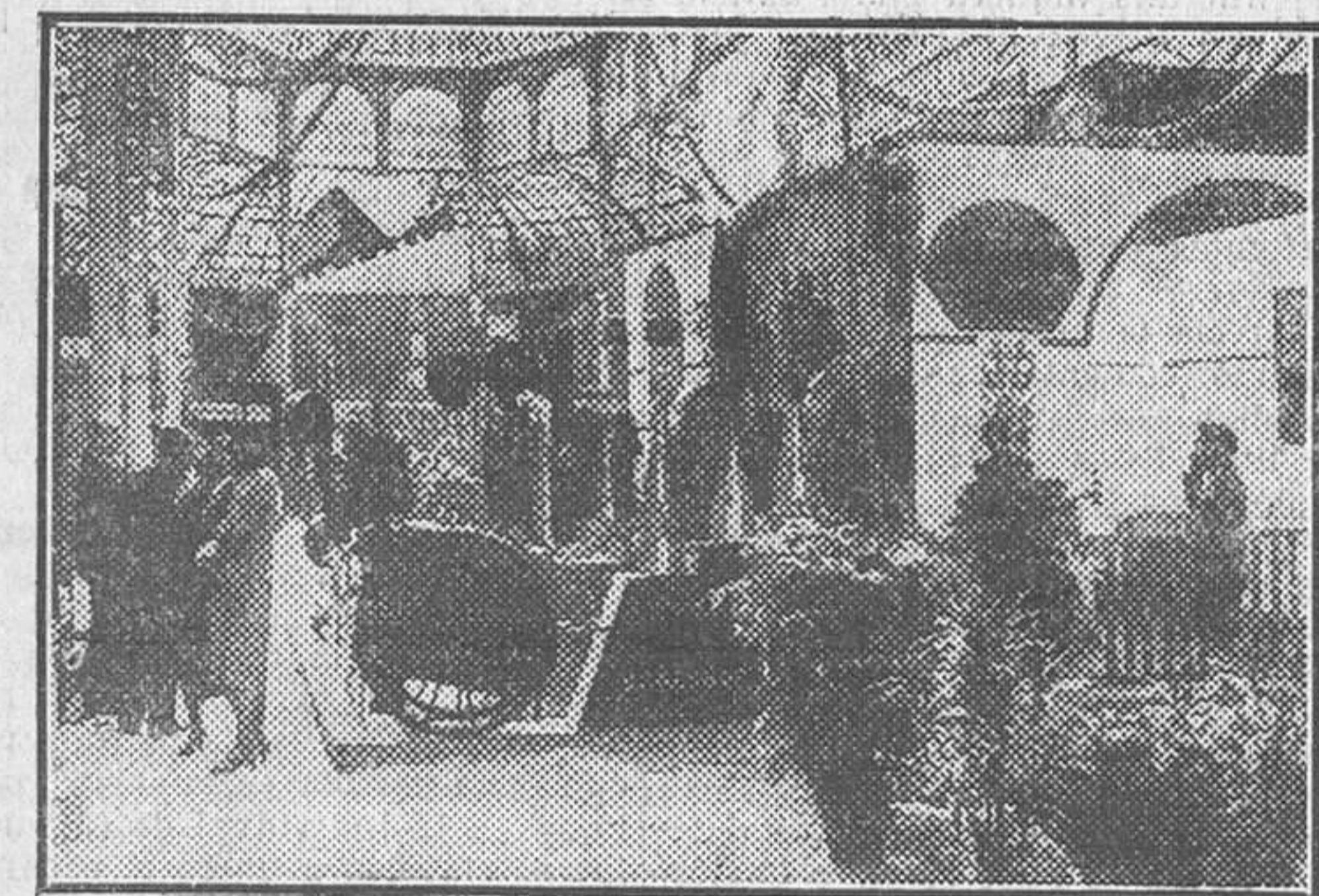
UN ASPECTO DE LA EXPOSICION GENERAL DEL SEPTIMO ARTE, INAUGURADA AYER EN EL PALACIO DE CRISTAL

«Un caballero de París» es una de las que más claramente demuestran nuestro aserto. Menjou se nos muestra en ella como un Tenorio parisino que se adueña del corazón de las mujeres de las más diversas clases sociales, y burla a los hombres con la naturalidad de quien halla lógico su dominio y su suerte. Y el público, y esto es lo que ha de notarse, halla también natural y lógico que así suceda, porque Menjou, con su sencilla cordialidad que de la pantalla irradia el ánimo del espectador, nos inspira la misma seguridad que él siente: ese humorismo optimista que amaña su gesto en las más difíciles situaciones. «Un caballero de París» ha obtenido un franco éxito: el éxito des-