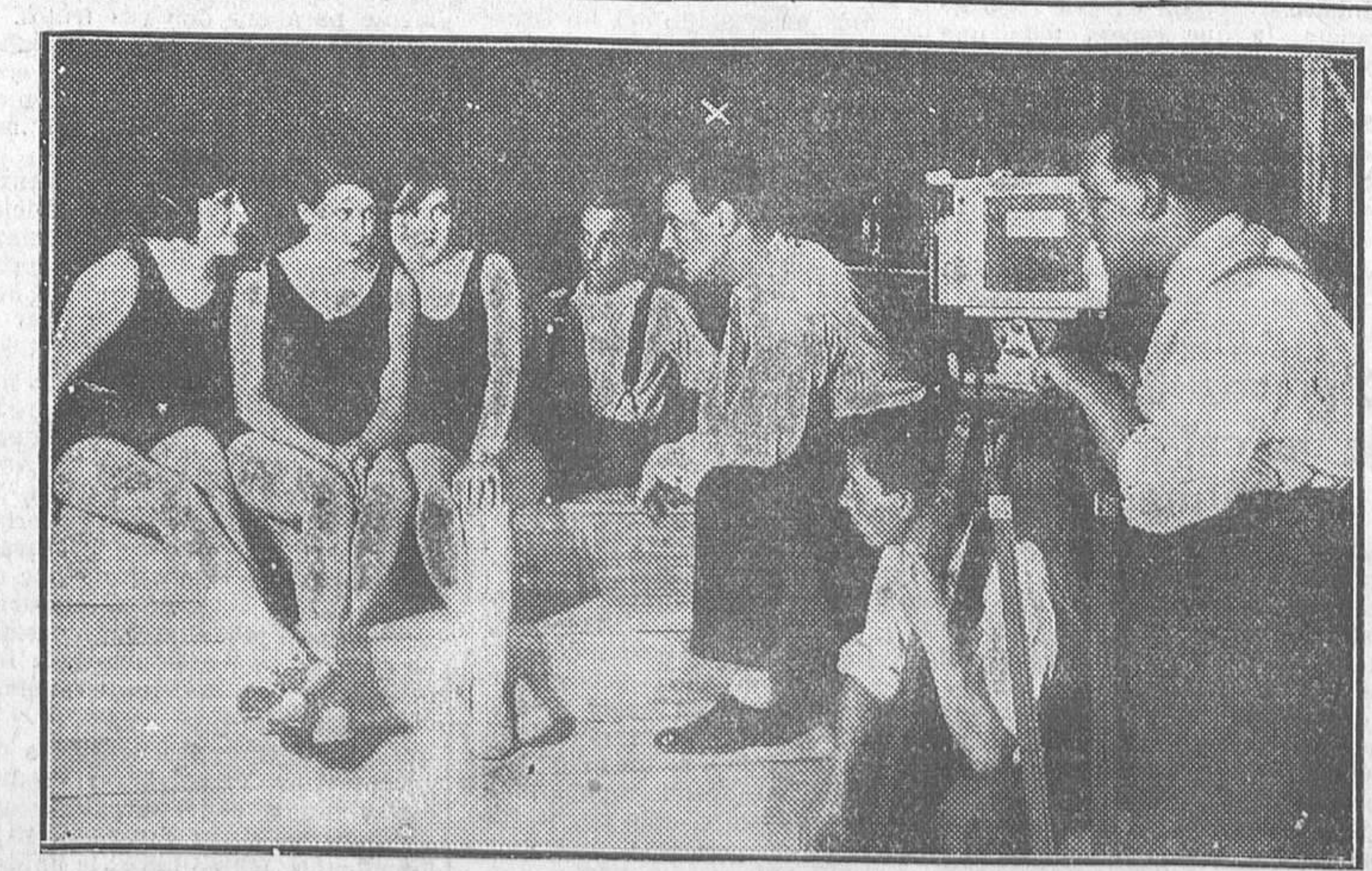
EL DIRECTOR ESPAÑOL FLORIAN REY Y SU OPERADOR, FILMANDO PRUEBAS PARA ELEGIR INTERPRETES DE SU NUEVA PELICULA «AGUSTINA DE ARAGON»