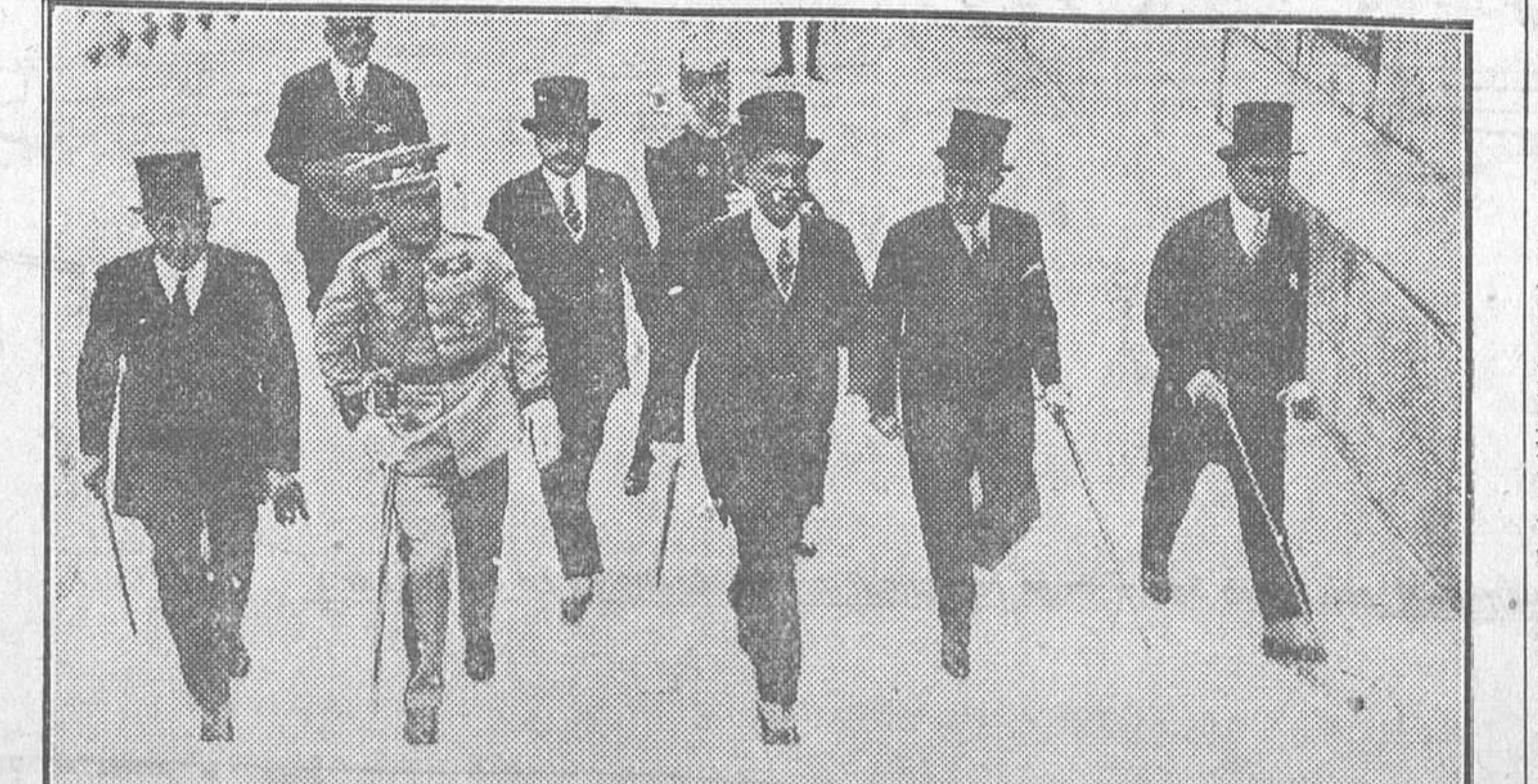
El maharajá de Kapurthala y su hijo, el príncipe heredero, acompañados de su séquito, al llegar ayer al Museo de Pinturas

El Juzgado, formado por el juez D. Cesáreo Polo, oficial habilitado Sr. Arbeta y alcaide Sr. Aguado, ordenó el traslado del cadáver al Depósito judicial.