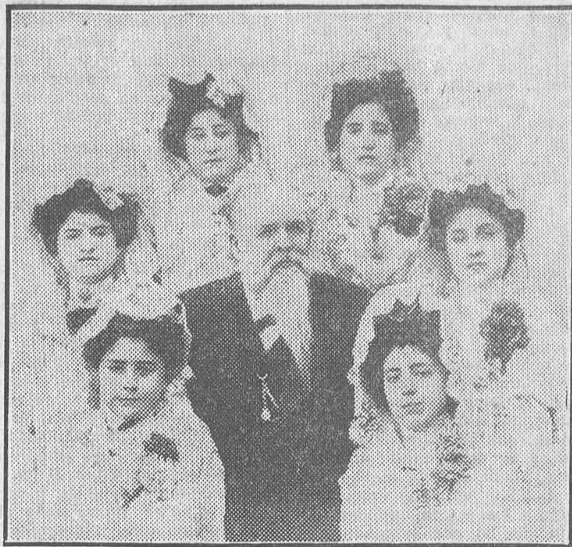
El maestro Fernández Caballero, rodeado de algunas señoritas murcianas, después del acto solemne de imponerle en Murcia, en el año 1903, la gran cruz de Alfonso XII, cuyas insignias fueron costeadas por suscripción popular

«Los sobrinos del capitán Grant», en cuatro actos (1877), deliciosa obra cómica, de la que fueron repetidos casi todos los números,