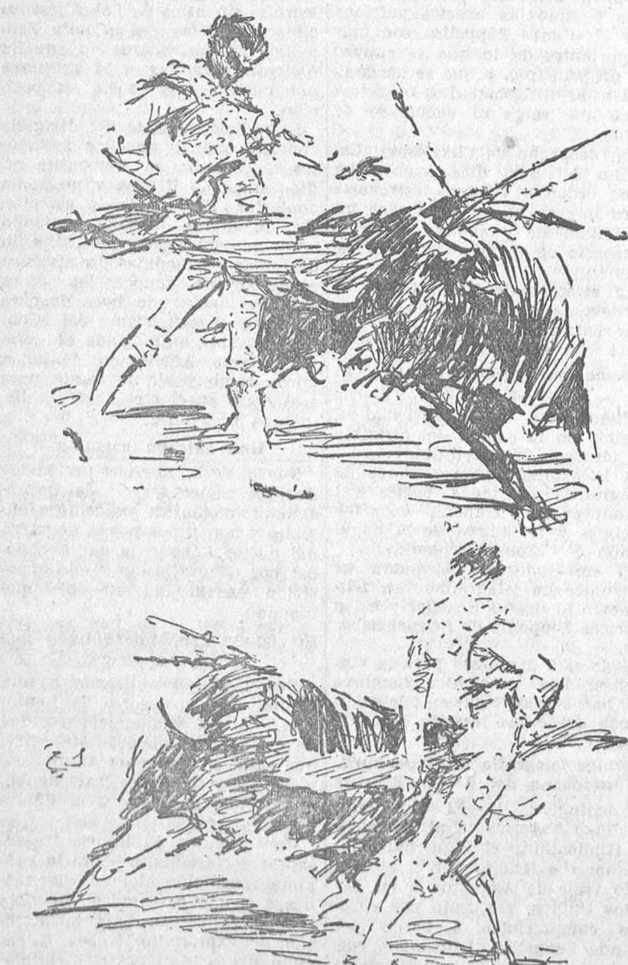
EL DOMINGO, EN MADRID.—Dos momentos de la faena de muleta de Cagancho en el segundo toro, del que cortó la oreja