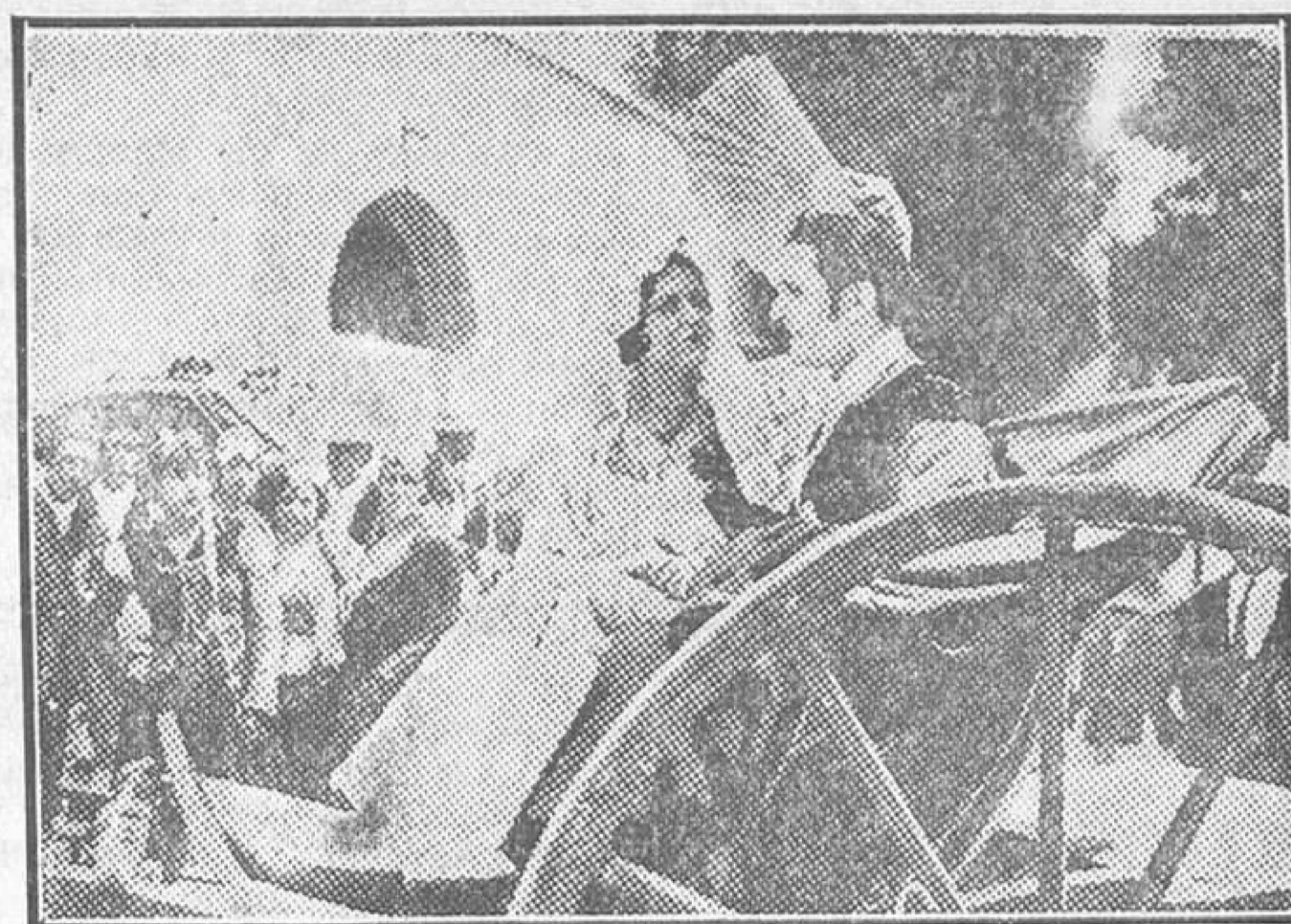
UNA BELLA ESCENA DE LA PELICULA NACIONAL «PEPE-HILLO»