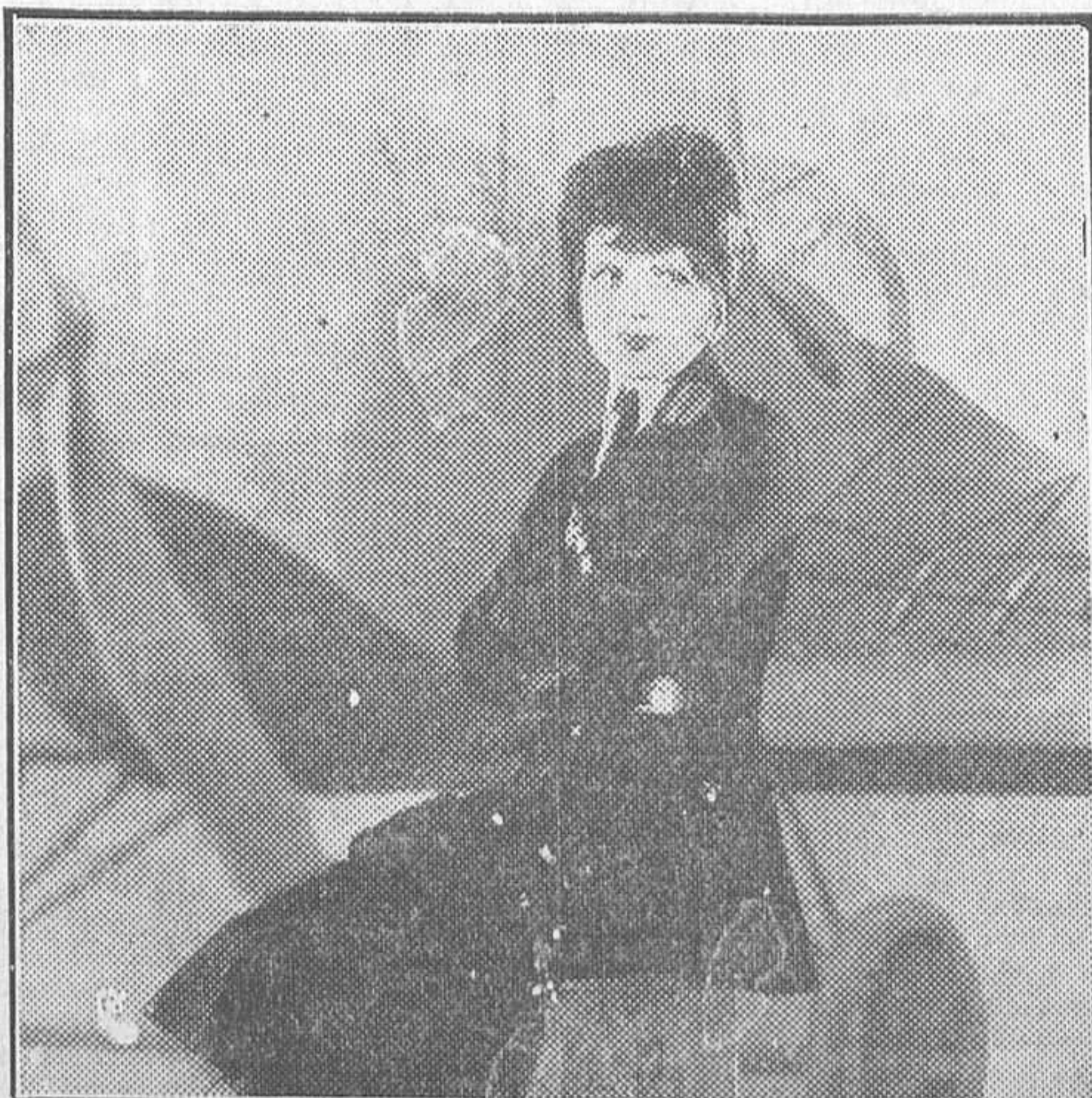
LA ESTRELLA CLARA BOW, PROTAGONISTA DE «ALAS»

Billie Dove y Lloyd Hughes Versión musical por una orquesta de 20 profesores