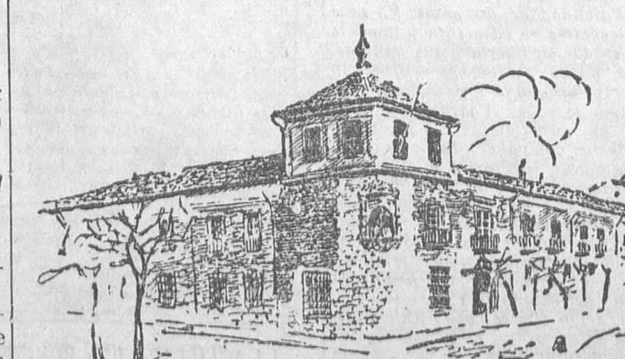
VALLADOLID.—Plazadonde nació Felipe II