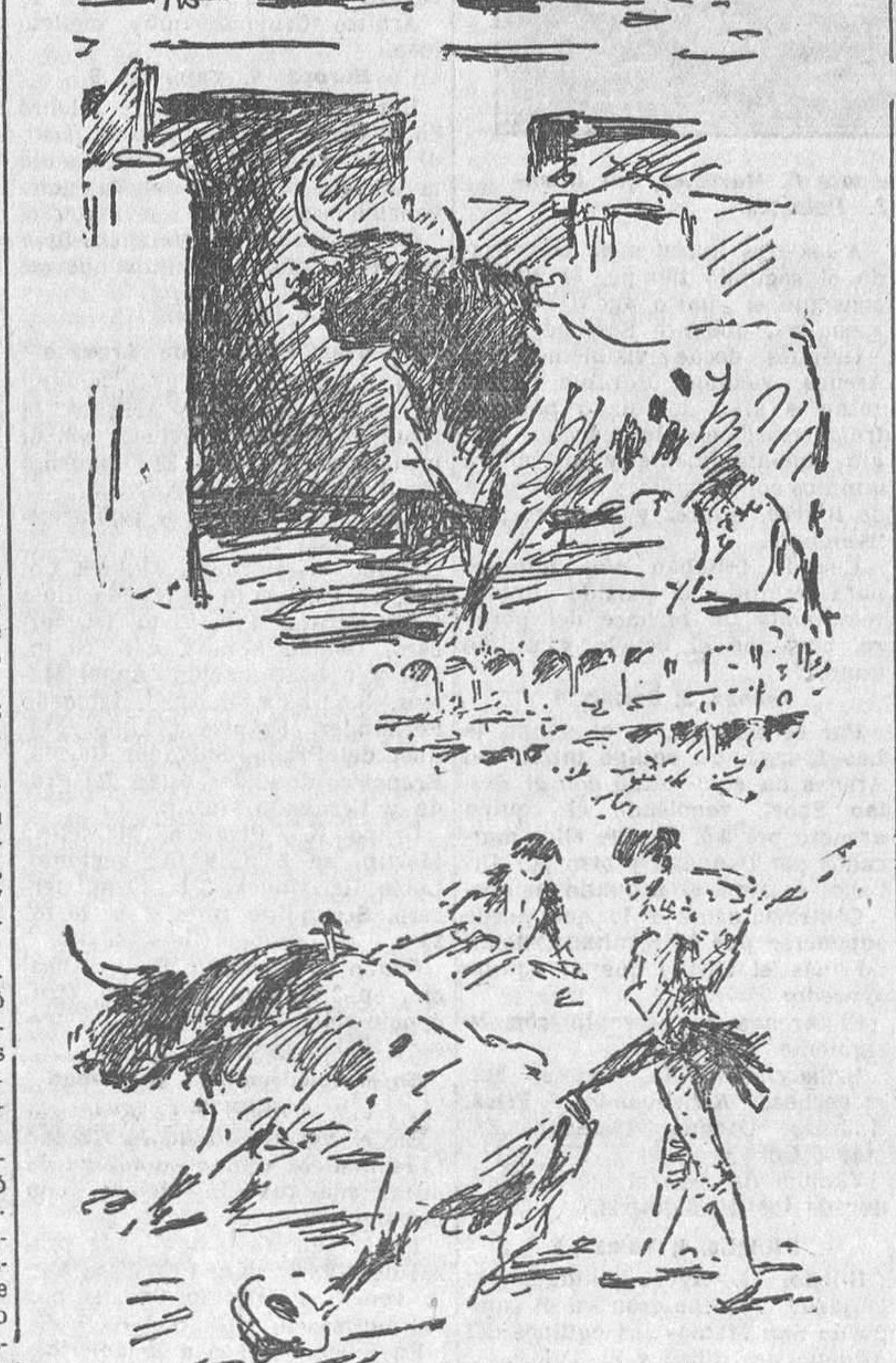
EL DOMINGO, EN MADRID.—La salida del sexto toro.—Pérez Soto viendo doblar al tercer toro

tamente. Cita al astado, se lleva el capote a la cintura, y cuando esperamos verle tropezar con un foco le vemos estirar los brazos y el toro pasa o sale de su cuerpo no sabemos cómo. Y otra vez la multitud se enardece en el aplauso.