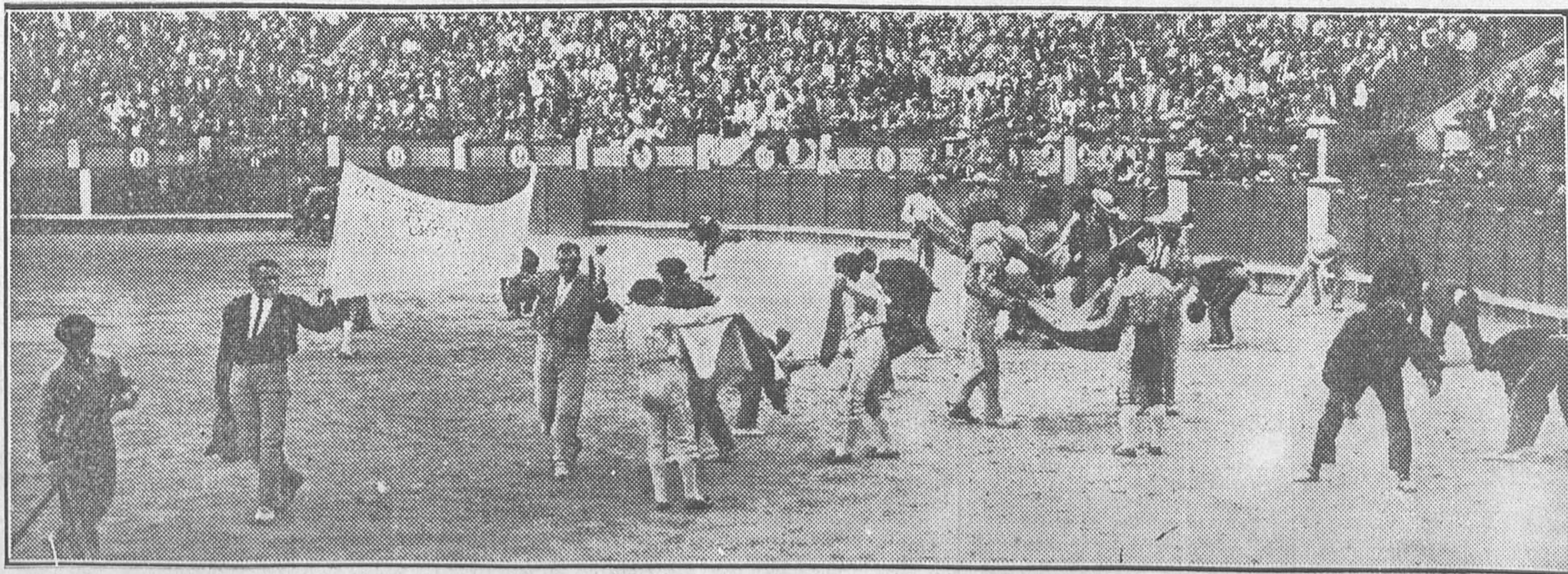
Las cuadrillas que torearon el domingo en Madrid haciendo una colecta en favor de la madre del picador Colorado, recientemente fallecido a consecuencia de una cornada.

Una de las referidas llaves se ha comprobado que es con la que se cometió un robo en un establecimiento de la plaza Mayor, 1, de donde los ladrones se llevaron gran cantidad de pares de medias.