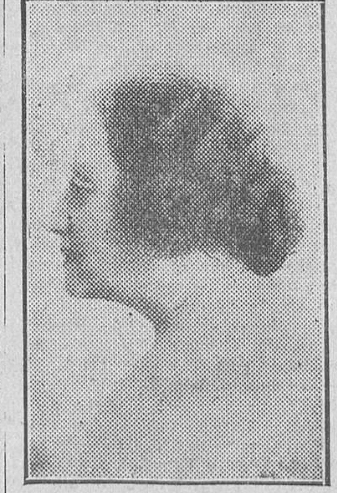
Aurora Cáceres («Evangelina»), notable escritora peruana

En el fragor de la diátria lucha es como remanso de paz la lectura de libros como «La Ciudad del Sol», de tan insigne autora como Aurora Cáceres, «Evangelina». Escritora de espíritu exquisito, la bellísima Aurora Cáceres hace vivir en las páginas de su libro, lleno de inspiración, todo un mun-