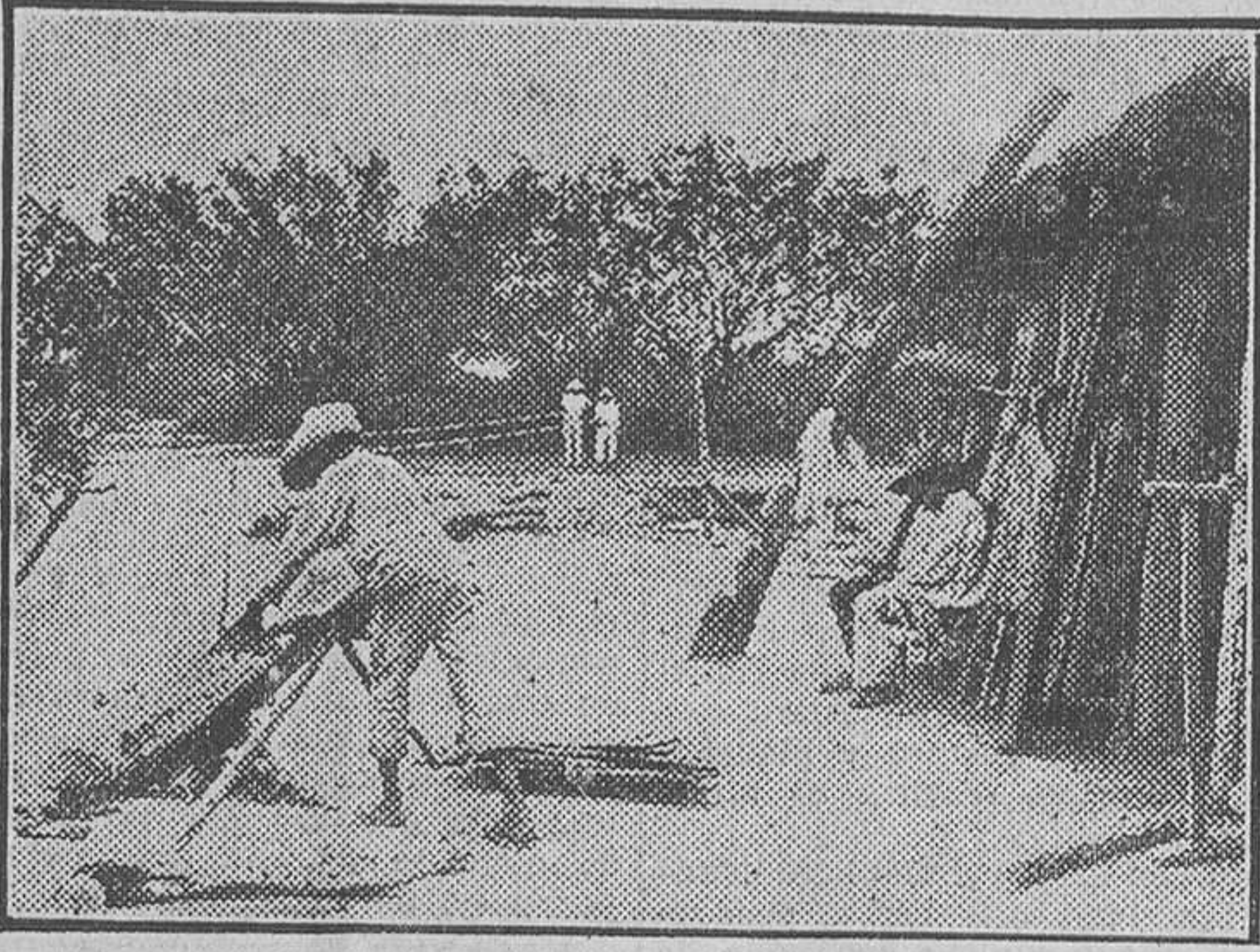
En el campo mejicano

cribada del yanqui a puros golpes de acero: —¿Y la pistola? —Ahí la tiré a un «placer». Y le señalaba un solar desierto. El general atronó el camino con una carcajada. Mi cubanismo—placer, solar sin casas—, tan distinto de los placeres de oro y de los demás placeres, le hizo feliz para varios días. Se empeñó en que comiéramos juntos, opulentamente, en el café Colón, para celebrar la ocurrencia con el espía sajón, de cabello de hilaza. Entonces, hinchado el humano tamboril de