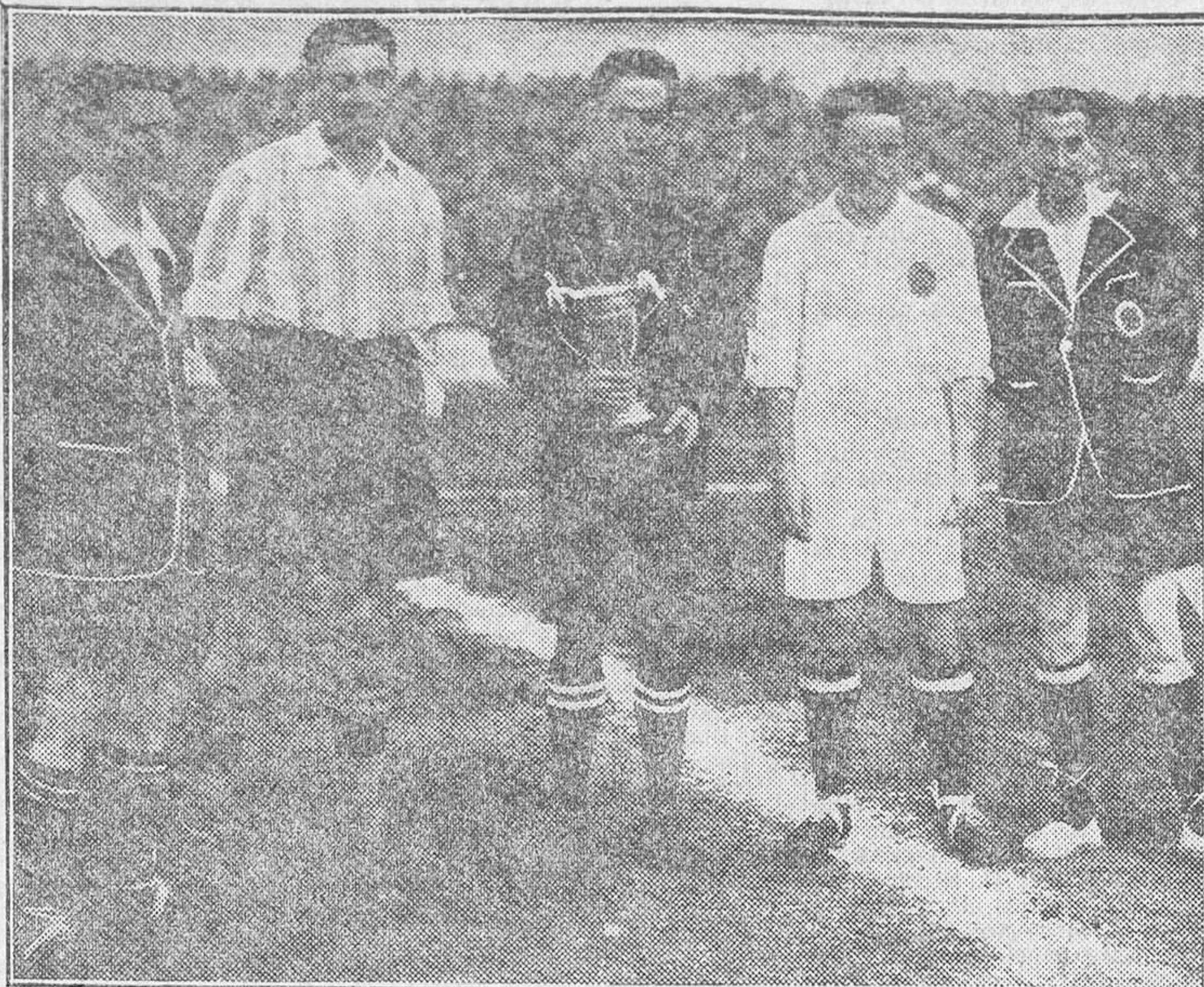
EL PARTIDO DEL DOMINGO.—El capitán del Deportivo Alavés y el del Madrid, con el árbitro, Lloveras

No realizan el juego buscando el lucimiento personal, sino con el deseo de ver la forma de obtener el mayor partido posible de la labor de conjunto. Por ello no se pueden apreciar relevantes méritos individuales en sus componentes.