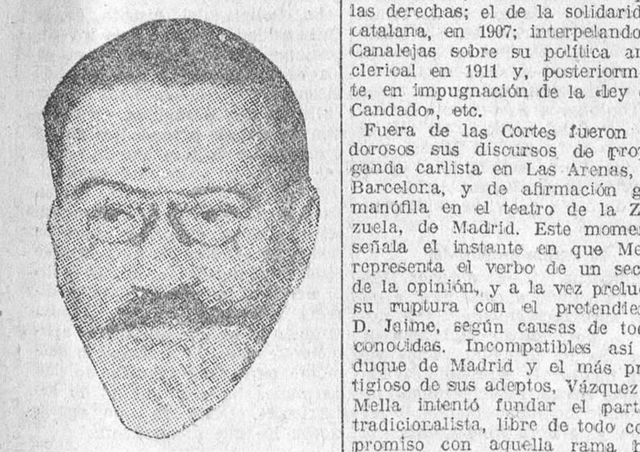
D. Juan Vázquez de Mella

Agravado considerablemente el estado del Sr. Vázquez de Mella, los pronósticos de los médicos, que habían anunciado un funesto desenlace, se cumplieron mediada la noche del domingo al lunes.