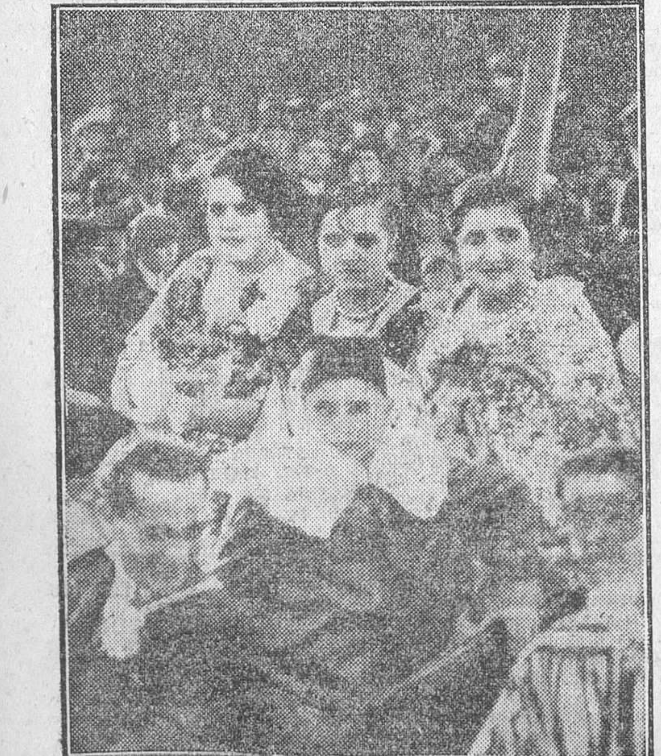
EPILOGO DEL CARNAVAL. — Un coche bien aprovechado