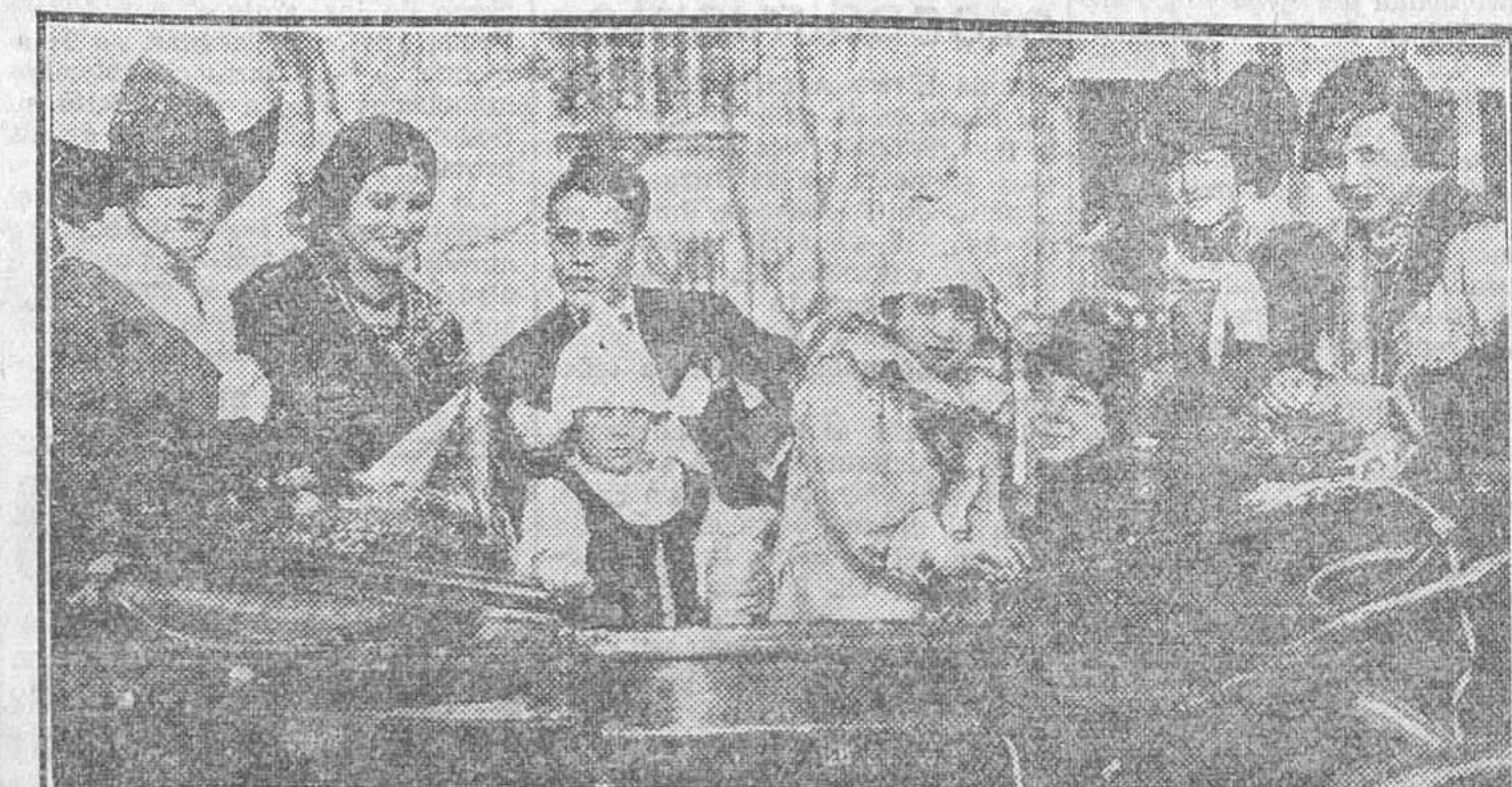
EPILOGO DEL CARNAVAL. — Un coche de chicas guapas