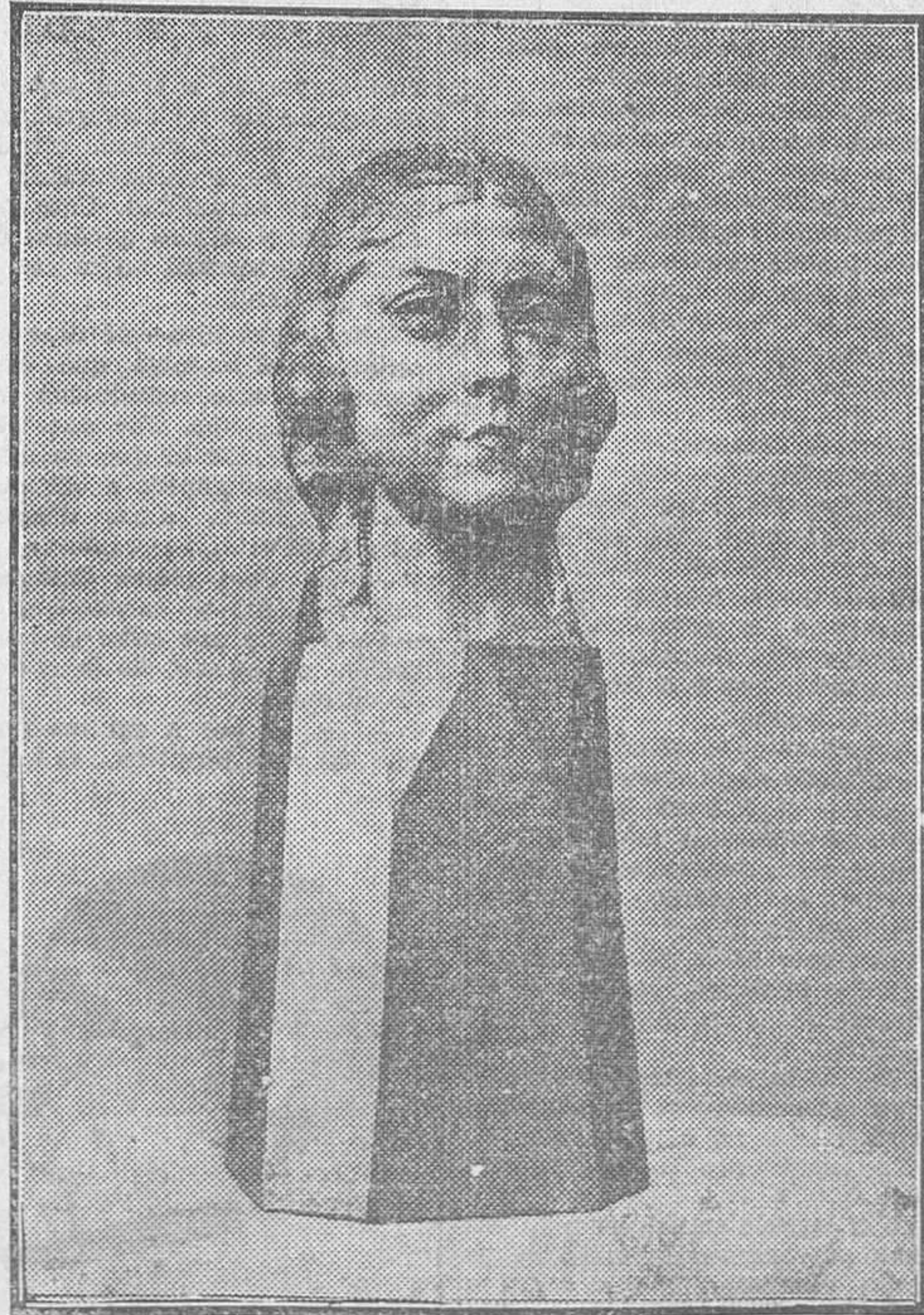
Ofelia Nieto, talla directa en madera, por Bonome

Ayer se celebró en la Casa Vilme la inauguración de la Exposición de cuadros y esculturas de Valentín Zubiaurre (pintor), y Santiago Bonome (escultor), ambos artistas de positivo e indiscutible mérito.