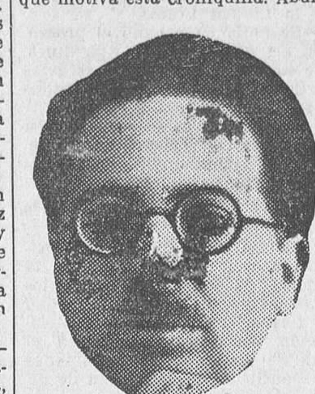
El popular maestro Paco Alonso, que anoche alcanzó un gran éxito con la inspirada partitura de «La parranda»