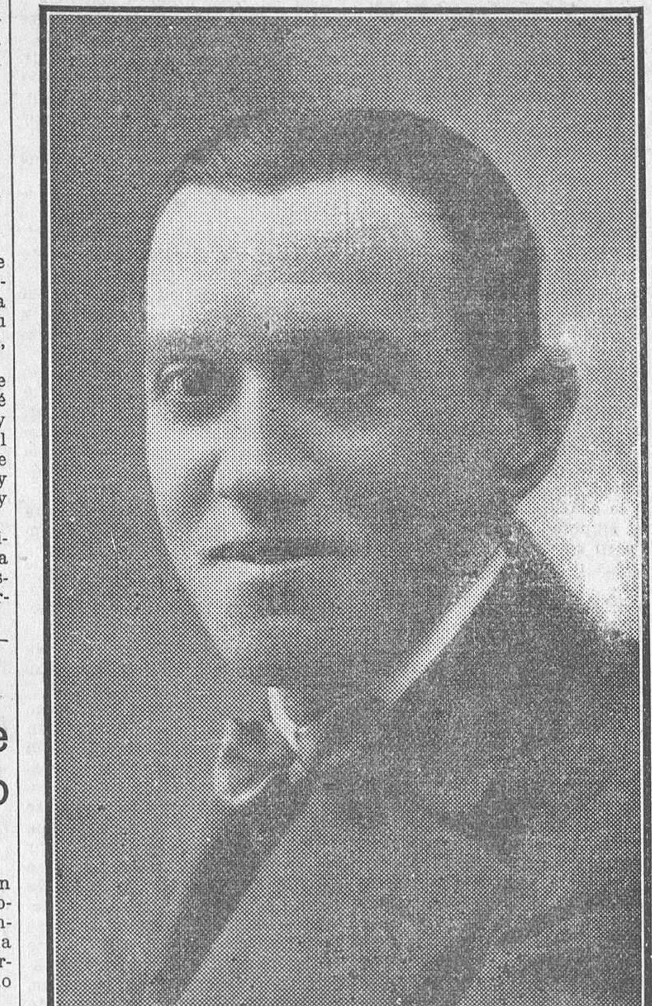
El insigne escritor Ramón Pérez de Ayala

El público iba decidido a exigirle al maestro Alonso lo que cree que el maestro Alonso puede darle. Un terceto y un dueto coreado del acto primero ganaron las primeras ovaciones de la noche.