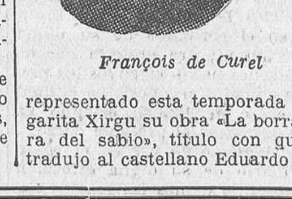
François de Cúrel

Este insigne literato, bien conocido de nuestro público por haber