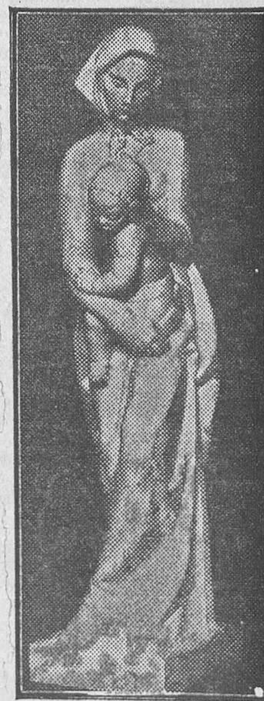
«Maternidad», escultura de Juan Adsuara

—En la actualidad, la escultura en España—nos dice Adsuara—se encuentra en un periodo de evo-