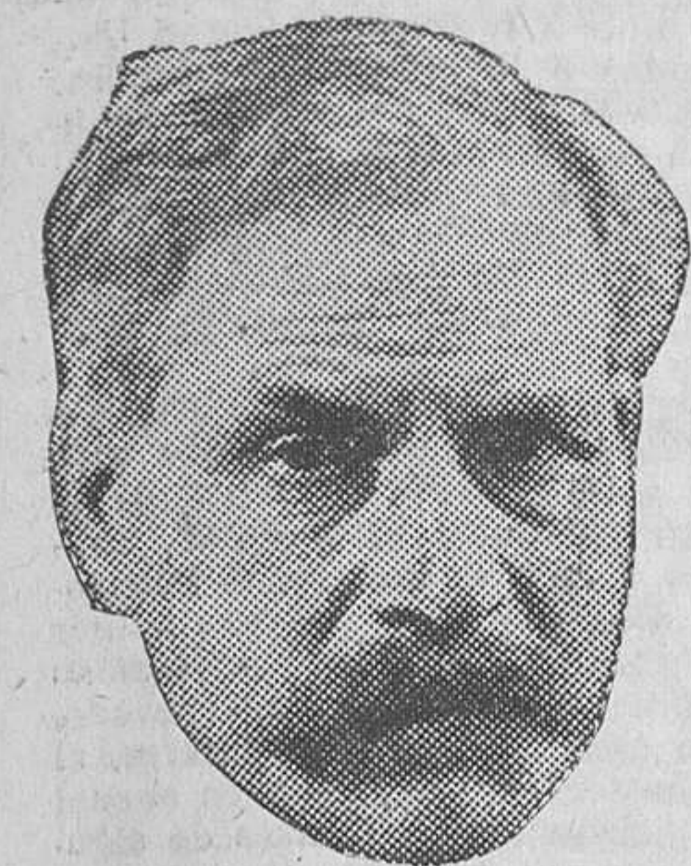
Ramsay Mac Donald, jefe de los laboristas ingleses

Los datos hasta ahora recibidos por telégrafo dando cuenta de los resultados de las elecciones celebradas en Inglaterra para la renovación del Parlamento son los siguientes: laboristas, 287 puestos; conservadores, 251; liberales, 52; independientes, 7.