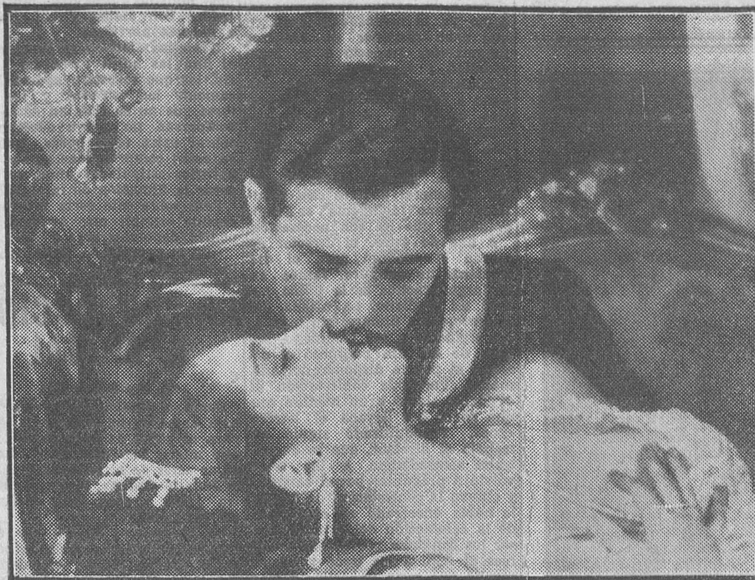
BILLIE DOVE Y ANTONIO MORENO EN UNA NUEVA OINTA DE LA FIRST NATIONAL

Convengamos en que gran parte de los errores señalados en esa competencia de opiniones, encuestas e intervius a que nos referimos existen realmente, y admitamos la eficacia de las soluciones propuestas, siquiera sean tan opuestas unas de otras; pero, así y todo, para remediar el daño, donde el daño se halle, vale más