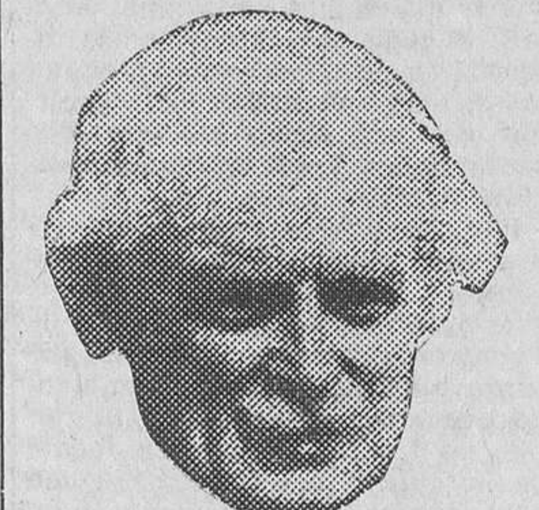
Lloyd George, jefe de los liberales ingleses