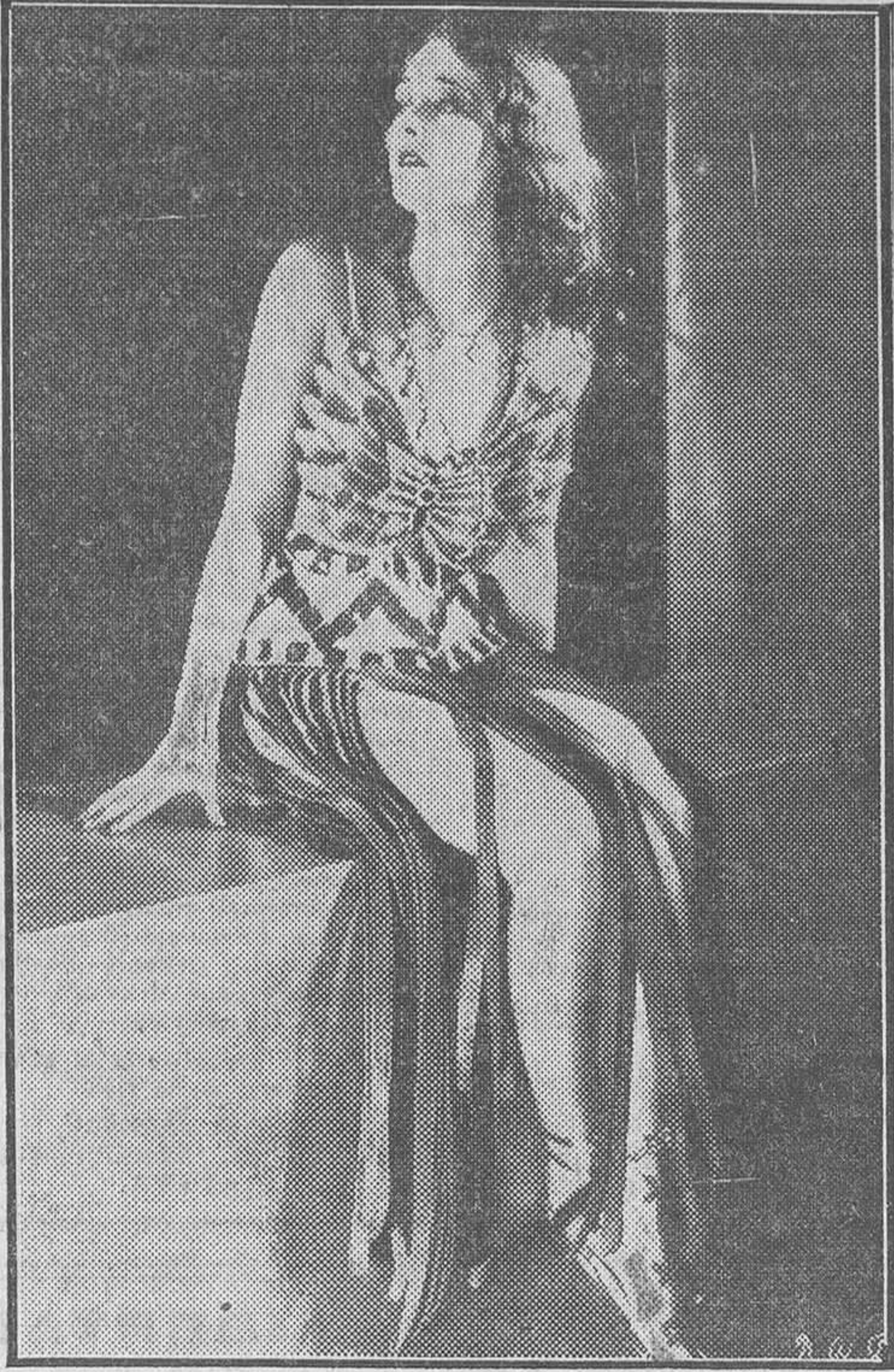
ESTA LINDA ESTRELLA DE LA WARNER BROS ES LA PROTAGONISTA DE LA CINTA DE GRAN ESPECTACULO «EL ARCA DE NOE»

Acordó el Pleno reiterar a las autoridades gubernativas la petición de que se cumplan las disposiciones vigentes sobre rifas en las verbenas, evitando perjuicios al comercio con la competencia ilícita que se le hace.