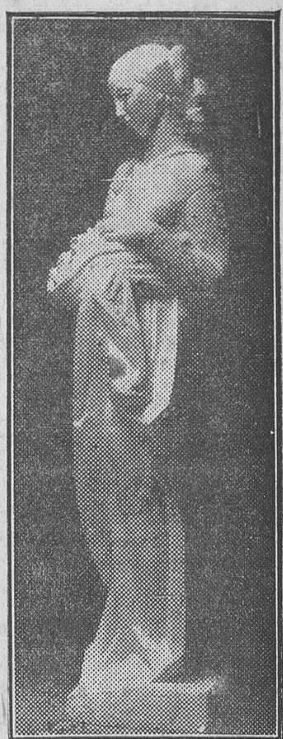
«La abundancia», escultura de Juan Adsuara

Varios edificios madrileños muestran estatuas de Adsuara. El Circolo de Bellas Artes colocará en uno de sus salones un grupo de Ad-