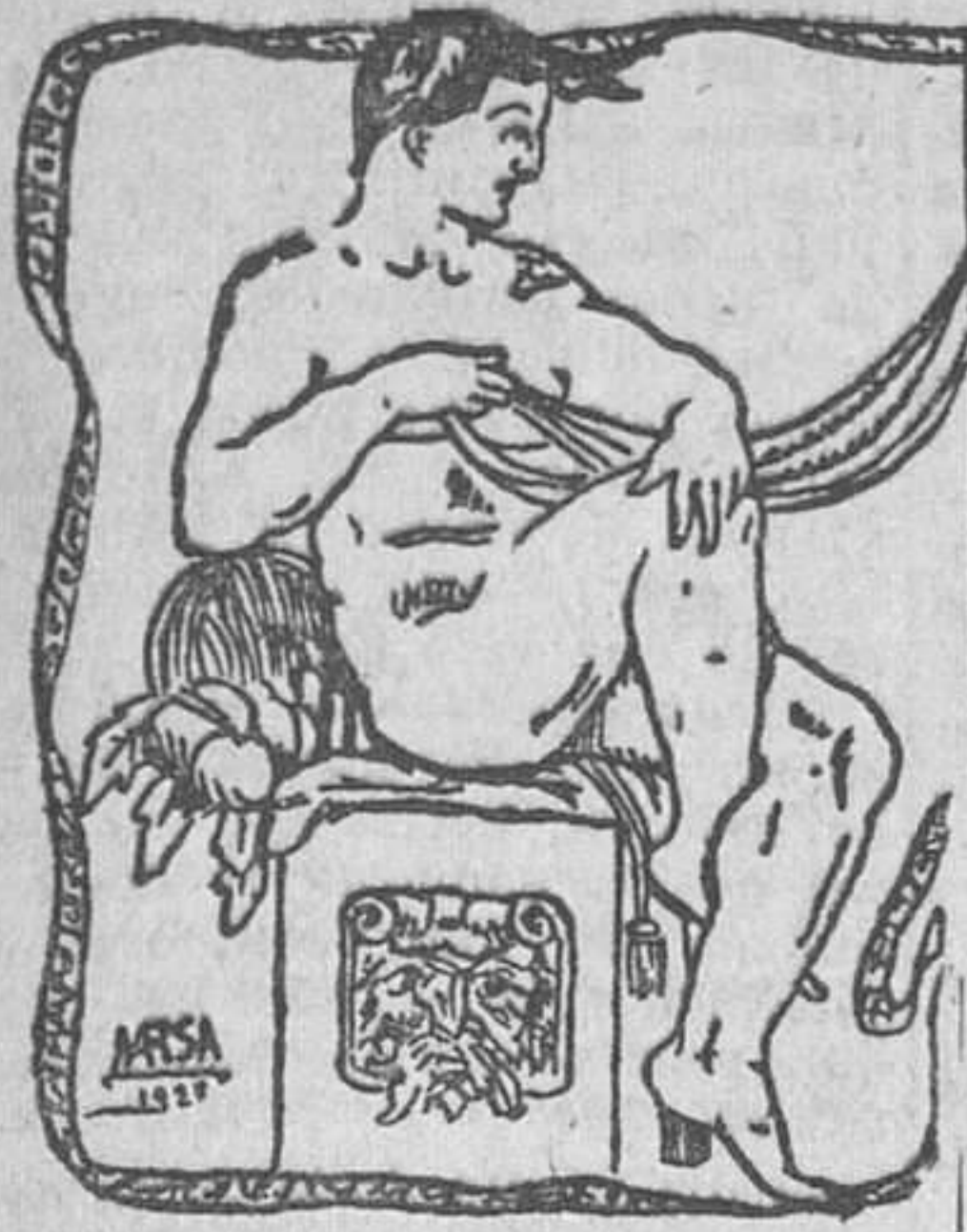
REFRANES DE SANCHO