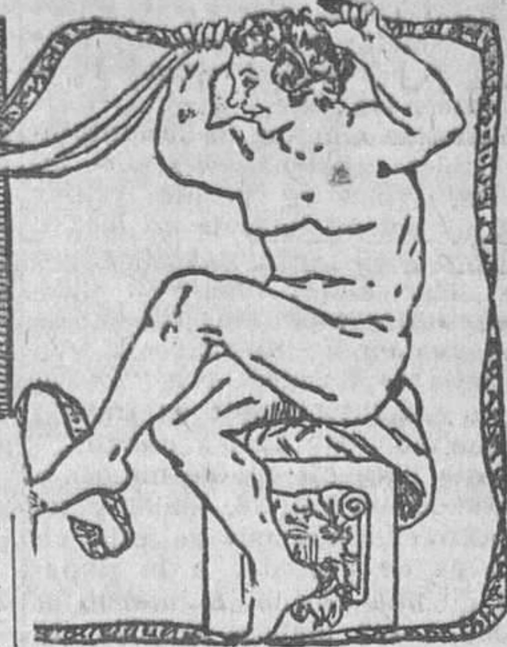
ANTES DE LA PANTALLA