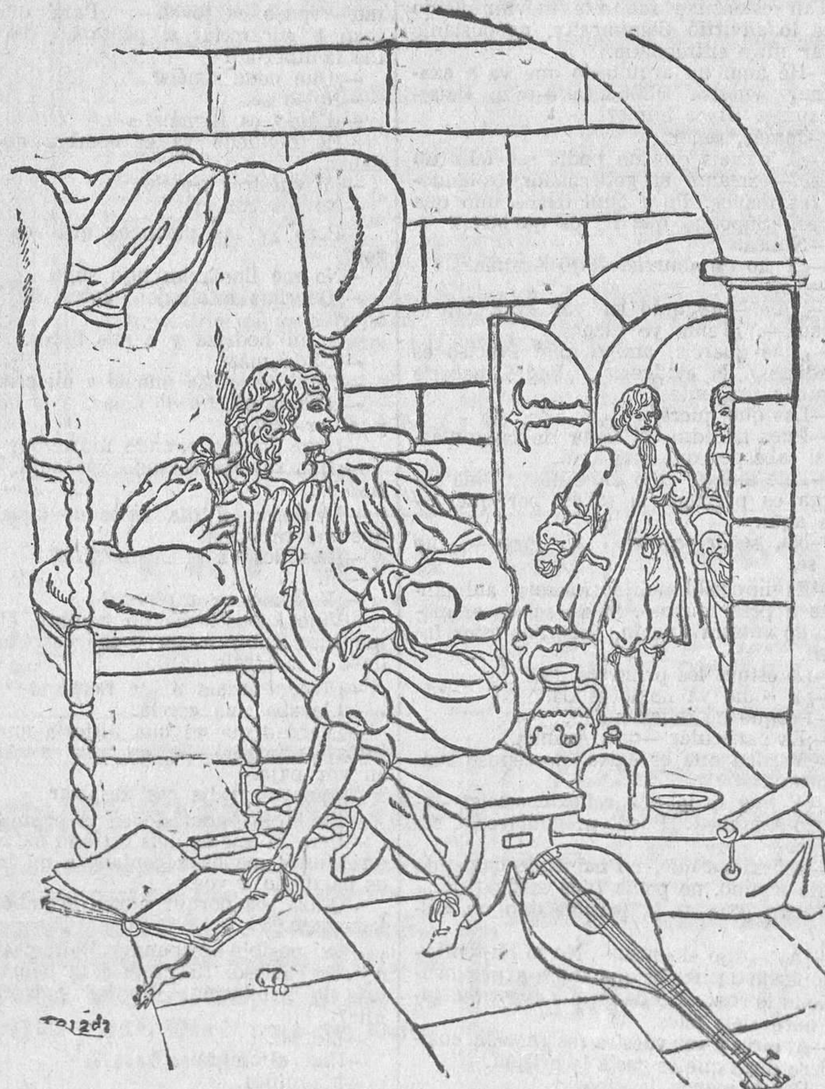
El prisionero de la Bastilla

Quando terminó dirigió la palabra al preso.