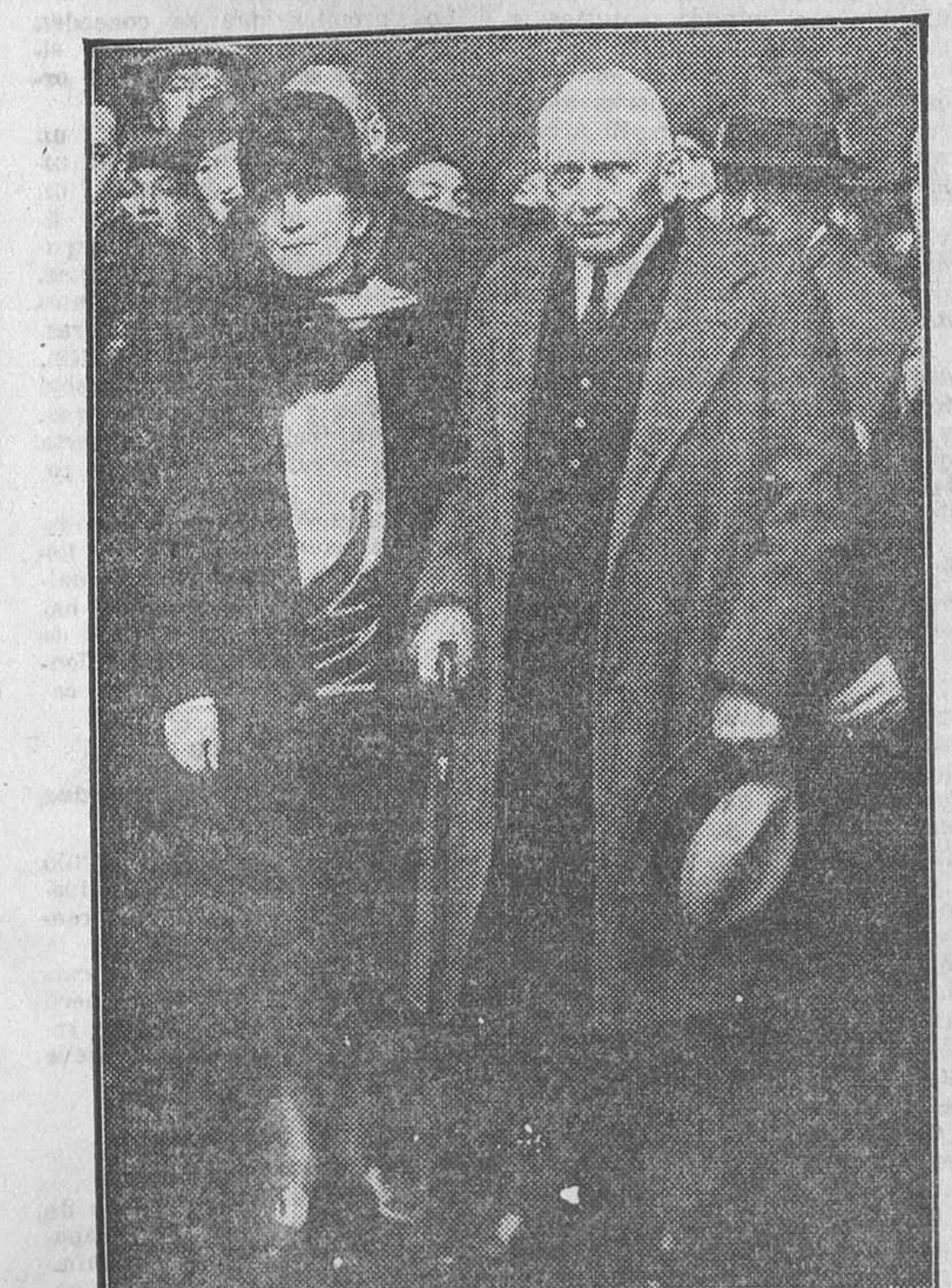
El ex ministro de Negocios Extranjeros de Norteamérica mister Kellogg y su esposa, en Paris