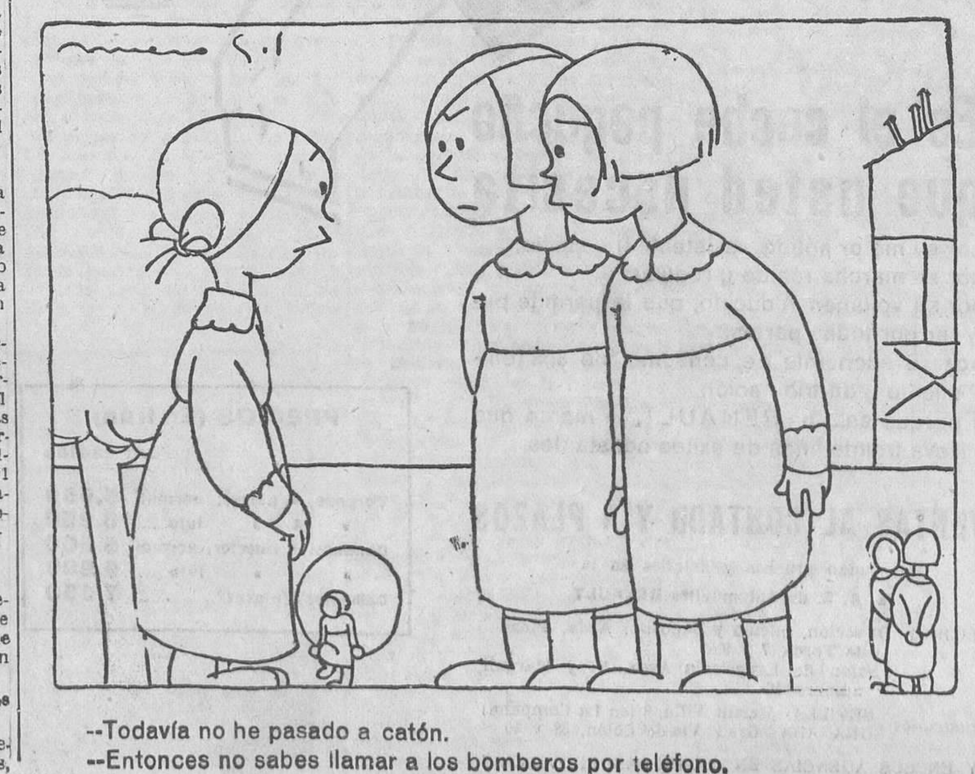
--Todavía no he pasado a catón. --Entonces no sabes llamar a los bomberos por teléfono.

«Solo puede ser visitado por los médicos que le asisten y un ayudante de los mismos.»