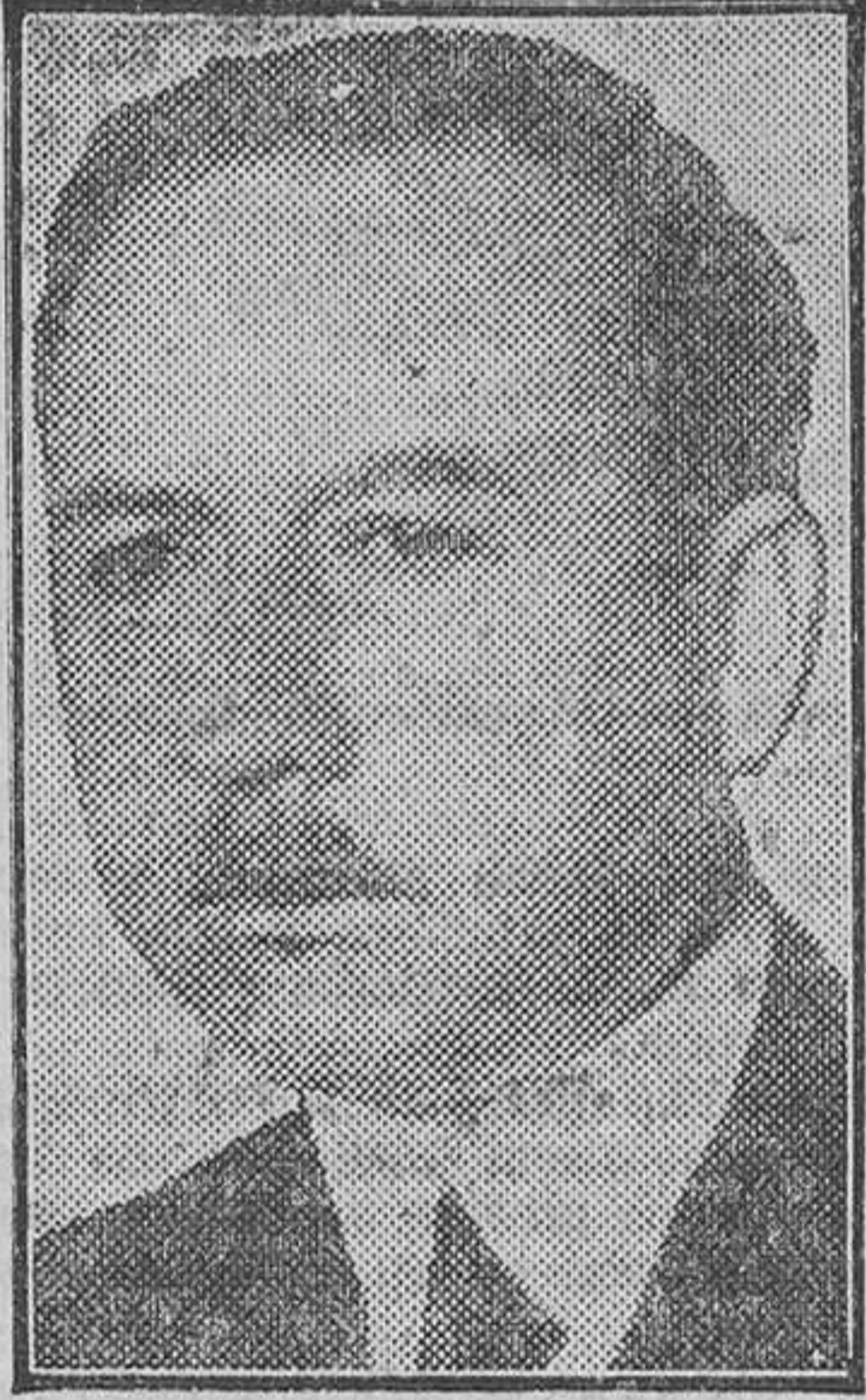
El coronel Adalberto Tejeda, gobernador de Veracruz al producirse la sublevación