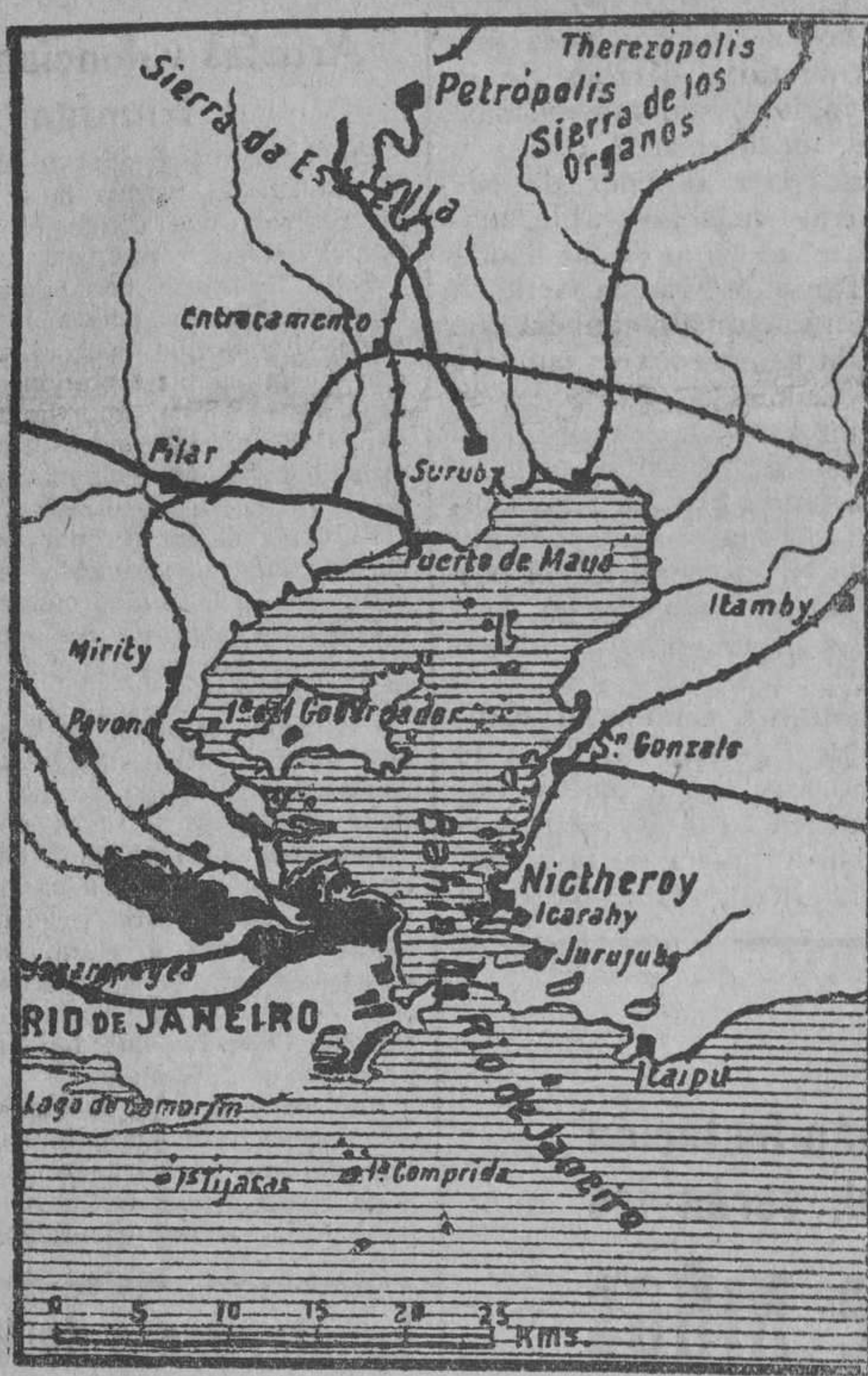
Sitio donde amará el "Plus Ultra"