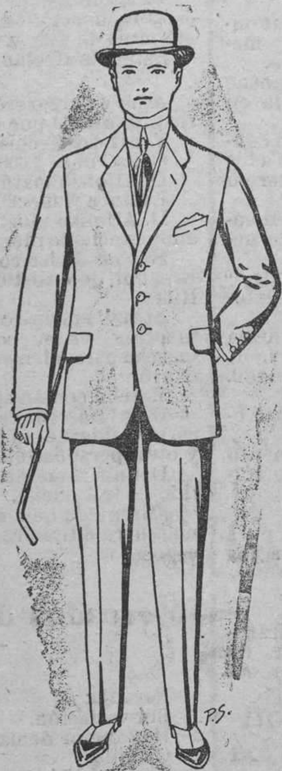
Trajes de cheviot, patén, etc. De ptas. 17'50 á 70