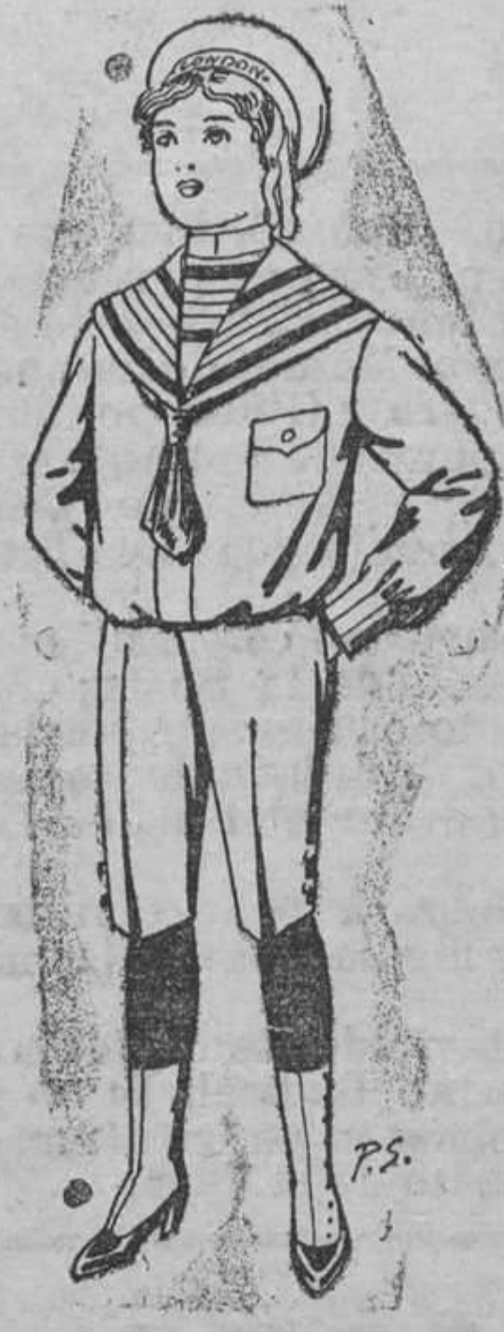
Trajes en azul ó negro, para niños de 4 á 9 años De ptas. 10 á 26