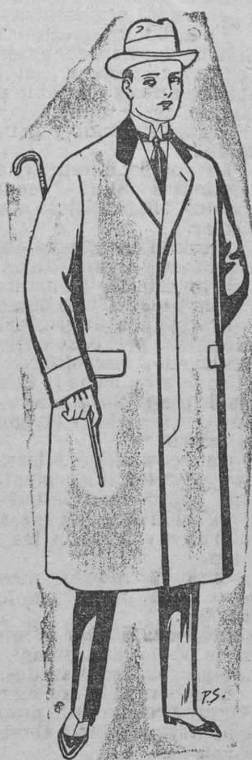
Gabanes de patén, cheviot ó melton De ptas. 25 á 100