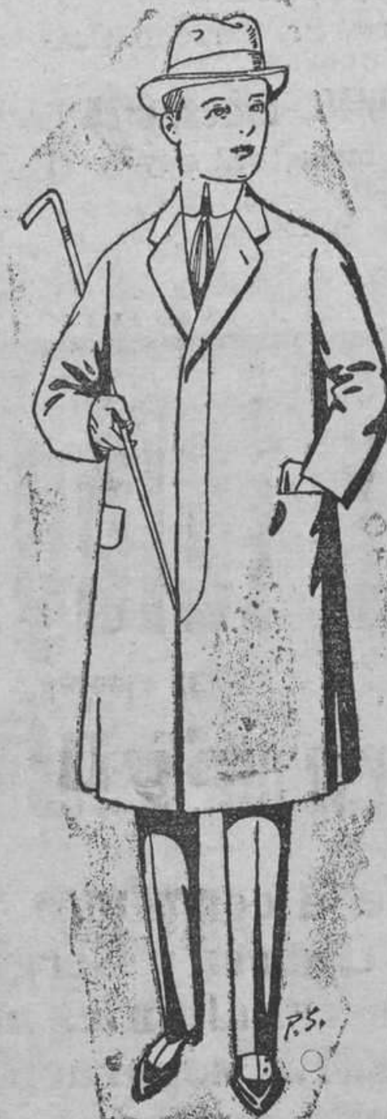
Gabanes de lana para jovencitos de 10 á 16 años De ptas. 14 á 50