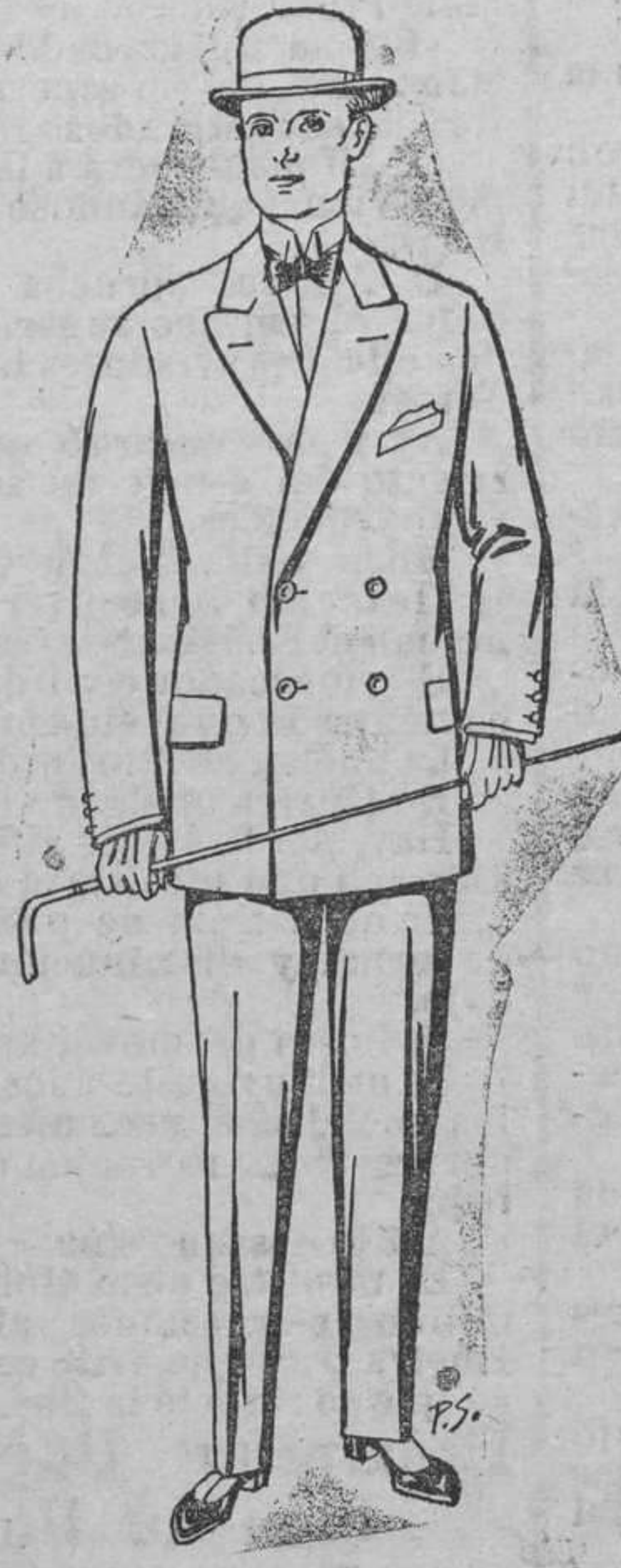
Trajes de patén, cheviot, etc. De ptas. 25