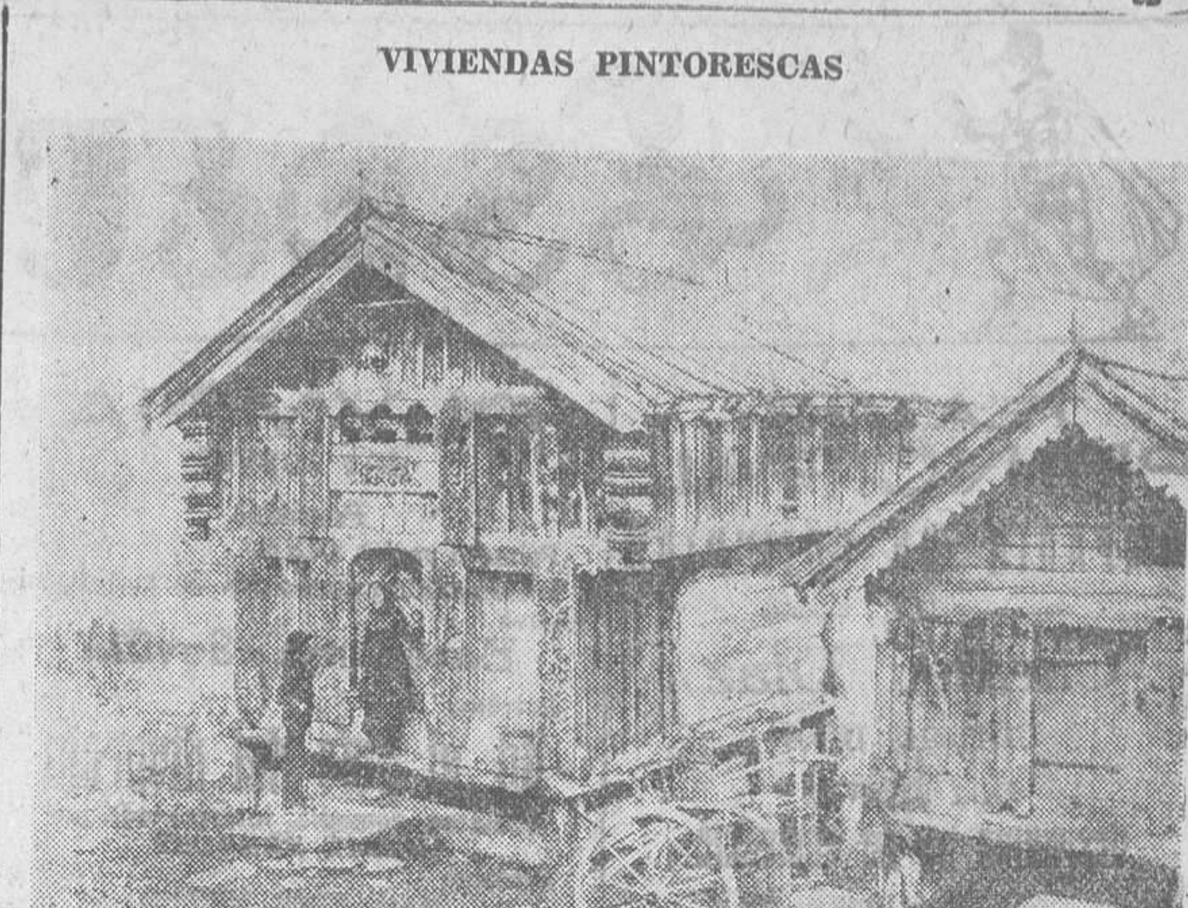
Al Oeste de Oslo, en el corazón de Noruega, sorprenden aún al visitante gran número de viviendas construidas con madera esculpida, las que datan del tiempo de los vikingos

Se reitera la convocatoria publicada con fecha 17 del actual y se encarece a todos los maestros asociados y no asociados para que asistan personalmente a la junta general extraordinaria de la Asociación provincial, que tendrá lugar el próximo día 23 (domingo), a las nueve de la mañana, en la Escuela Normal de Maestros,