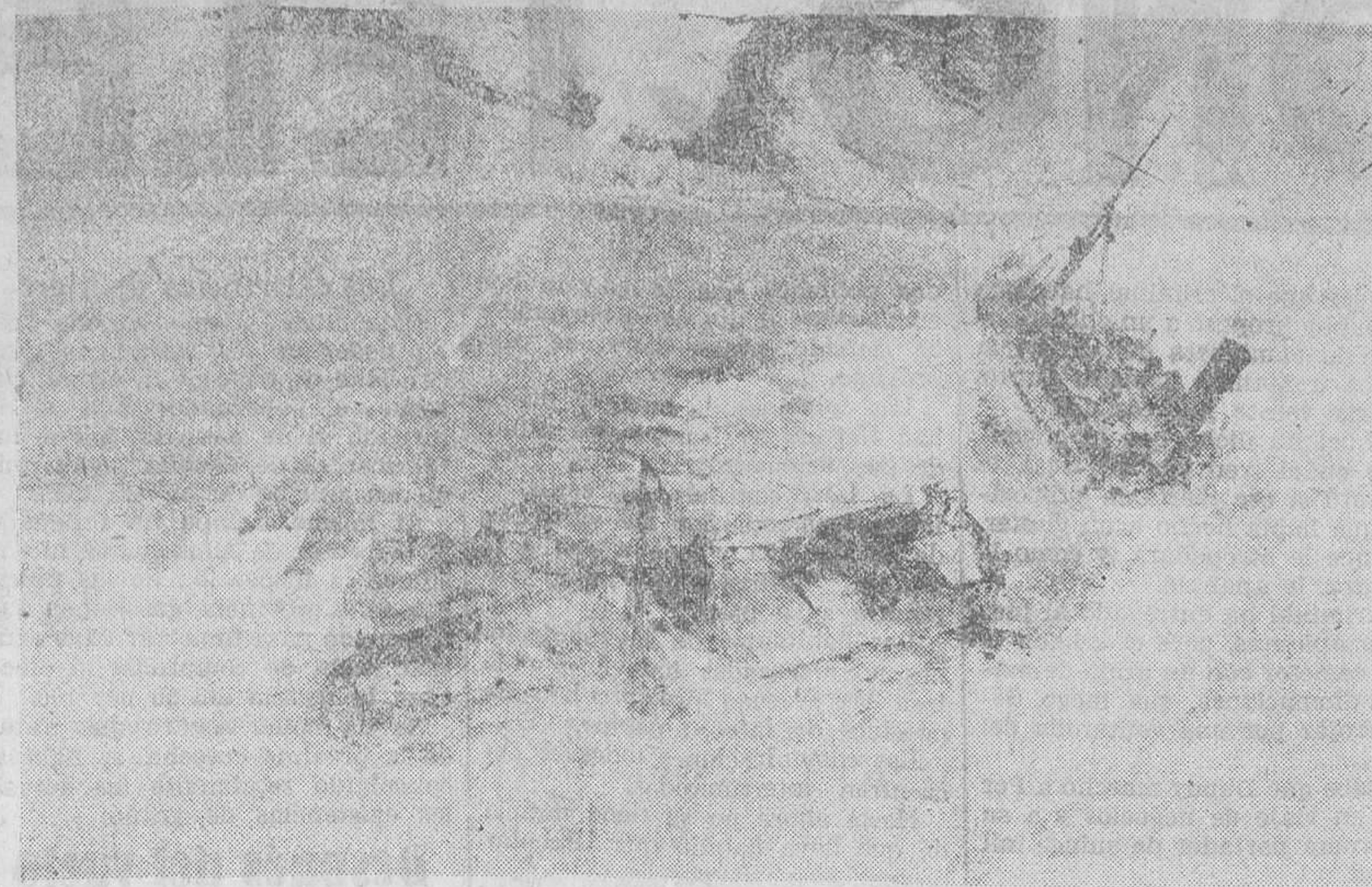
En el mar Báltico fué cortado en dos, por un bloque de hielo a la deriva, el vapor «Baltara»