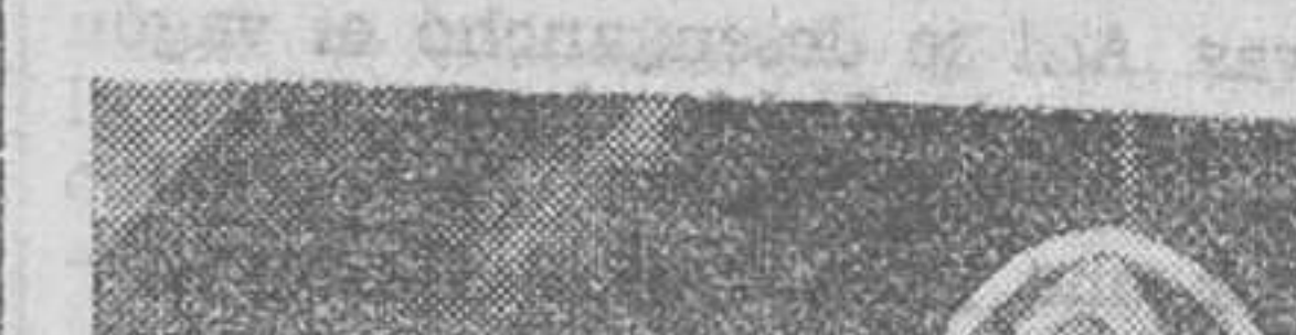
El joven Sultán de Marruecos, ha visitado el territorio del Protectorado español, tributándose los honores propios de su jerarquía