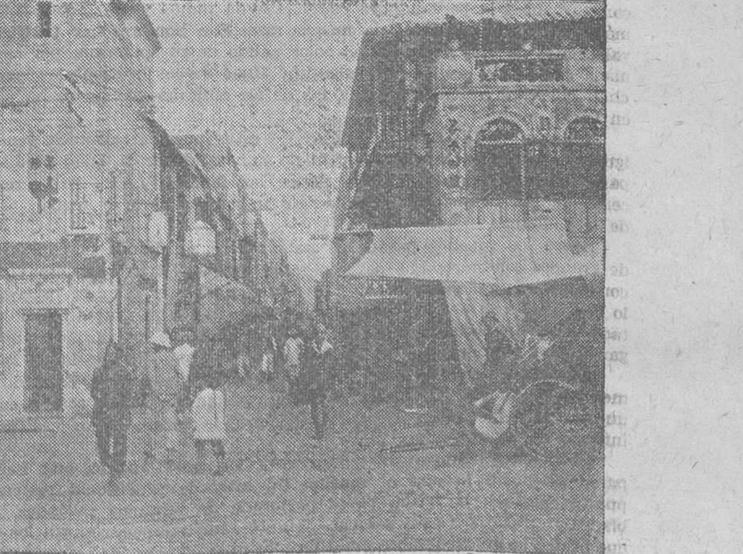
Calle principal de Hong-Kong

porvenir de la República china y de la liberación de otras naciones-hormigueros pertenecientes a este mundo extremadamente viejo. ¡Pueblos de Asia!... Pueblos eternamente siervos, que en su historia de miles de años no han vivido ni una hora la vida de la libertad, siendo los primeros en considerar la democracia, algo absurdo, opuesto al ritmo de la existencia; pueblos que únicamente son virtuosos cuando tienen miedo a alguien, y si no ven la corrección inmediata olvidan todo respeto, mostrando una insolencia de escolares sublevados. ¿Cómo llegarán nunca a ser