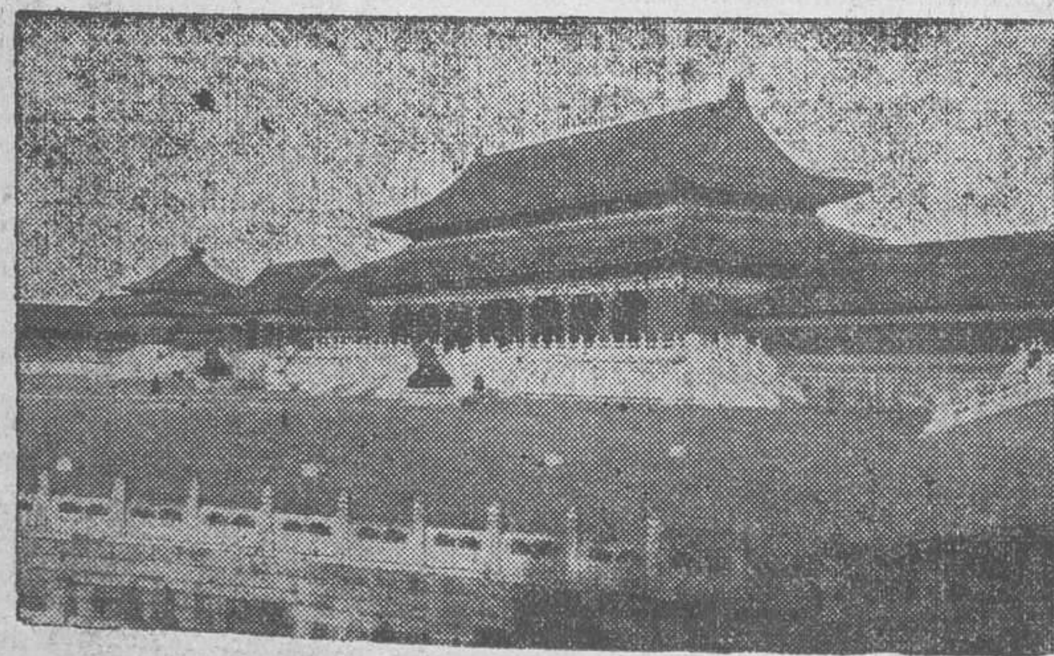
Pekín: Una vista de la Ciudad Imperial

dos dragones deslizándose entre ramajes complicados. También son de rojo y de oro las grandes columnas, y estos dos colores imperiales se repiten en el adorno de los muros, dando a todo el salón una visualidad que hace recordar las cintas de la bandera española, agitada por el viento. Sobre pedestales quebrados por los golpes más que por los siglos, se ven unos vasos maravillosos de bronce verde, con adornos de oro pálido profundamente rayado. Fueron soldados japoneses los que en 1900 rascan con sus cuchillos-bayonetas esta capa de oro, para llevarse el precioso