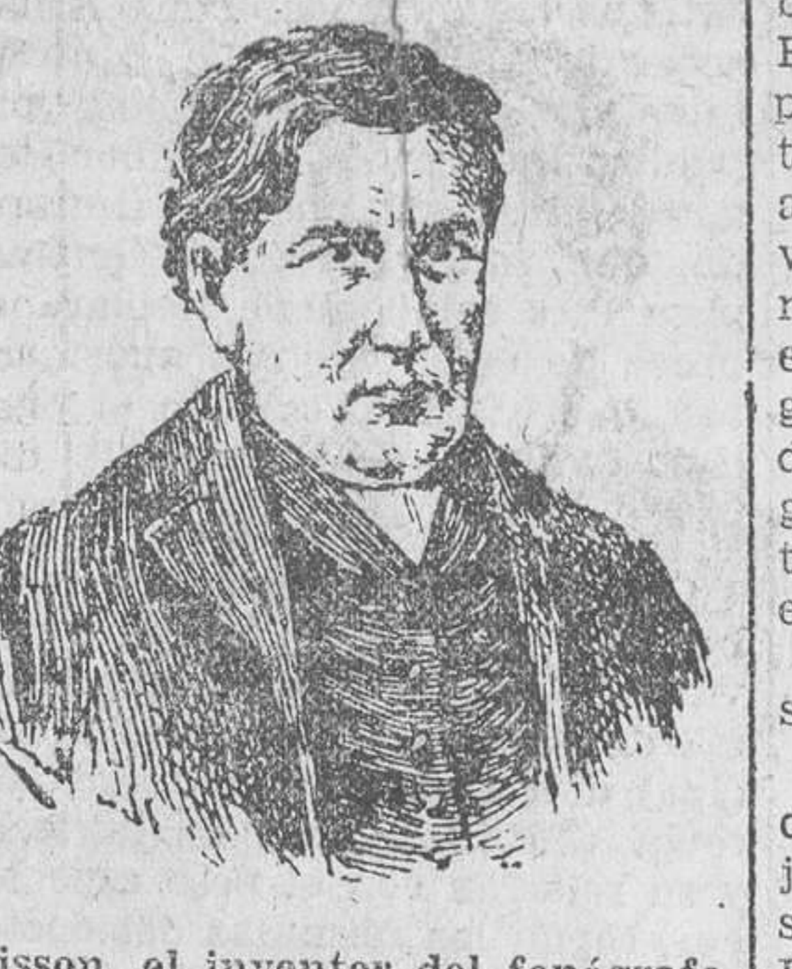
Edison, el inventor del fonógrafo

Hoy hace medio siglo... Entre las novedades e inventos presentados a la Exposición Universal de París, en 1878, produjo el tan grande como justificado asombro el fonógrafo, uno de los descubrimientos que habían de immortalizar a su inventor, el sabio norteamericano Tomás Alva Edison. La voz humana, ro obstante el timbre cavernoso y a menudo