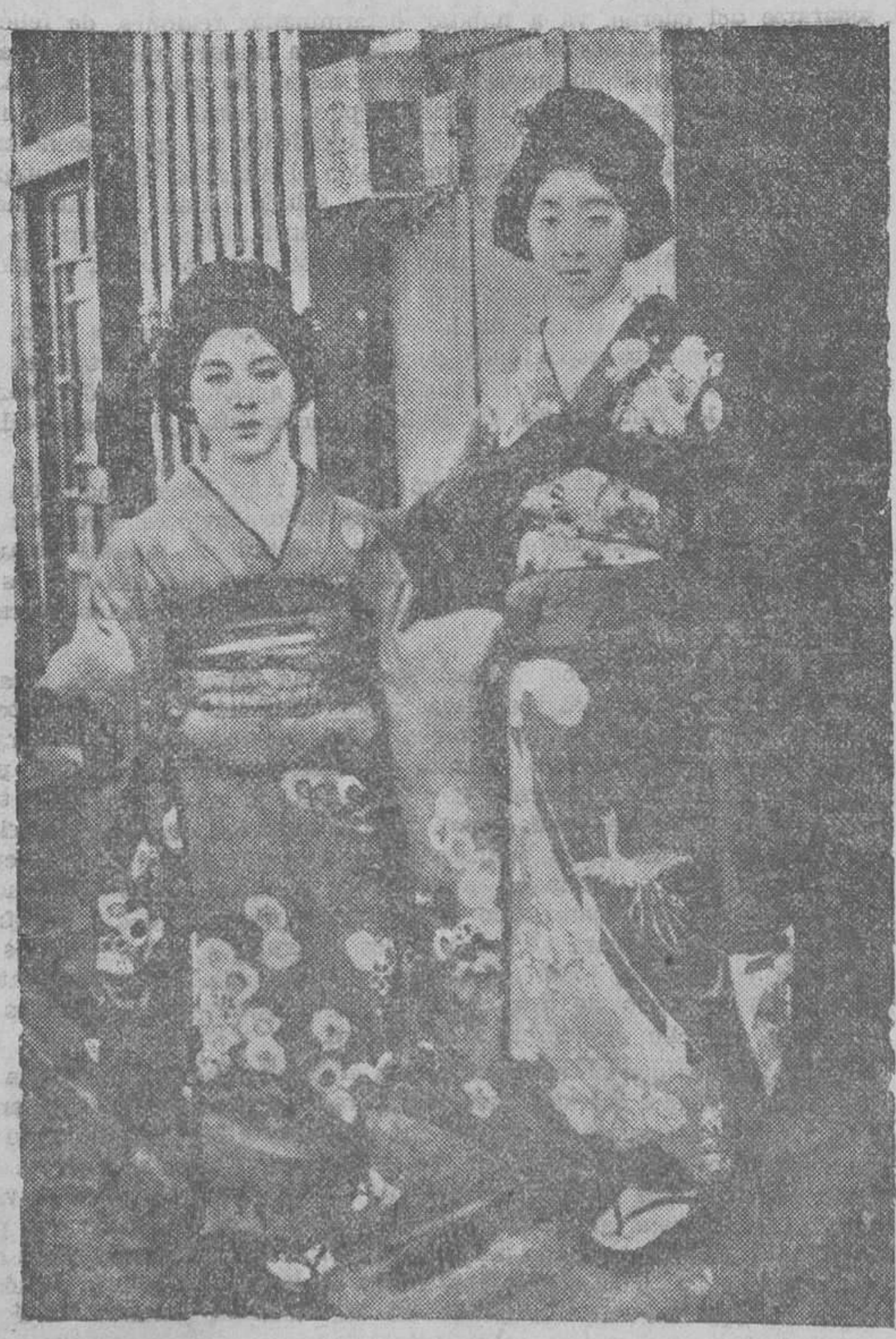
Fokio: Geishas servidoras de una casa de té

El Gobernador civil, satisfecho del comportamiento del jefe de Vigilancia y de sus subordinados, les agradece la colaboración, les estimula y se propone premiarlos para mejor servir así los intereses y las personas de esta importantísima provincia a sus cuidados fiada.»