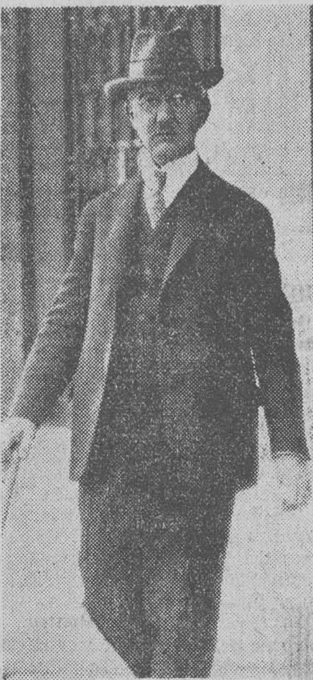
Berlin.—El doctor Schacht, director de la Reichsbank, que presidió la delegación alemana en la Conferencia de Peritos y cuya actuación está siendo comentadísima

París.—Los diarios expresan cierta inquietud ante la situación financiera que atraviesa actualmente Alemania, y subrayan el hecho de que desde Enero último las reservas de oro y las divisas de que dispone el Reichsbank han disminuido en más de mil millones de marcos, lo que atribuyen a la política cada día más extraña del doctor Schacht, que con sus actitudes intransigentes obliga al Banco a desprenderse constantemente de valores depositados en diversos establecimientos de crédito extranjero.