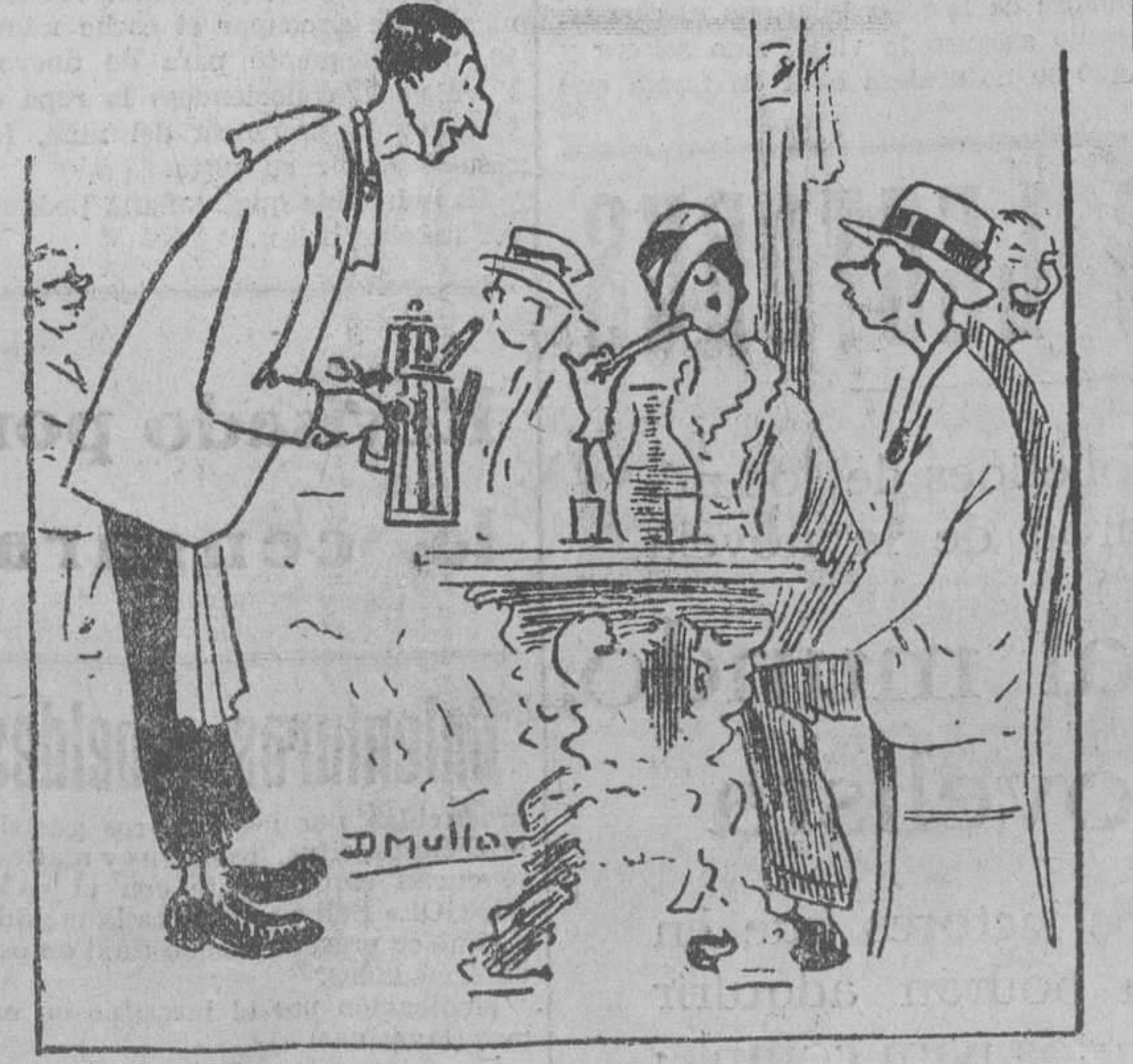
—¿Solo o con leche? —Mira, Robustiano, tómalo con leche, que va muy bien con el traje.