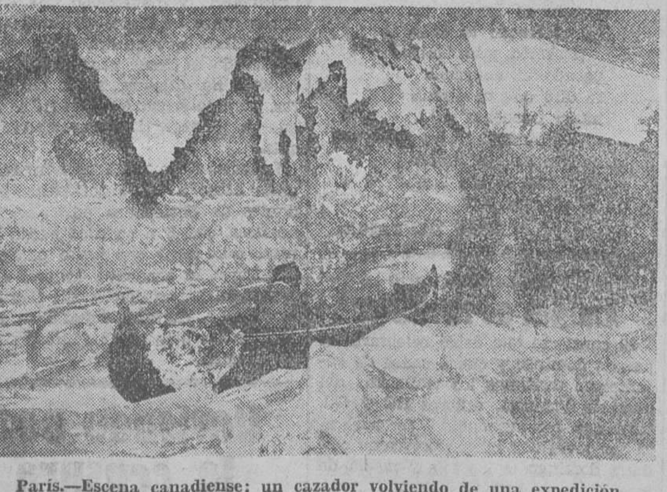
Paris.—Escena canadiense: un cazador volviendo de una expedición