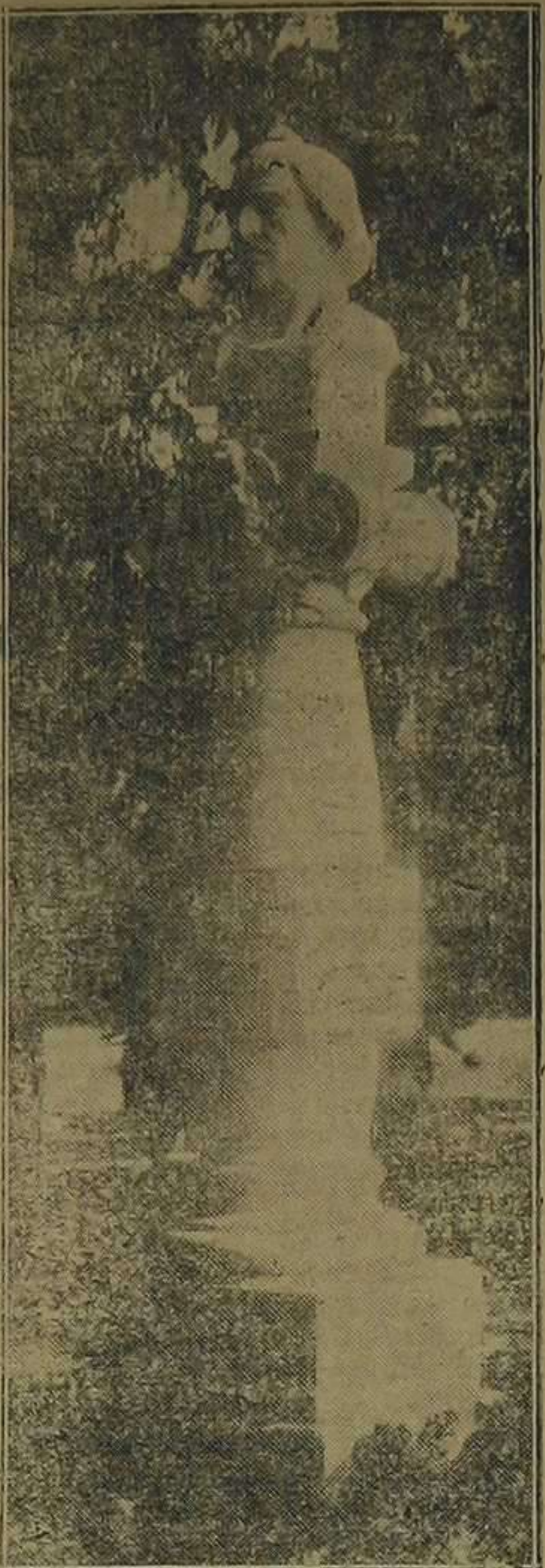
Monumento de Luis de Santángel, inaugurado este verano en la Alameda, plantio de la derecha.

Luis de Santángel, el mayor ciudadano de Valencia, escribano de ración del rey don Juan, el segundo de Aragón, y hombre muy acaudalado por sus múltiples negocios, algunos de los que radicaban en este reino, fué padre de mosén Luis de Santángel el menor, caballero, al que ya en 1475 el rey, por su honradez y probidad, y deseando tener personas hábiles e idóneas, habiendo vacado el oficio de receptor del dinero del antiguo patrimonio en el