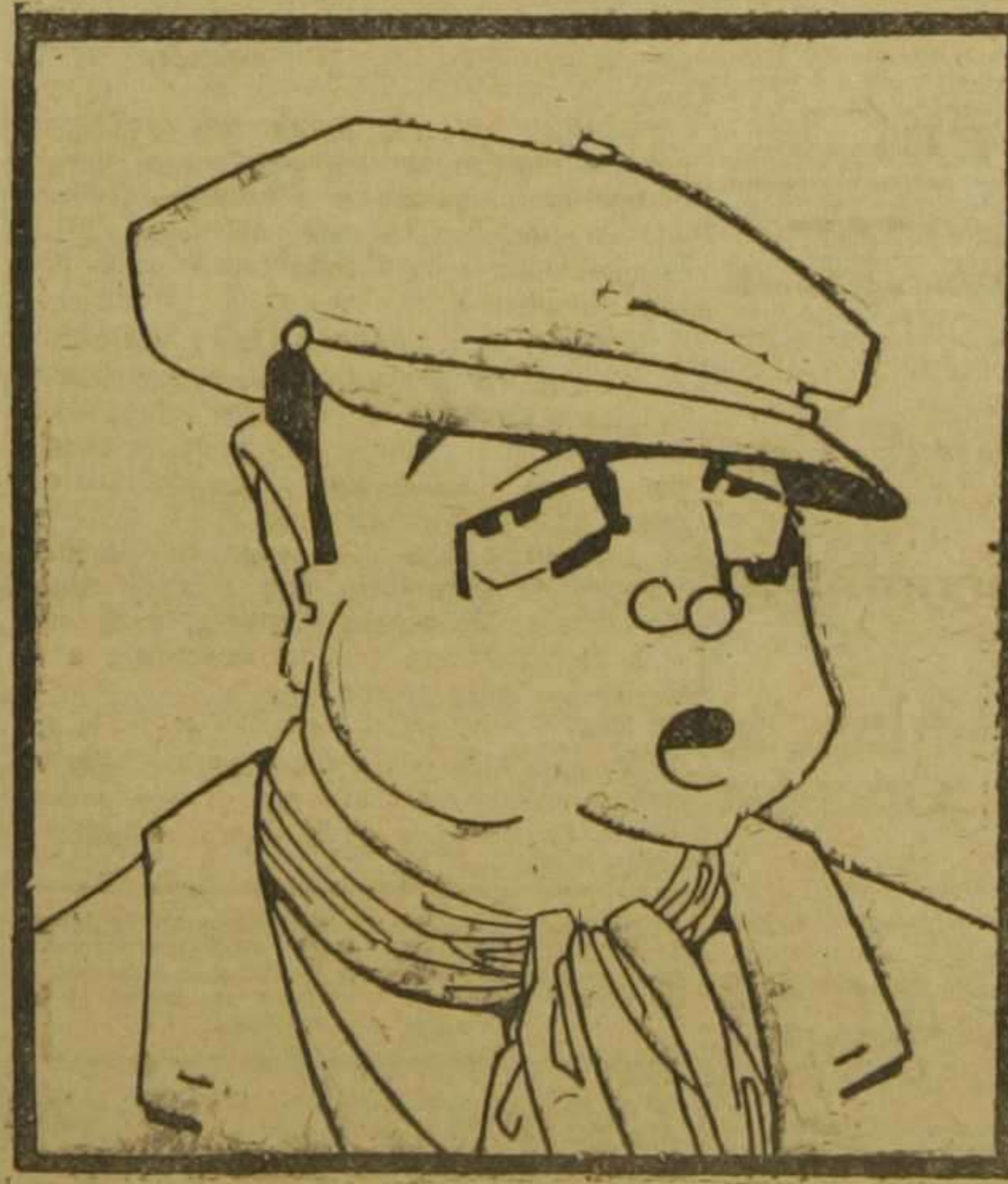
Excmo. Sr. D. Salvador Seguí, que al frente del Gobierno de España rige los destinos de la nación.