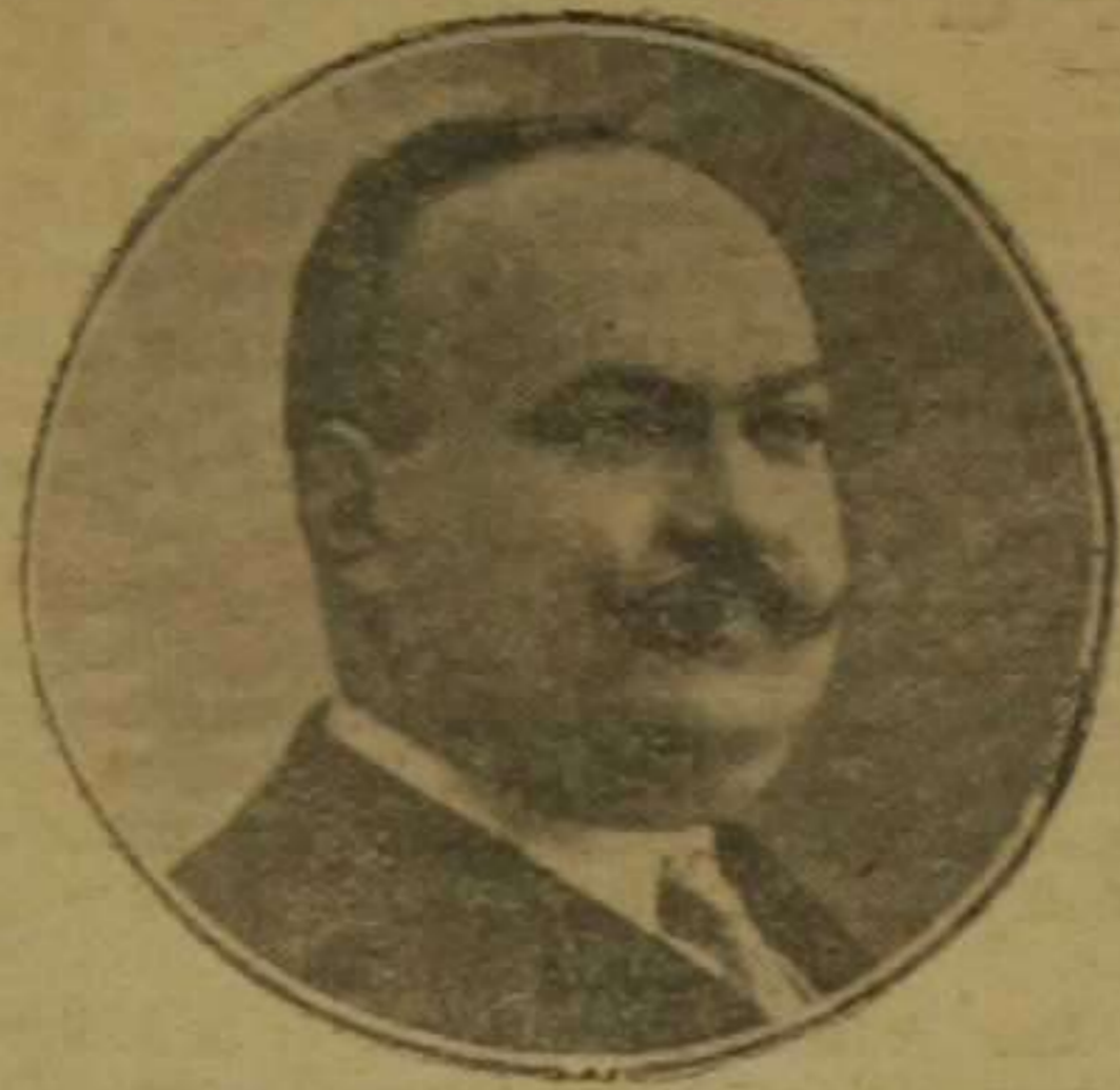
Excelentísimo señor don Adolfo Bonilla y San Martín