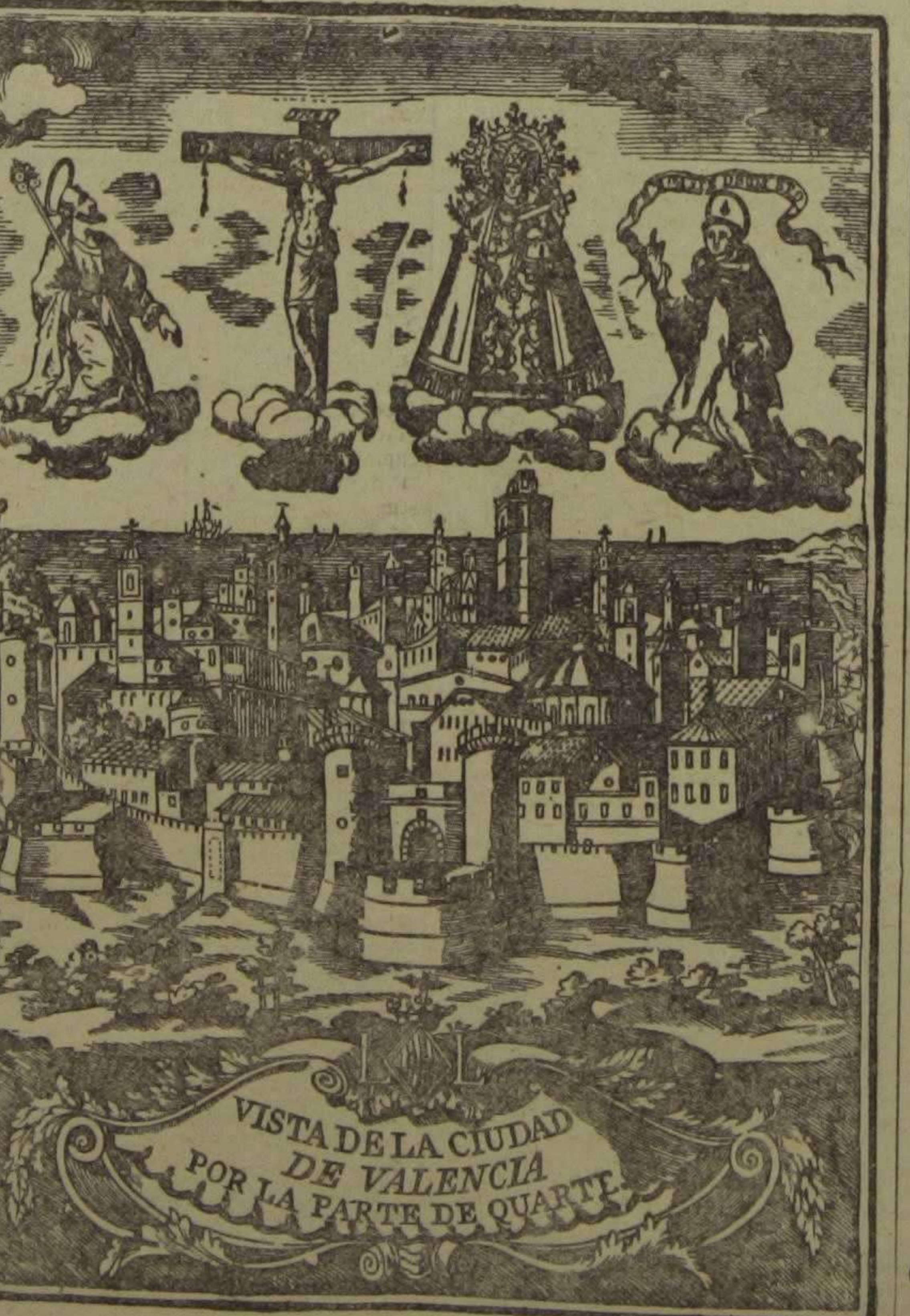
VISTA DE LA CIUDAD DE VALENCIA POR LA PARTE DE QUARTE. Grabado en madora por José Martí, 1867

En el precíós cansoner publicat el any passat per el doctor En Francés Almariche Vázquez, s'inclouen tots el goigs coneguts fins ara, en llahor de la Sacratissima Verge dels Desamparats, Patrona de la ciutat y reyalme de Valencia. A continuació reproduim els que s'cantaven en la Capella dedicada a nostra Verge en l'antich convent de Pares Agustins de Barcelona, com així mateix els que s'canten en Girona y en la parroquial iglesia de Santa María del Mar, de Barcelona. De afligits y atribulats sou, Verge, consoladora: Socorreunos, gran Senyora, Mare dels Desamparats. Los Sans clamavan al cel