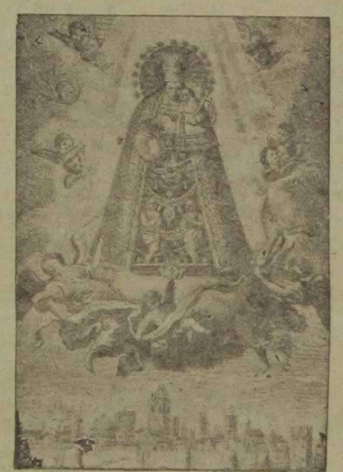
La Señera de Valencia.—Grabado de cañonell, Siglo XIX

per la salut esperada, quant fench enviat Gabriel, y vos doná l'embaixada: Restarem molt consolats, quant vingué tan d'xosa hora; Jesús, ver Sol de Justicia, en Vos tingué lo Orient, quedant vostra pudicicia entera sens detriment: Ell, que's llum dels desviats, de Vos nasqué, gran Aurora; Com sou Estrella del mar, quant Deu se mostrá patents, una estrella va guiar als tres Reis del Orient: En Vos adoran postrats al que tot lo mon adora; Vostre Fill, ab gran victoria, triumfant resuscitá; ¿qui podrá dir quanta gloria a Vos se os comunicá? Motts quedaren aliviats, y Magdalena que plora; Acabaren sens dolor lo desterro en carn mortal, suspirant ab gran amor per la Patria celestial: Allí, per los desterrats pregau y sou intercesora; Com Vos sou Iris de pau, vostra imatge fench trobada en la gabiá de una nau, la tempestad sossegada: Se tenen per fortunats, tenint tal consoladora; Y per impuls molt divi la vostra imatge han portat en aquest convent sagrat del Para Sant Agustí: Ahoñ de cor humilliat demanau favors tot hora; Amparaunos, gran Princesa, Reyna de la terra y cel; defensau la gent opresa de nostre enemich cruel: Sempre y quant estam vezats, vos cridem per protectora; Socorreunos, gran Senyora, Mare dels Desamparats. Tornada Puig son nostra amparadora en totes necessitats: Socorreunos, gran Senyora, Mare dels Desamparats, Barcelona, 1850.