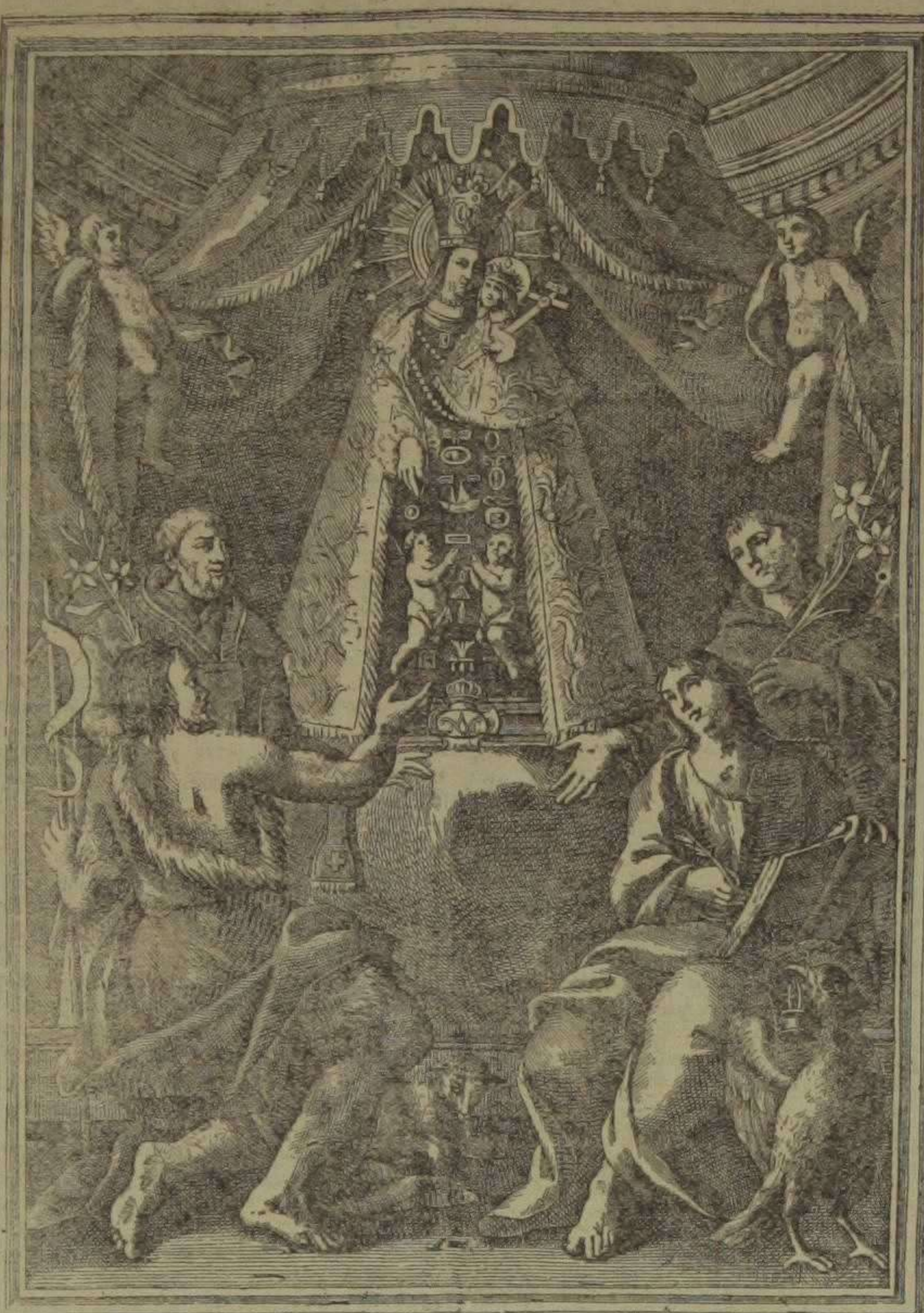
La Señera de los Desamparados. Anonima.—Siglo XVIII