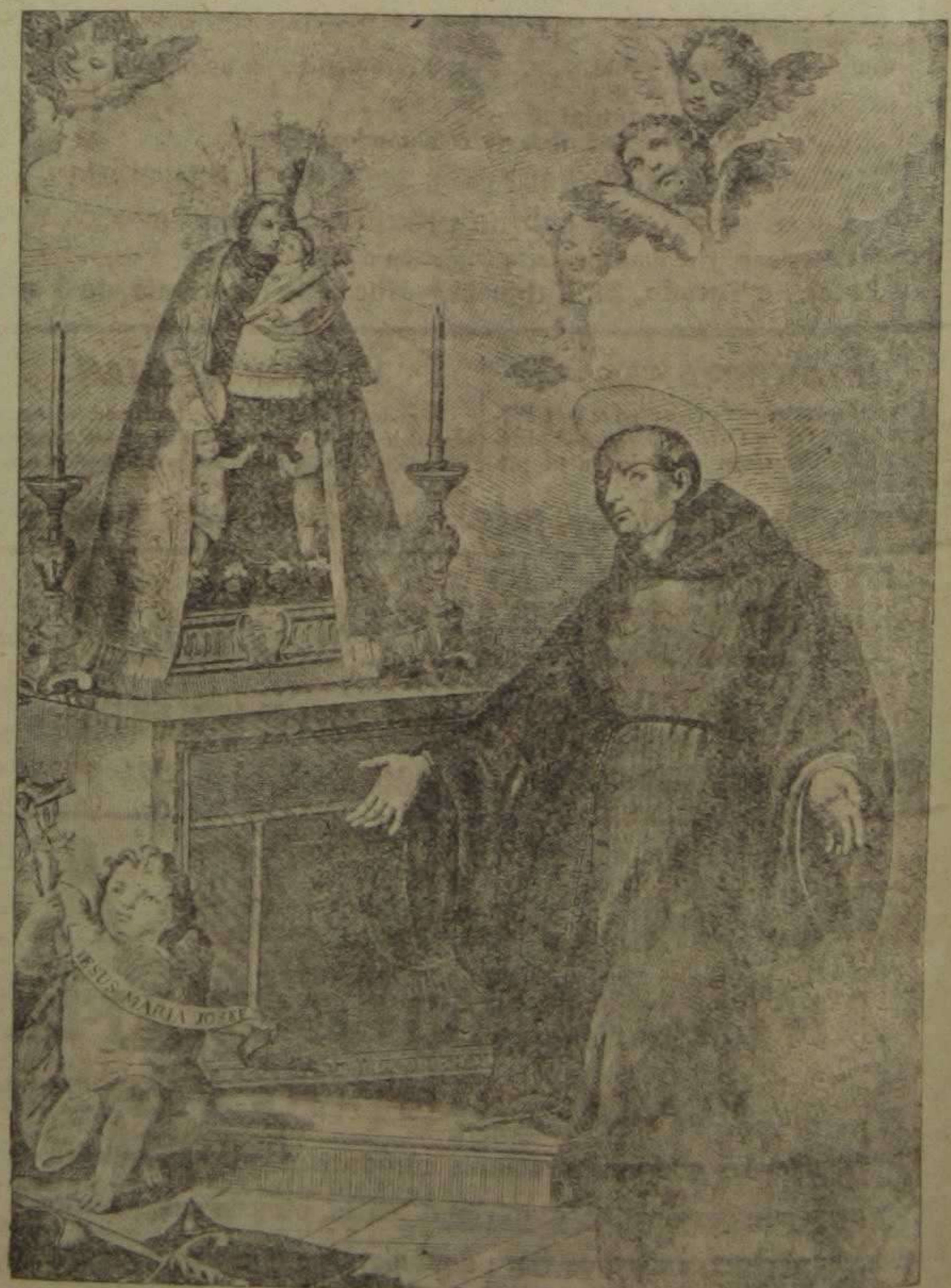
Imagen del Beato Gaspar Bono, devotísimo de Nuestra Señora de los Desamparados. De una estampa dibujada por don Francisco Brd, y grabada por su hermano don Manuel, en 1790

(2). Por instrumento público otorgado en 2 de Mayo, ante Jaime Estevan, notario del Cabildo Catedral.