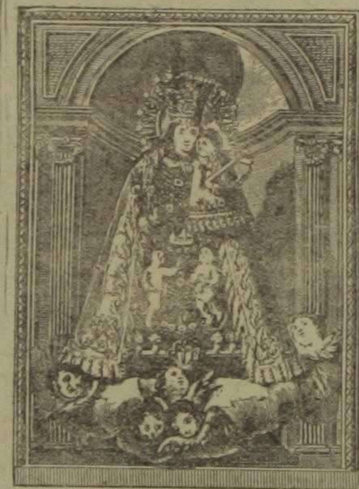
Estampa grabada por Julián Más, en 1829

Tanto los arcos en que se encuentran los tres altares y se abre la puerta principal, como las cuatro puertas rectangulares que con ellos alternan, fueron ya en un principio provistas de los adornos arquitectónicos que su estilo requiere y ostentaban tarjetones o cartelas con apropiadas inscripciones latinas. Entre estos arcos y puertas se construyeron ocho pilastras que desde el zócalo se elevaban, como ahora,