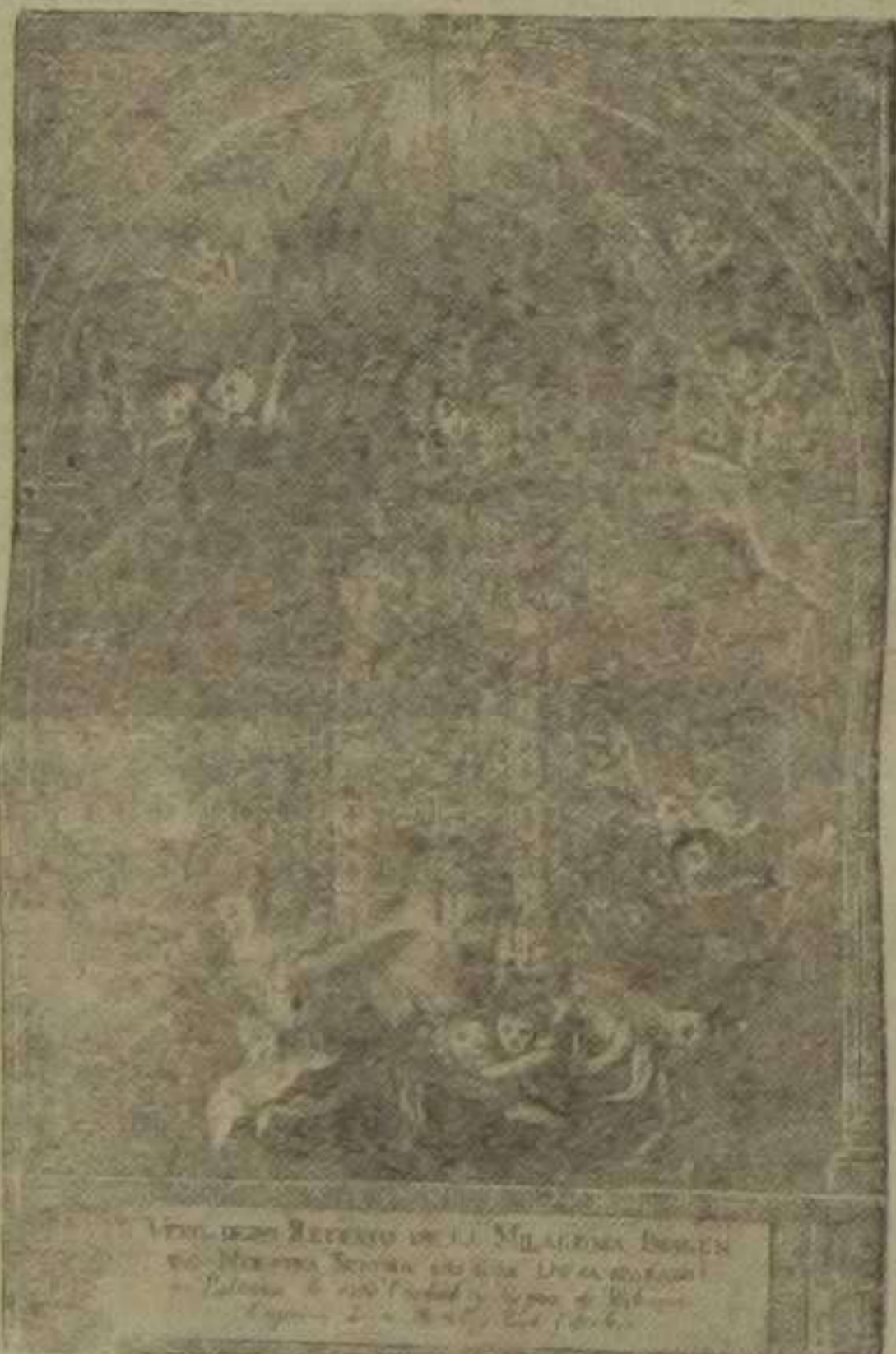
Estampa dibujada y grabada por Francisco Miranda, en 1811

Dignate acoger, ¡oh Madre! este ruego que a tus plantas deposita un luchador, que aunque el último se llama, no quiere el postrero ser en ofrecerte sus armas y pedirte las bendigas, para con ellas, tu causa defender hasta vencer o morir en la demanda, que aua la muerte, en tu servicio, es por victoria contada. Débiles mis armas son: mi pluma y cuartillas blancas y mas, ¿quién habla de flaqueza si tu mano las ampara? Con tu bendición, mi pluma será poderosa lanza que en las huestes del error abrirá brecha más ancha que abrió el soplo de Jehová del mar Rojo entre las aguas; si quieres, sabré esgrimirla cual fina y luciente espada, y certera, como flecha, subiendo al cielo cual águila, luminosa como estrella, fulgurando, en la batalla será mi apoyo más firme, será mi prenda más cara. Si ilumina mis cuartillas desde el cielo tu mirada, servirán de fértil campo para la semilla santa que la fe y amor cristiano allí siembre, y las palabras que a mi corazón tú envíes para que yo las esparza en la lucha por mi fé, por mi Dios y por mi Patria, reproducidas mil veces por las poderosas máquinas servirán para tu gloria, que solo a ese fin se estampan.