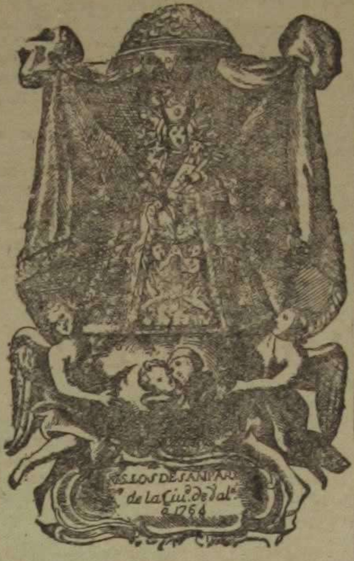
Grabado en cobre del artista valenciano Joaquín Fabregat

No se satisfizo la Cofradía con lo hasta entonces hecho; vela con pena que, para las necesidades del Culto, eran insuficientes las más indispensables dependencias del templo y que en éste eran modestísimos el decorado y ornamentación. Firmes en el propósito nobilísimo de corregir todas estas deficiencias, en 28 de Abril de 1682 compró al Arcediano la única casa que le quedaba en la plaza de la Seo, y tres años después adquirió otra que con aquella y la Capilla lindaba, con lo cual pudo construirse por el pronto, una cómoda y espaciosa casa para el Capellán mayor, y más tarde, con subvenciones de la ciudad y limosnas de los devotos, un bien acondicionado Camarín.