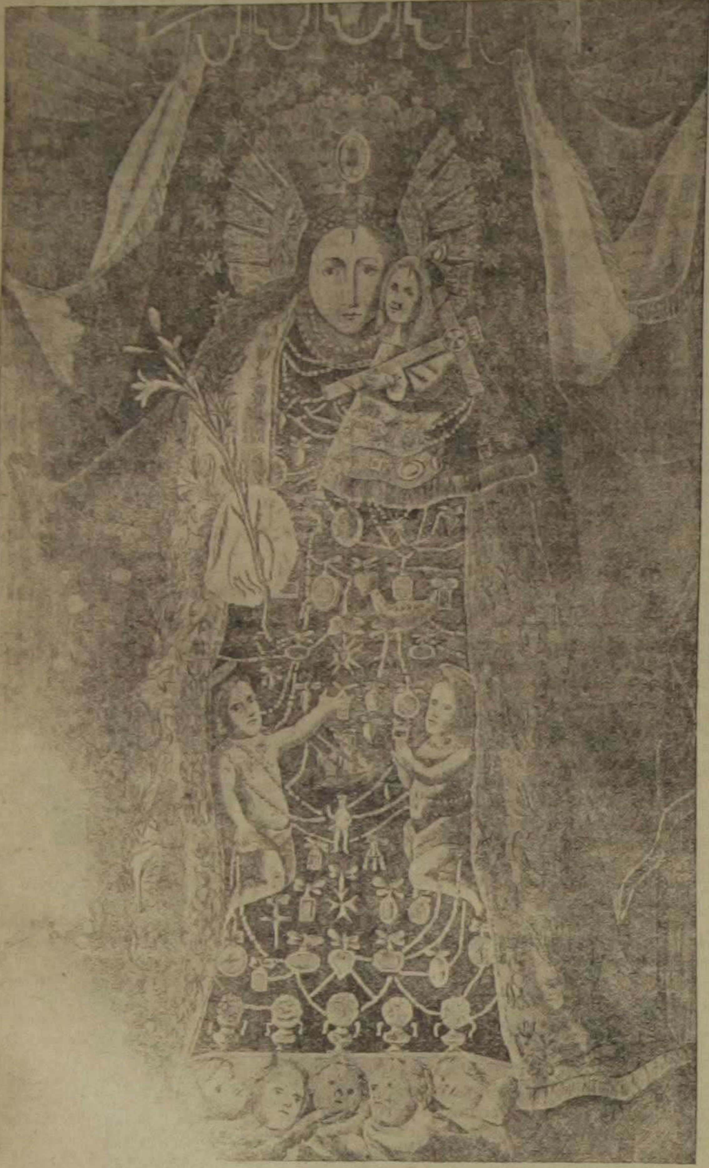
Antigua estampa de Nuestra Señora de los Desamparados. Dibuja por Raga y grabada por J. Bautista Ravanals, en 1714. Es la de mayor tamaño de todas las conocidas.