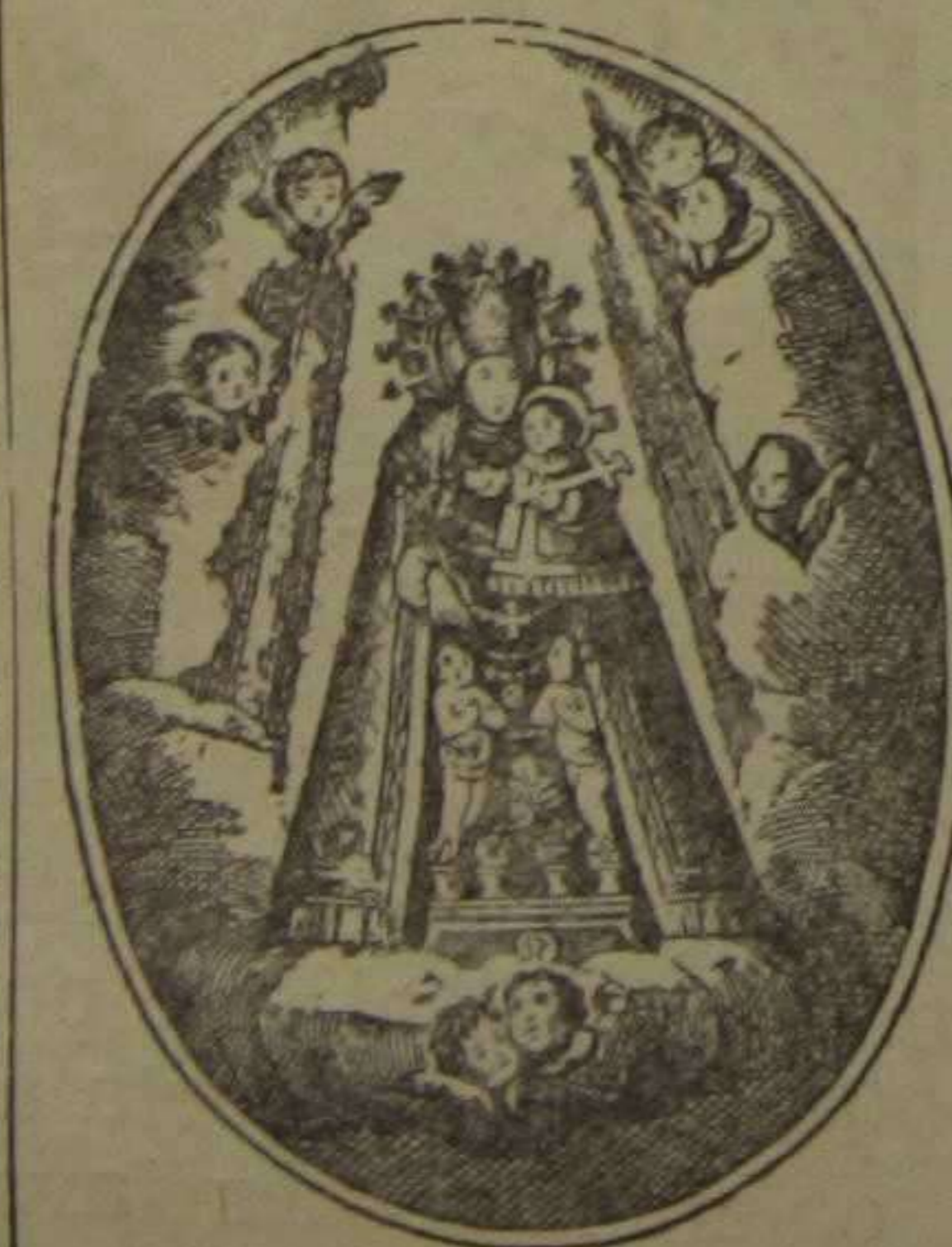
Estampa grabada por Jordán. Siglo XIX

Proveyóse esta Capilla de los vasos, objetos y ropas necesarios para el culto; colocándose ante la Imagen cuatro lámparas, que por la devoción de los cofrades ardían casi constantemente; celebrábase en ella con frecuencia el Santo Sacrificio de la Misa