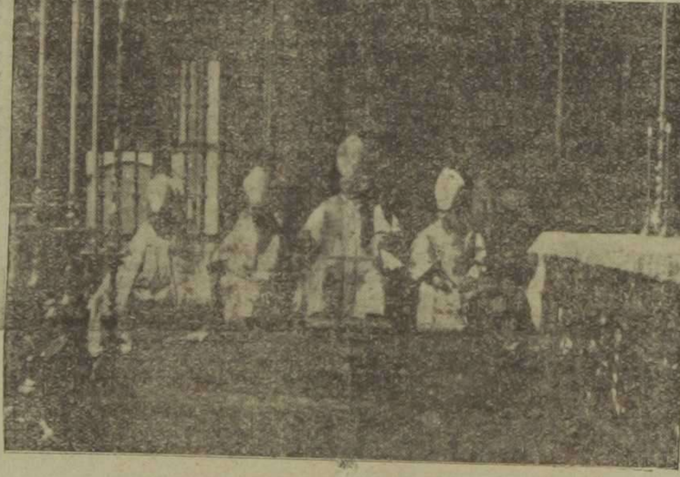
La Misa de pontifical.—.