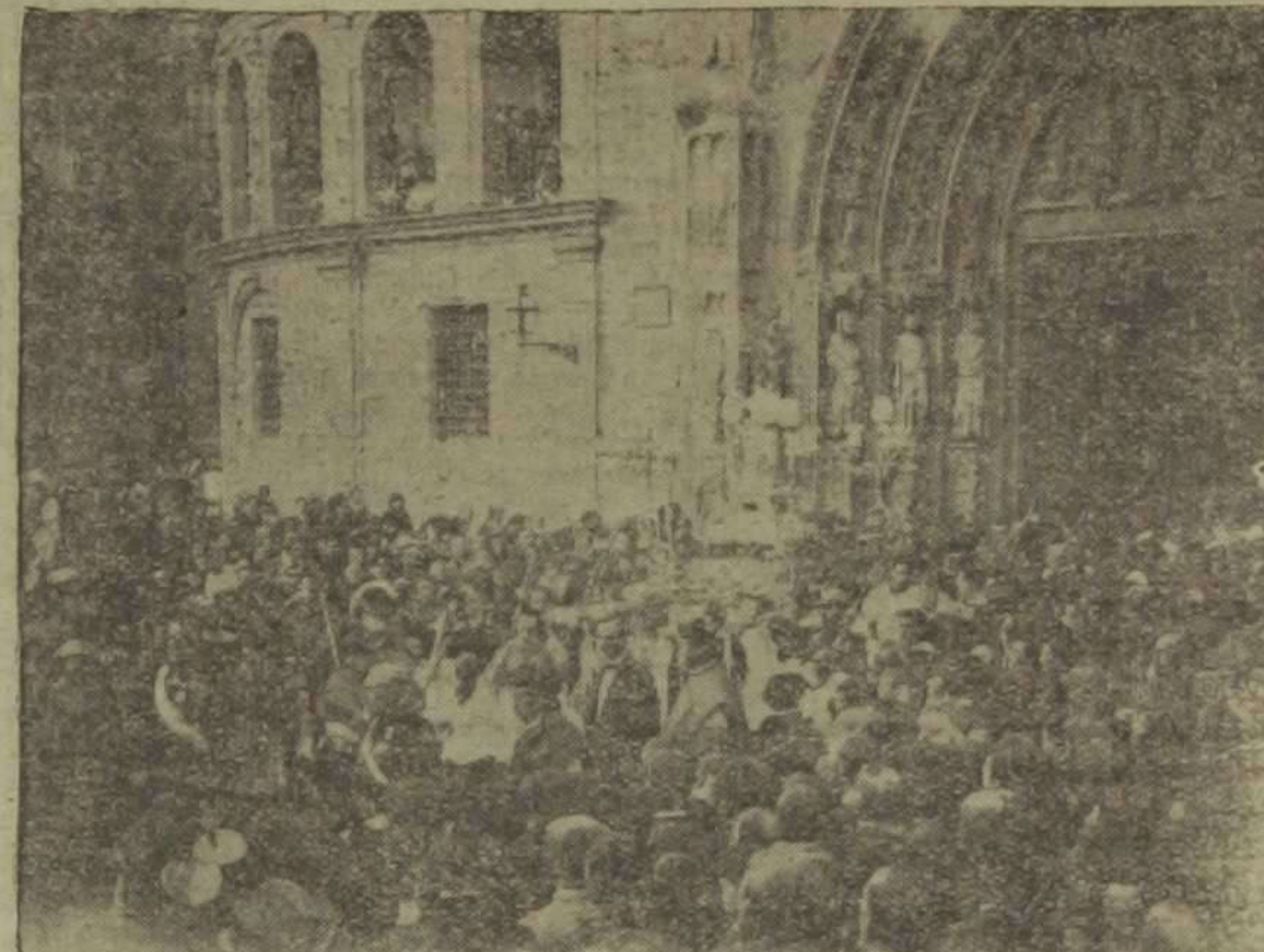
Salida de la imagen de San Vicente por la puerta de los Apóstoles.

sus respectivos siltales los reverendísimos Prelados que se encuentran en Valencia.