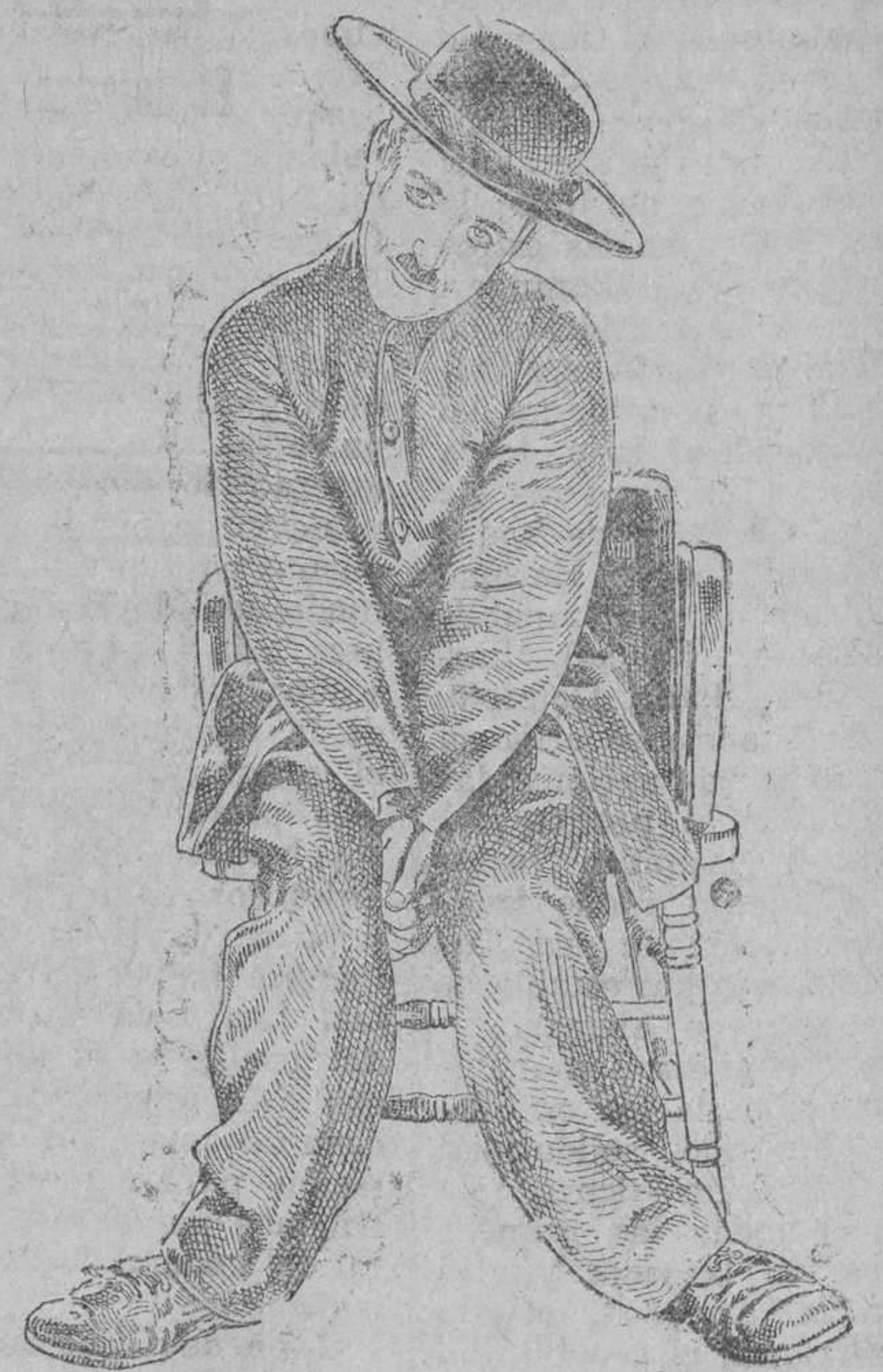
CHARLES CHAPLIN «CHARLOT» en