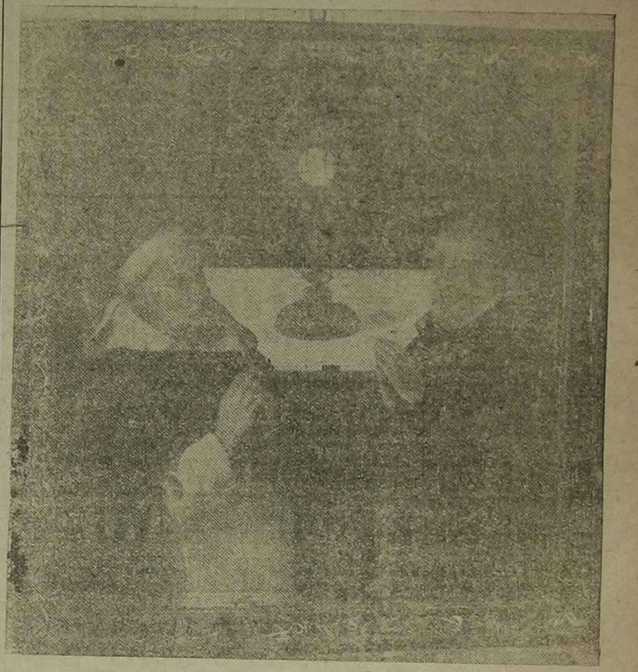
Lienzo descubierto en Villarreal, con las pinturas de los fundadores del convento de Monjas Dominicas, del Corpus Christi, de la calle Mayor de Santo Domingo.

El año 1638 entraron solemnemente en Villarreal estos ilustres fundadores y con ellos los nobles valencianos y profesores universitarios que se les habían reunido en las afueras de Valencia.