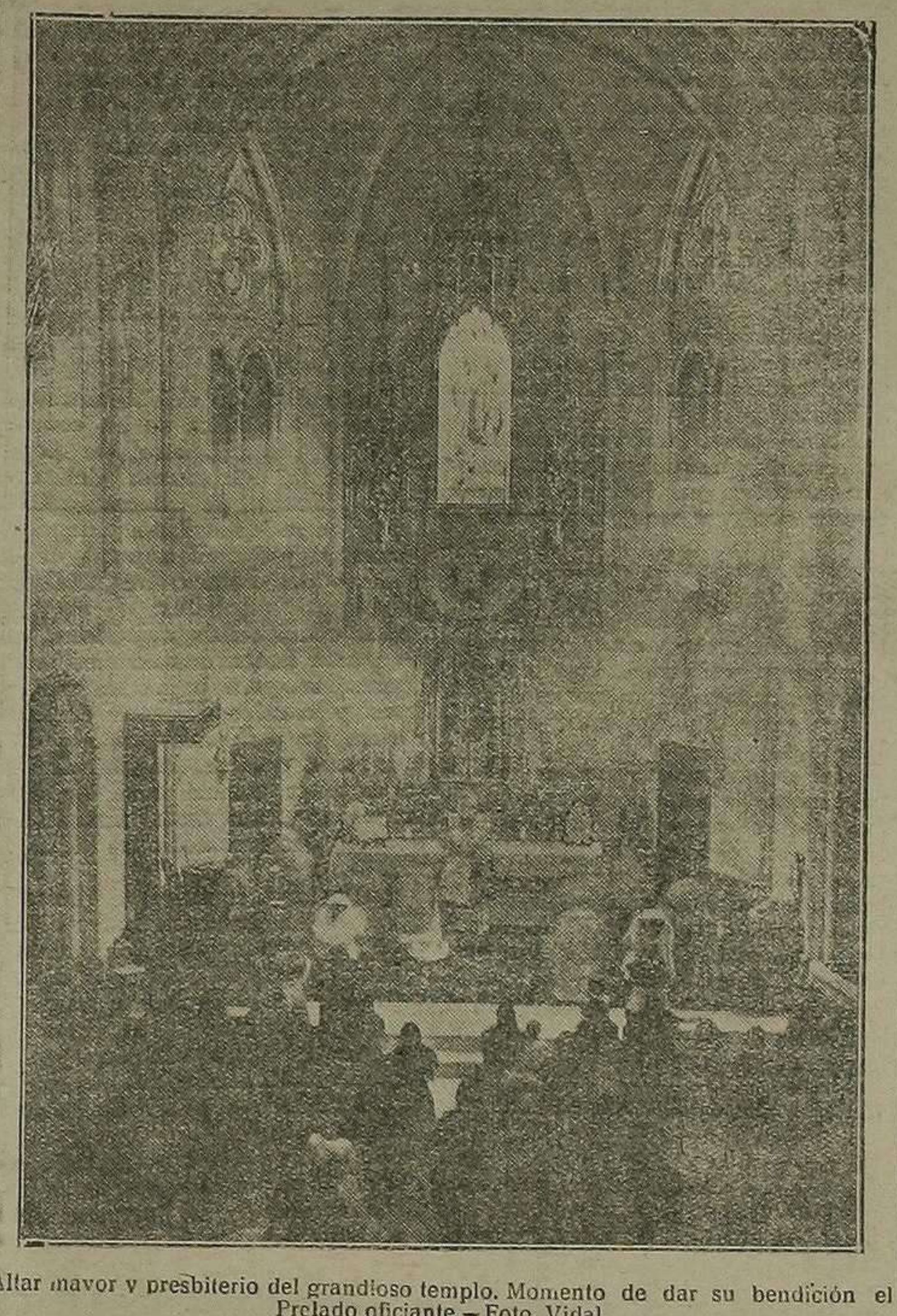
Altar mayor y presbiterio del grandioso templo. Momento de dar su bendición el Prelado oficiante.