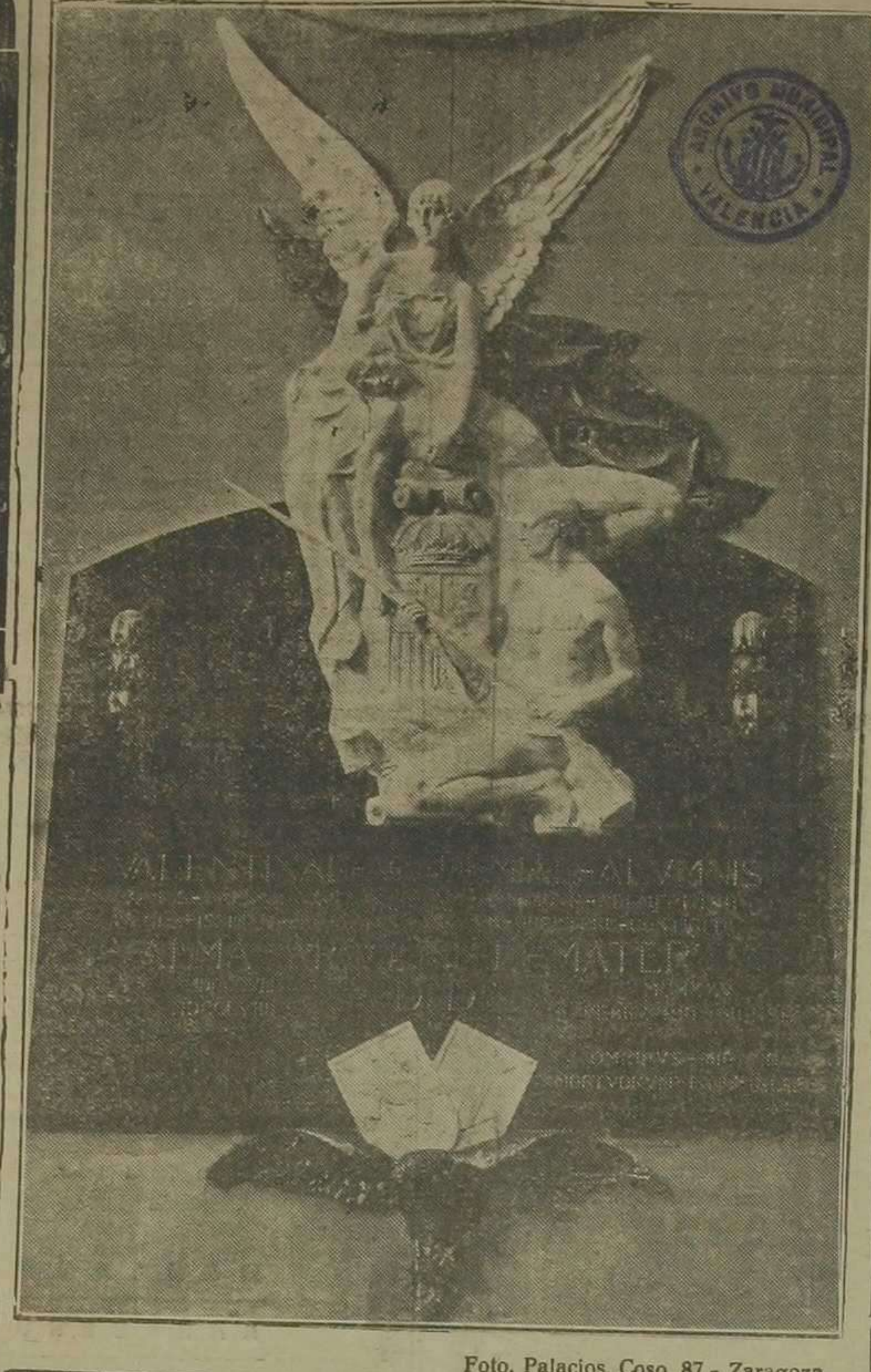
VALENTINAE - ACADEMIAE - ALVMNIS QVEIS - CAESARAVGVSTAE - DVM - OBSDIONE - PRIMERETVR CLARISSIMAM - PRO - PATRIA - MORTEM - OPPETERE - CONTIGIT ALMA - ARAGONIAE - MATER M.DCCCXVIII D. D. M.CMXXV M.DCCCXVIII FEBRVARIO-MENSE OMNIBVS - MIRANDA MORTVORVM - IMMORTALITAS

Lápida conmemorativa colocada en la Universidad de Zaragoza, en honor de los estudiantes valencianos que ofrendaron sus vidas en dicha ciudad en holocausto de la independencia de la Patria.