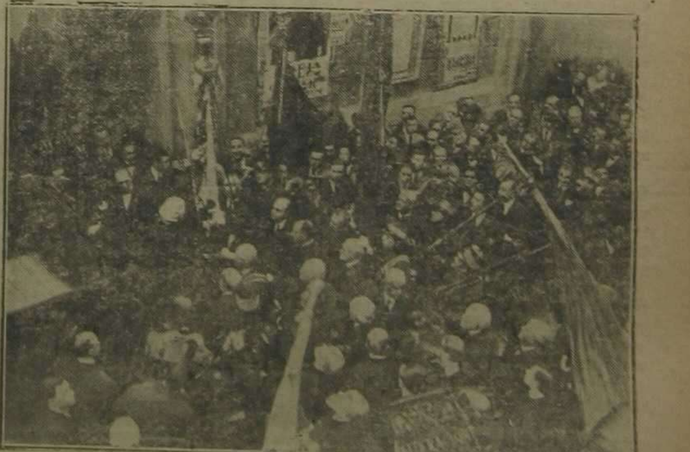
Llegada de la "Senyera" a las Casas Consistoriales.

Ambas banderas saludaron a la enseña del Conquistador, mientras timbales y clarines dejaban oír los acordes de la Marcha de la Ciudad.