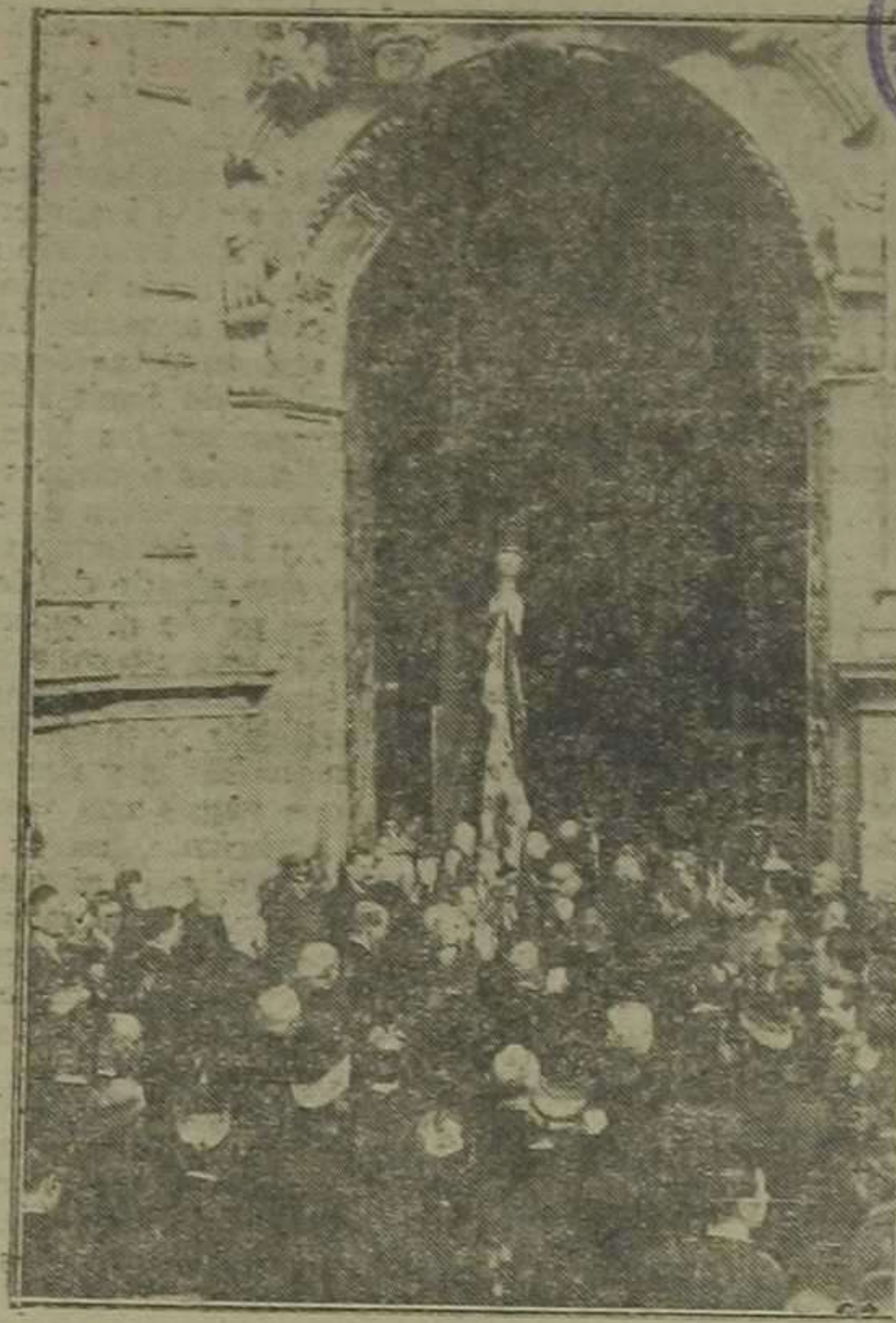
Entrada de la "Senyera" en la Catedral.

La "Senyera" en Valencia Recibimiento triunfal