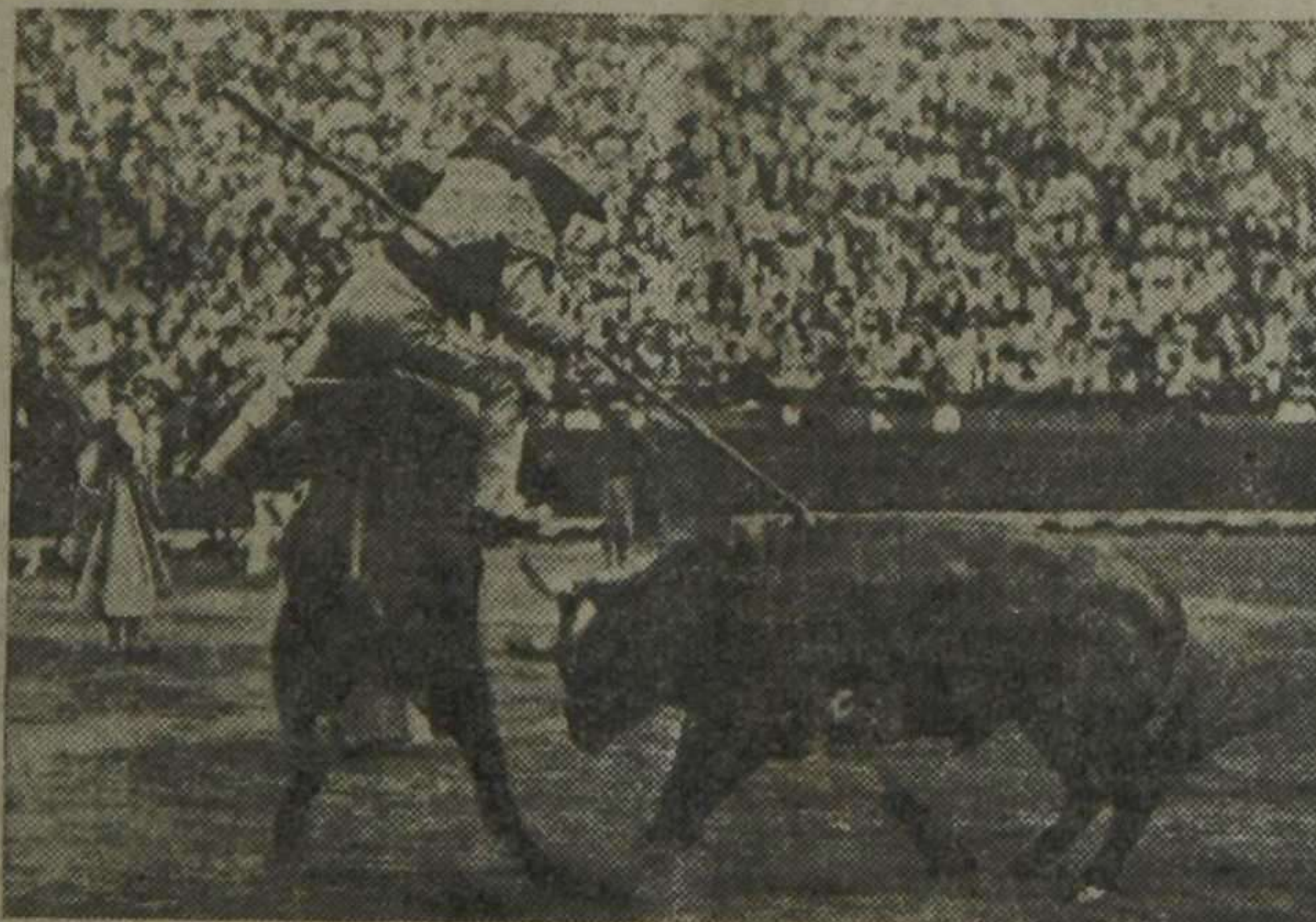
Una buena vara de Crespito