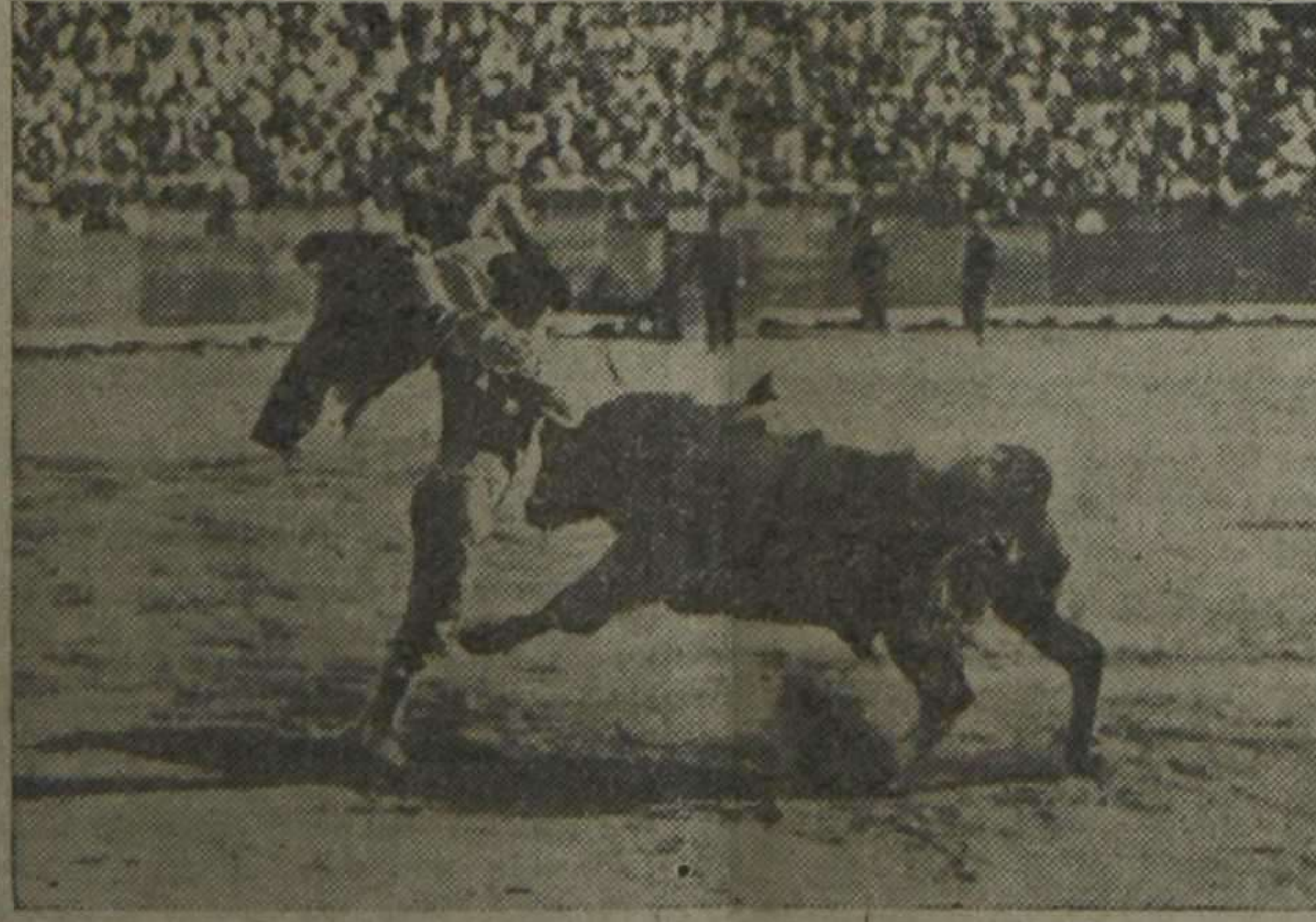
Vaquerito en el primer toro.

La Plaza se llena todos los días; ayer también, y cada tarde nos aburrimos más. No es cansancio, señores; es que no tenemos la suerte de ver nada extraordinario, sino vulgaridades, y de este modo no hay quien soporte ocho corridas seguidas sin bostezar por lo menos. Exceptuando la quinta corrida de feria, aquella de los Concha Sierra, lo demás ha sido indigno de la importancia del abono de Julio. Por eso los cronistas, puestos a tono con lo que vamos presenciando, decimos también, y cuando nos ponemos delante de las nuevas cuartillas, hemos de hacer grandes esfuerzos para no aburrir al público, como los toreros le aburrían en el circo. ¡Fué mala la novillada de ayer