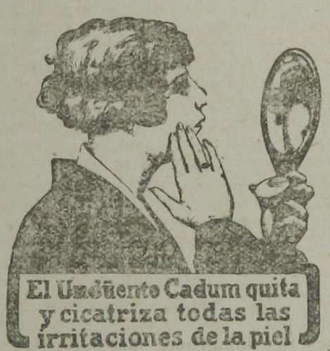
El Unguento Cadum quita y cicatriza todas las irritaciones de la piel.