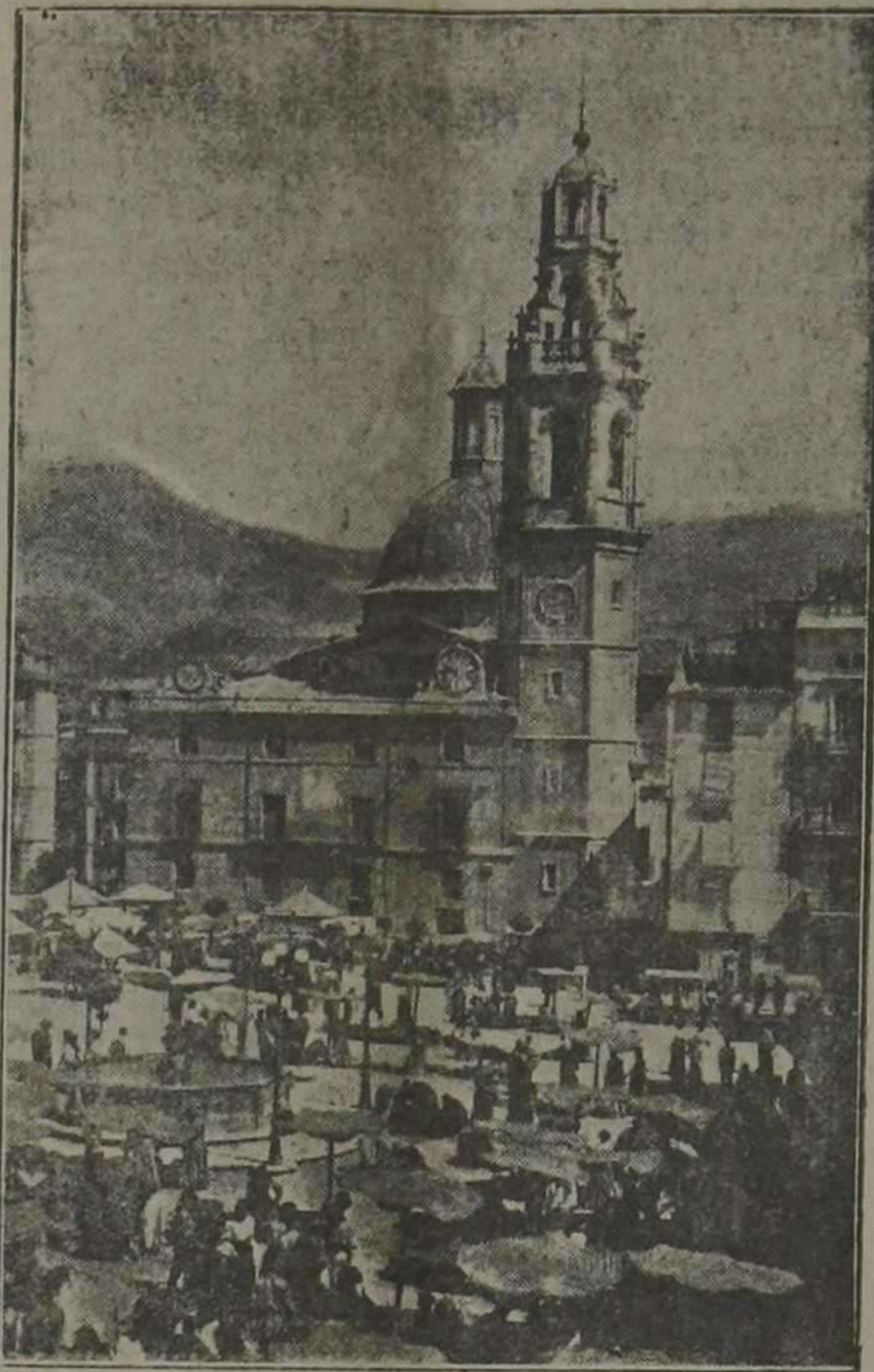
ALCOY. — Plaza del Mercado Al fondo, la torre parroquial. En esta plaza se levanta el castillo en las fiestas de San Jorge y se hace la embajada de moros y cristianos

Fabricante de Chocolates San Lorenzo, 12-Alcoy