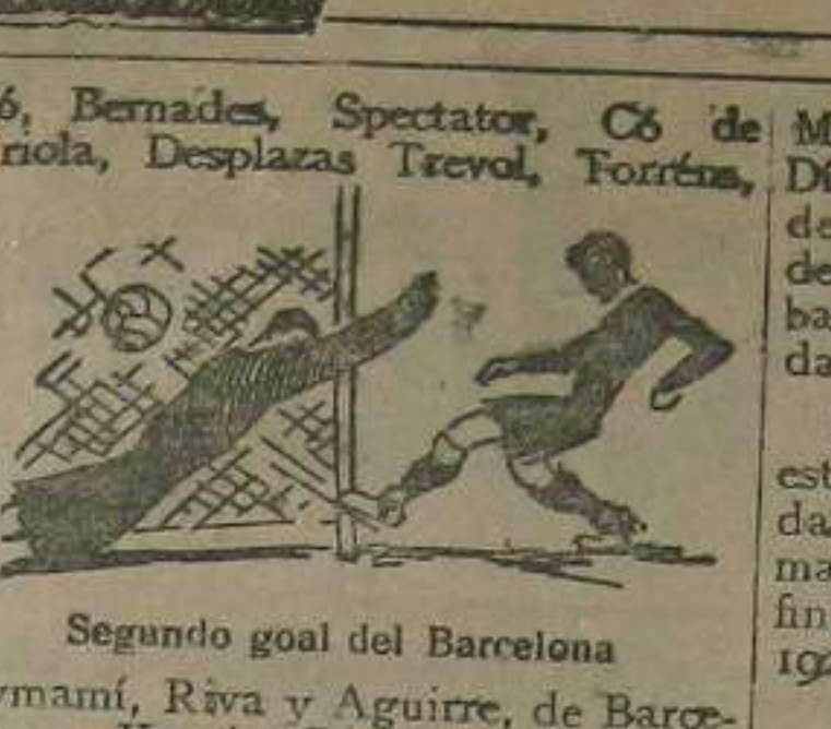
Segundo goal del Barcelona