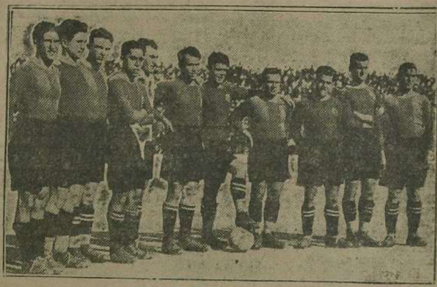
Equipo Barcelona F. C. que ayer conquistó el título de campeón de España 1926.

Eran ya las ocho cuando entraban los equipos en la ciudad. Todos iban alegres. Los unos, por su victoria; los otros, por lo que habían dificultado el conseguirlo. Banderas del Barcelona y del Madrid ondeaban vistosas al viento. Vencedores y vencidos en un mismo hotel; público amigo y adverso lle-