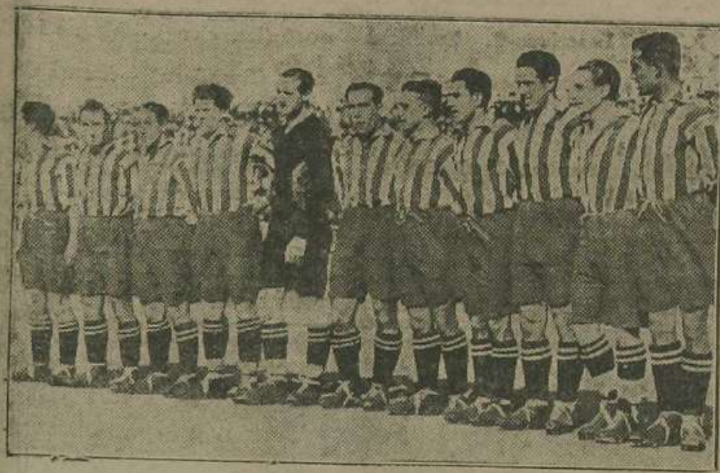
Equipo del Athletic F. C. que se disputó el título de campeón, perdiendo a pesar de su admirable actuación.